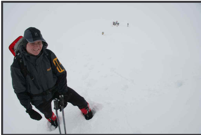
bei LWS 3 doch lieber zur Höferspitze abbiegen!