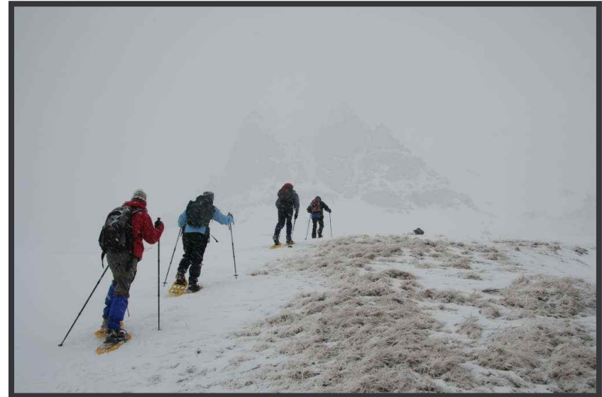
Kurs halten Richtung Widderstein, aber ...