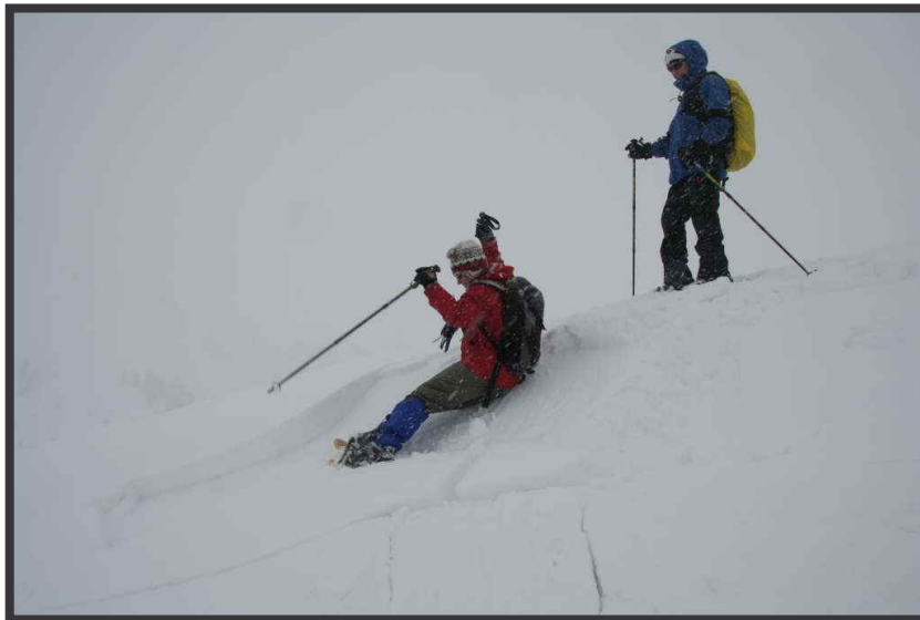
Böschungstest macht Freude ...