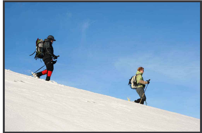
Abwärts geht's ...