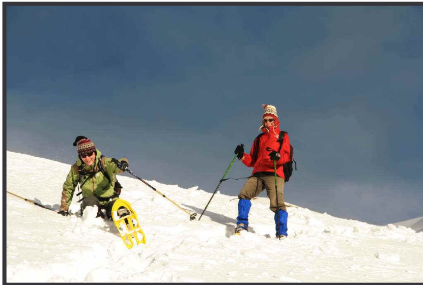
... am Hahnleskopf Westrücken.