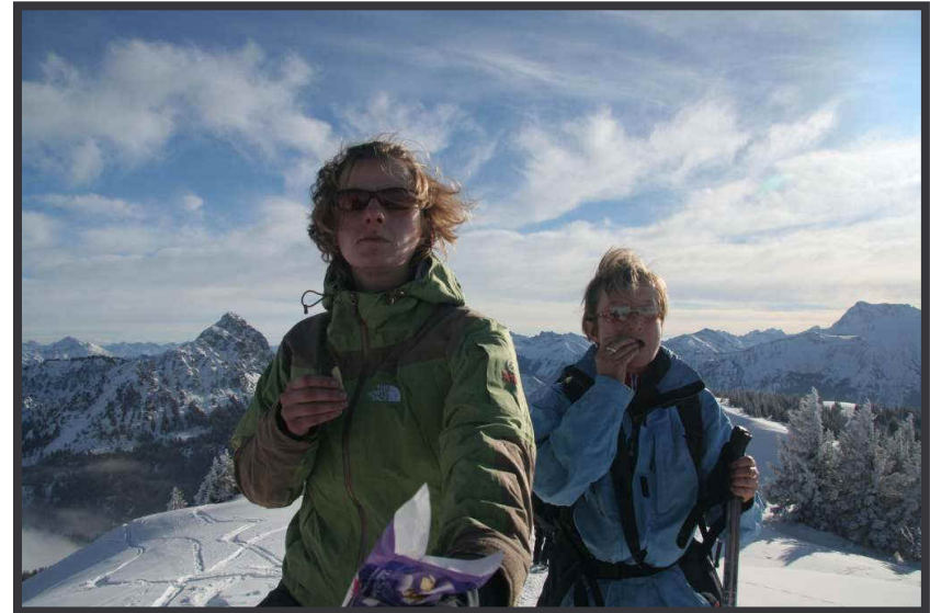
Gipfelschokolade statt Gipfelschnaps!