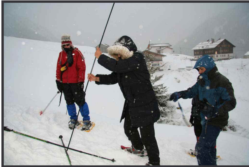
Meist saß der erste Sondenstich!