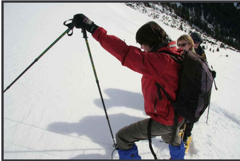
Das Pendel schlägt richtig, der Hang passt!