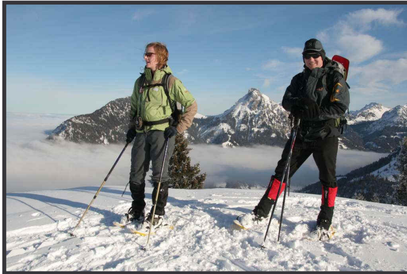
Traumpanorama vor dem Aggenstein