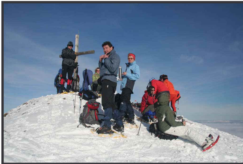
Der Schneeschuhkurs auf dem Schönkahler