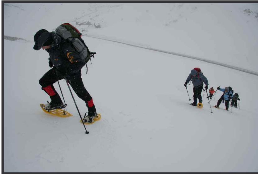
Steiler Aufstieg vom Hochtannbergpass.