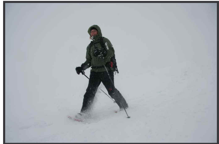
Neuschnee lässt den Schneeschuh stauben!