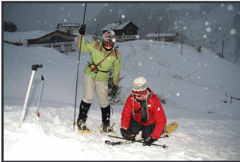
Punktortung vorm Edelweißhaus