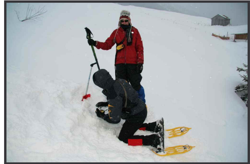
Zwingt zum Niederknien ...