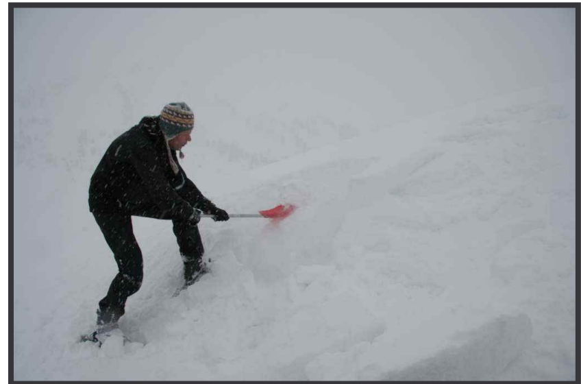
KO-Test noch mehr!