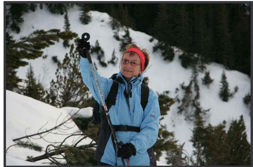
Wo gibt's Finderlohn für Schneeteller?