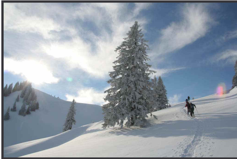
Trügerisch schöne Winterlandschaft (LWS 3-4)