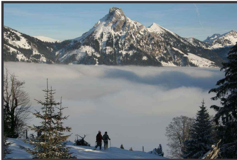
der Nebel der Inversion ...