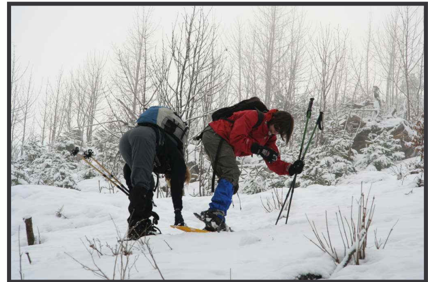
Steighilfemontage - Ingenieursstudium hilfreich!