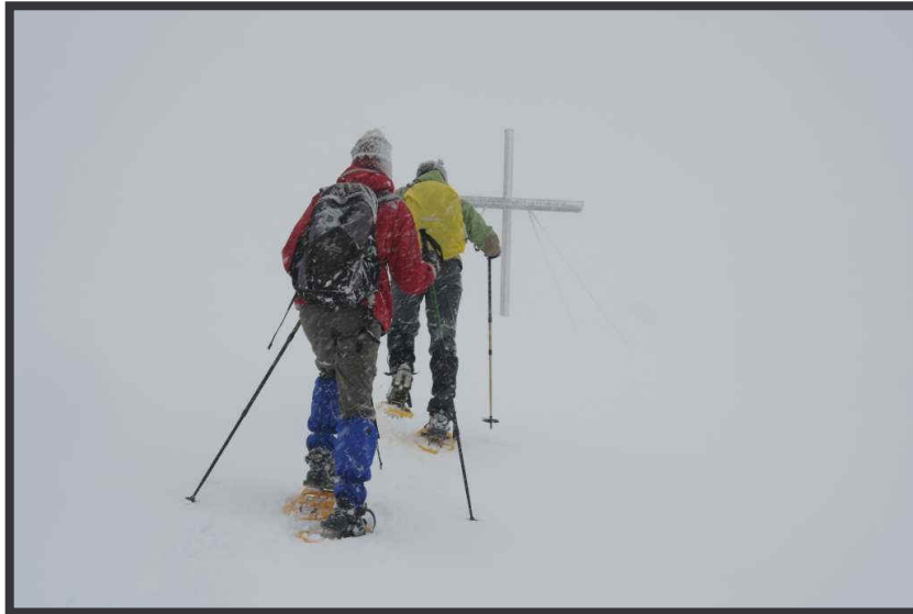
Im Schneesturm, trotzdem immer Richtung ...