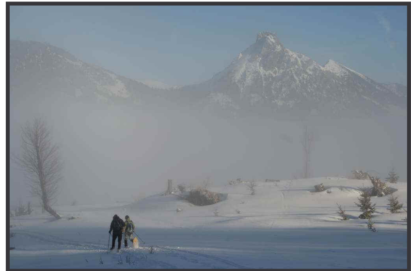
wartet als Abschluss.