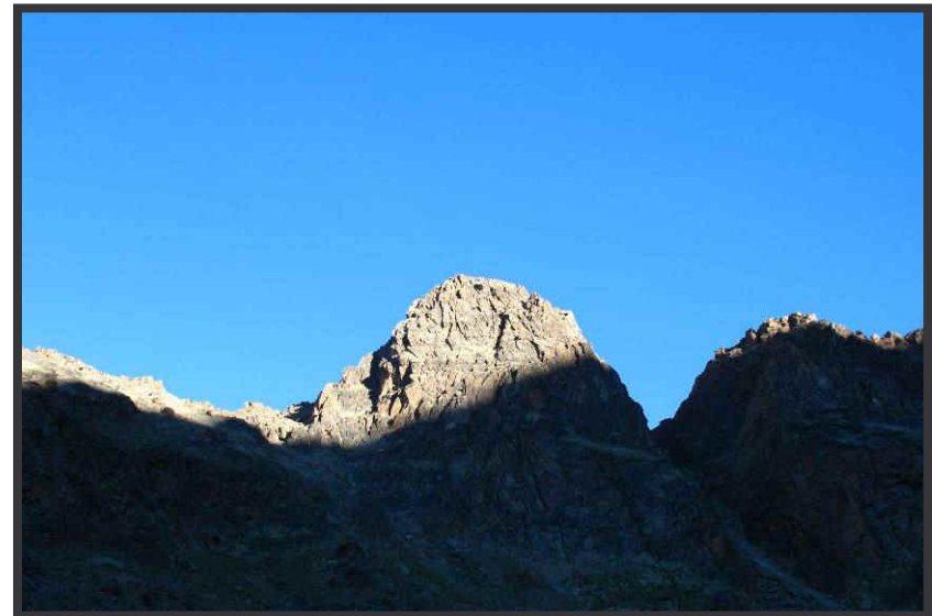
Jegihorn im ersten Sonnenlicht.