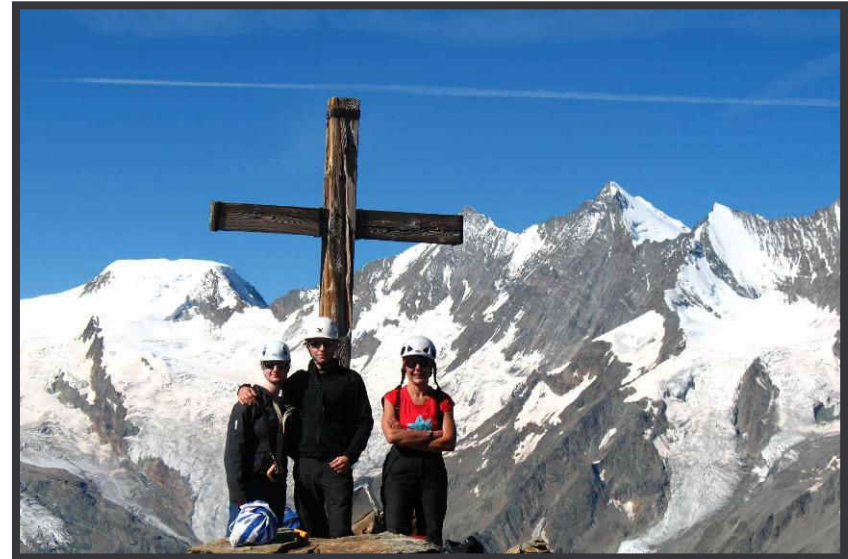
"Kleine" Bergsteiger vor großen Wallisern.