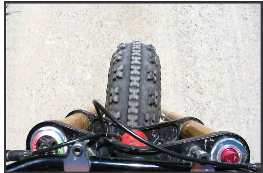
1000 Mal schöner als die Seilbahn ☺