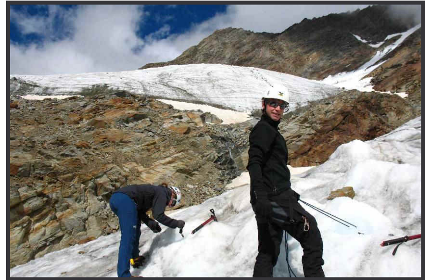
Schrauben und Pickeln im Eisbruch.