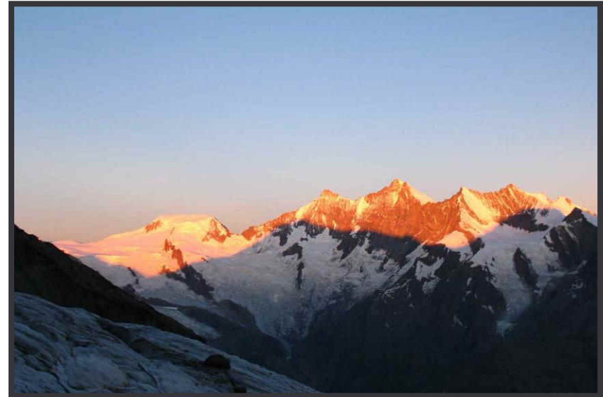
Dom & Co. bei Sonnenaufgang.