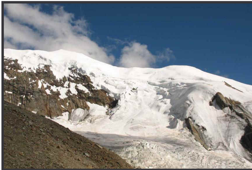
Das Weissmies zeigt sich kurz.