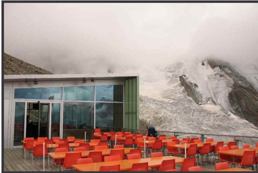
Hohsaashütte (3100 m) - moderne Ausblicke!