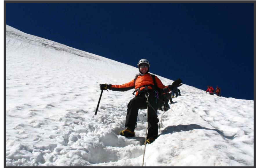
Steiler Hang zum Gletscherbruch.