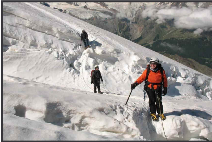
Riesenspalte, gut mit Schnee gefüllt.