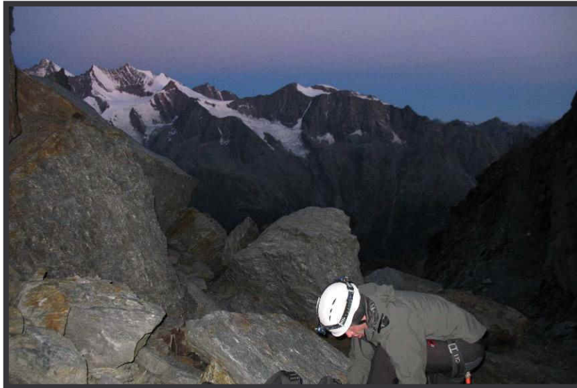
Steigeisen anlegen in der Dämmerung,