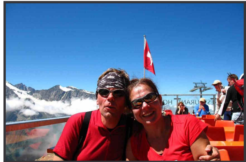
... Besteigung des Weissmies.