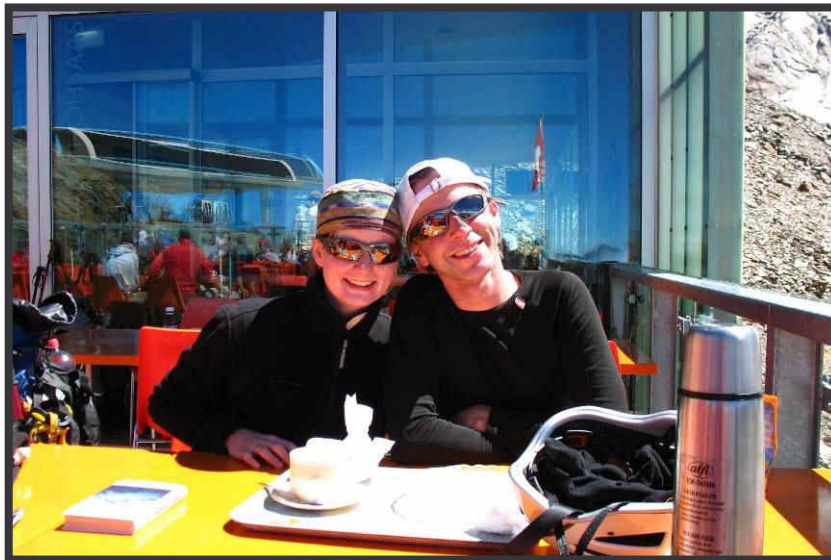
Freude nach erfolgreicher ...