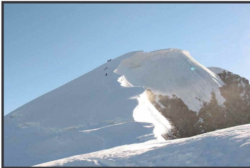
Der Triftgrat leitet steil zum Gipfel.