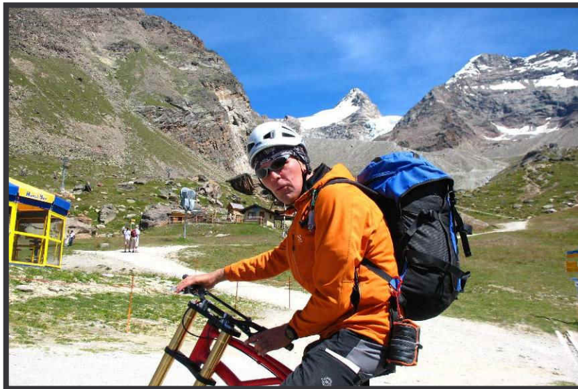
Abfahrt mit dem "Dirt Monster" ...