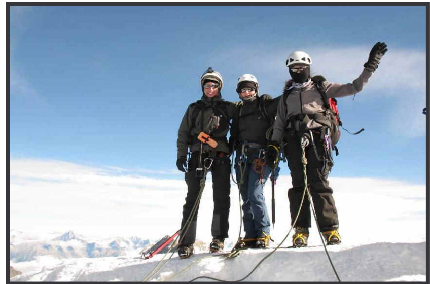
Taliban? Nein, frierende Bergsteiger am Gipfel.