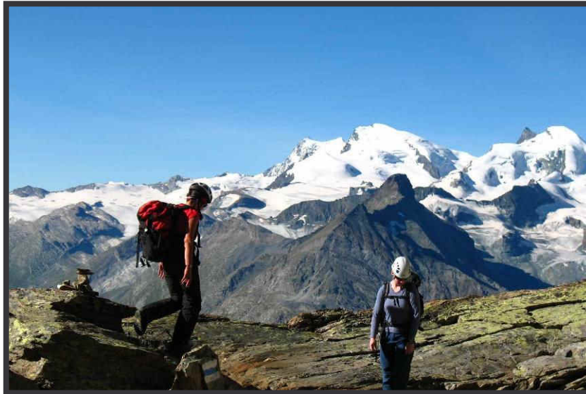
Normalweg vor großer Kulisse.