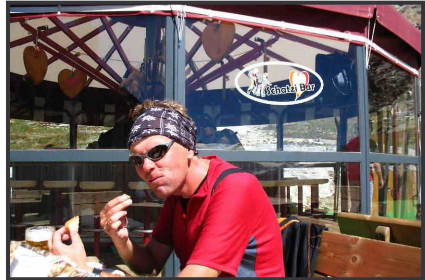
Grimmiger Blick beim Anblick der "Schatzi-Bar".