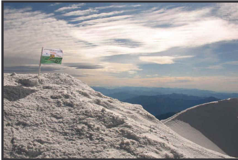
Gipelfahne (siehe: www.sachsen-4000.de )