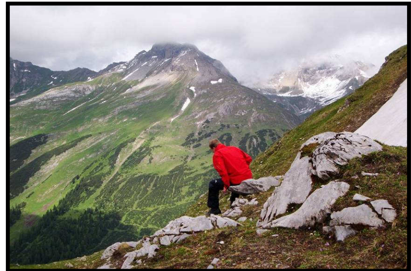
Aussichtslage über'm Kaisertal.