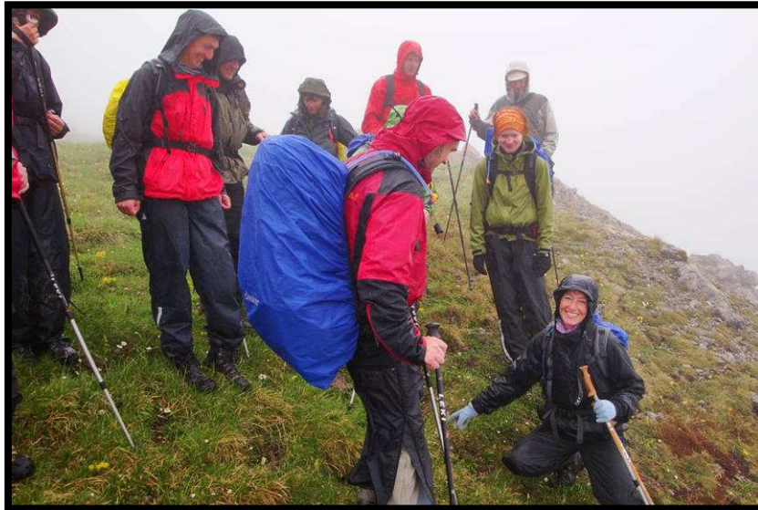
Alpenblumenkurs, leider ebenfalls im Regen.