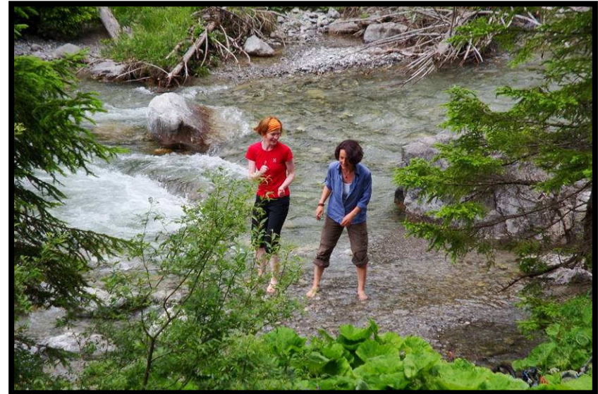
Nach 3 Tagen BTGK brauchen die ersten Füße Wasser!