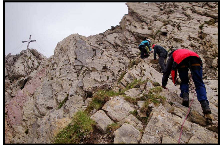
leitet zum nahen Gipfel.