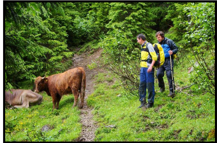
Zottelviech zwingt zu Umwegen.