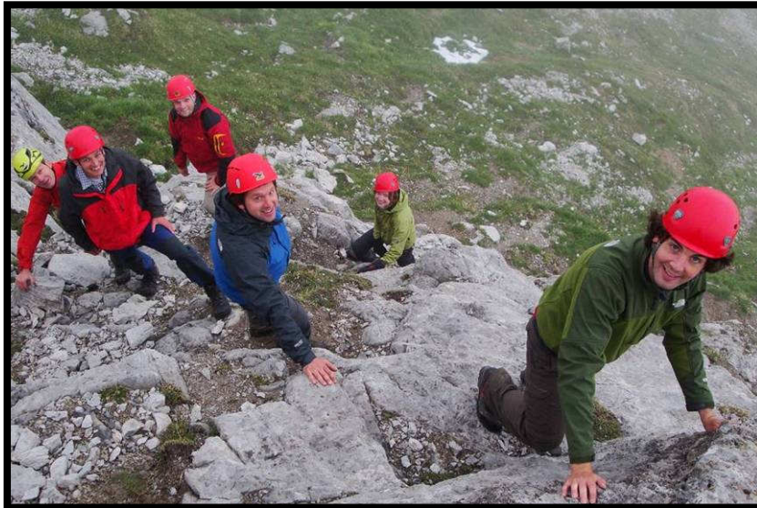
Felsgeländeübungen gibt's noch vor der Suppel!