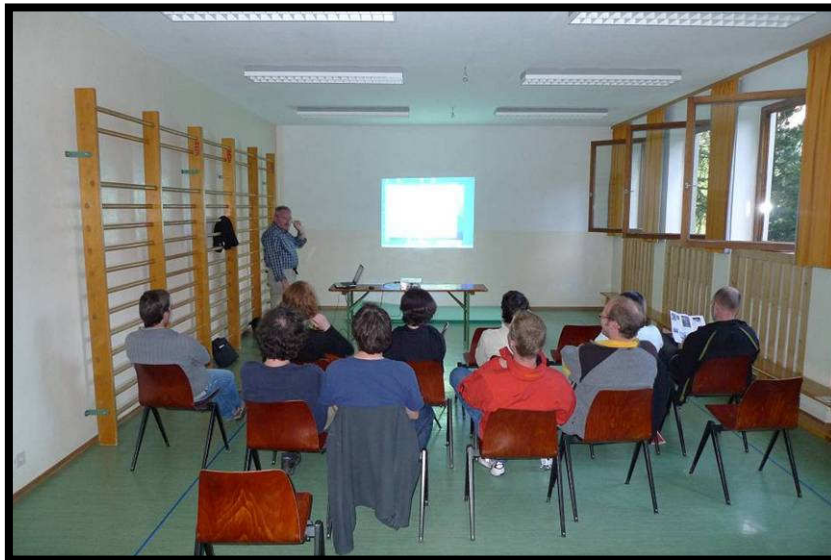
... 'grauen' Wettertheorie.