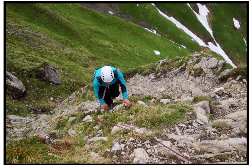
Mit Helm und Selbstsicherung am Fixseil.