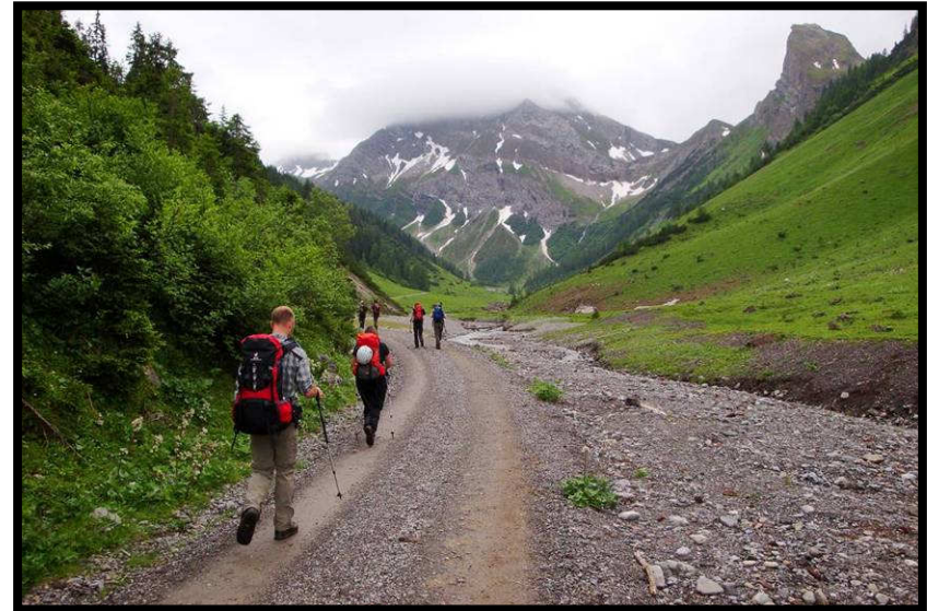
Der lange Kaisertalanmarsch.