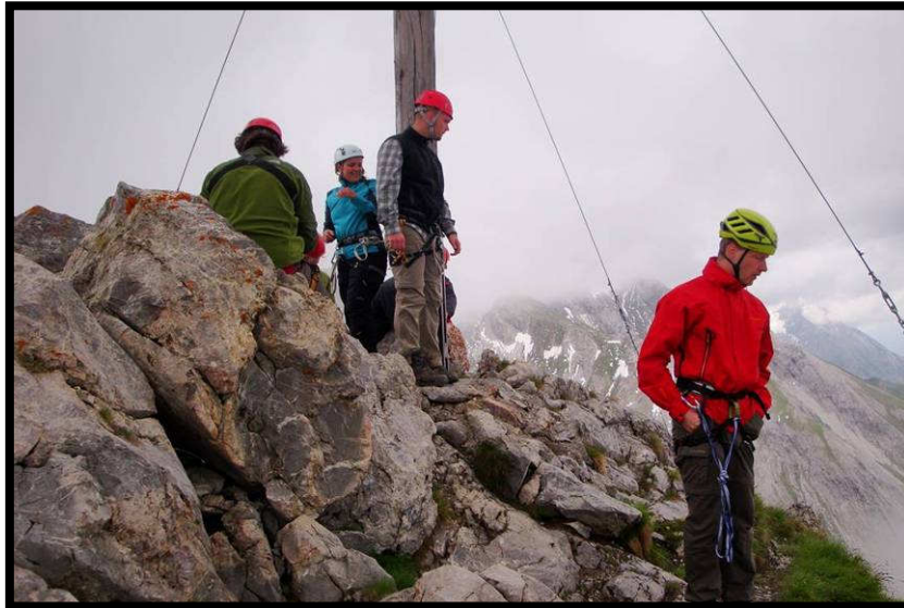
Ziel erreicht: Malatschkopf.