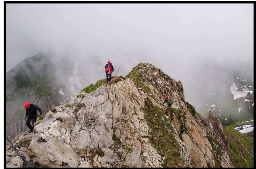
und ein kurzer, schmaler Grat.