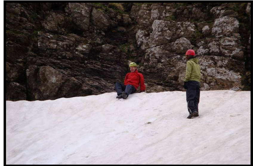
Nach Suppe und Saft dann Firnsturzübungen.