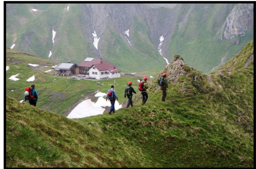
Das Kaiserjochhaus lockt, muss aber noch warten.