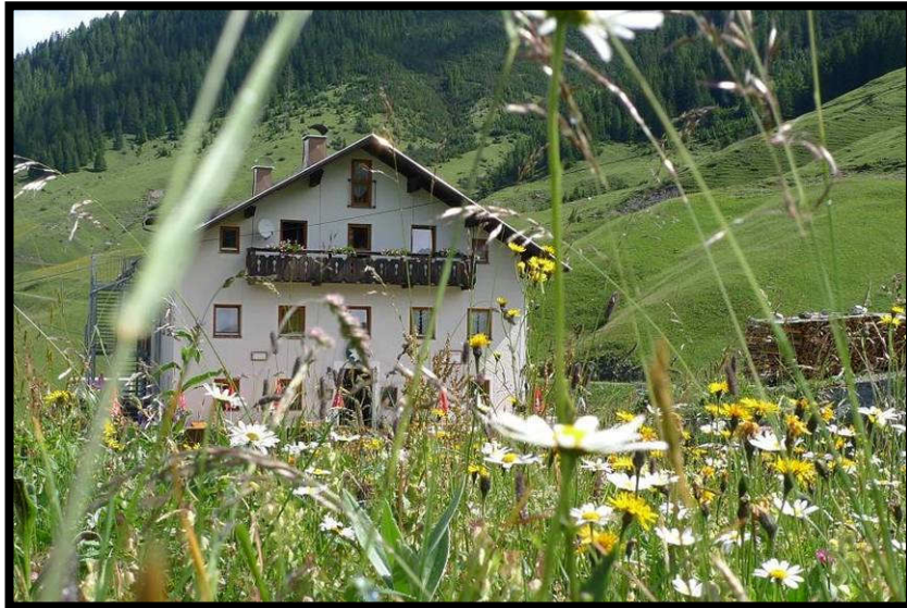
'Edelweißhausblumenpracht' beim BTGK 2009.