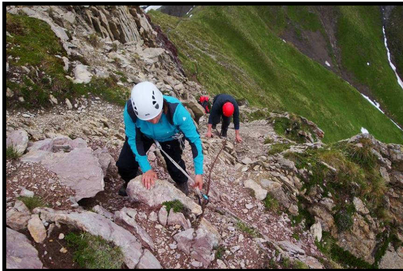
Oben raus noch etwas echtes Eisen,