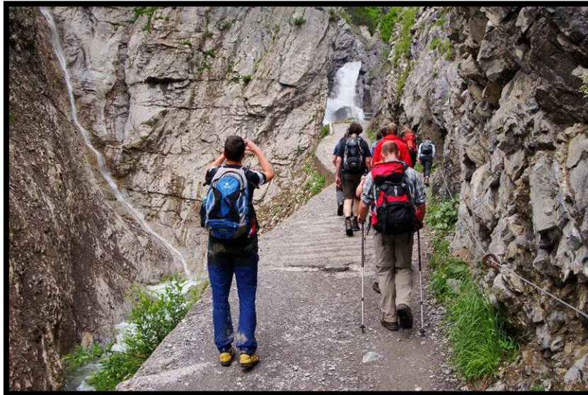
Die Simmswasserfälle, immer ein Foto wert.