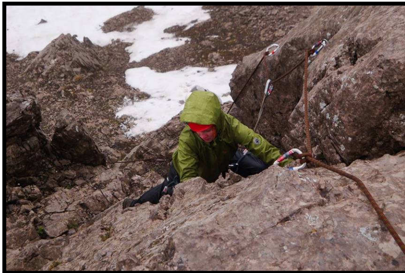
Nasse Felsen machen den Klettersteig gleich mal deutlich schwerer.