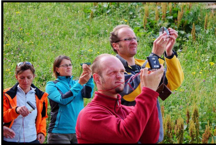
Aber die Praxis folgt: Peilen,