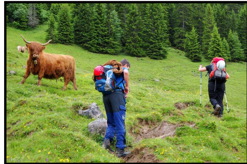
Zottelige Gesellen auf dem Weg zum Klettersteig.