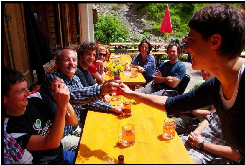
Der Dank der Teilnehmer ...