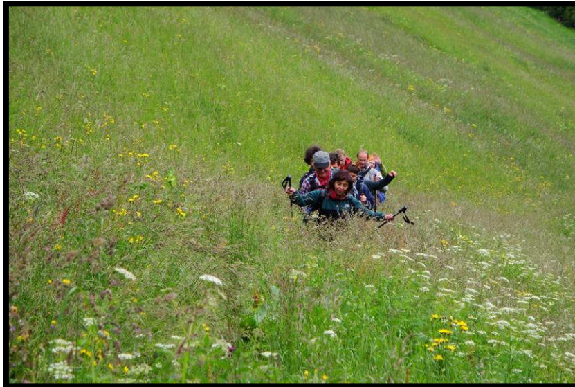
Kinnhohes Blumenmeer vor Kaisers.