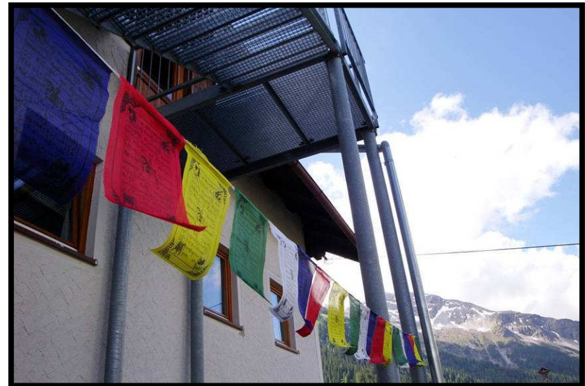
Neu am Edelweißhaus: Gebetsfahnen verschönern die Feuertreppe!