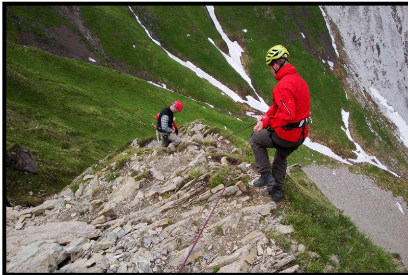
dieses Mal mit 'Franzosen'prusik.