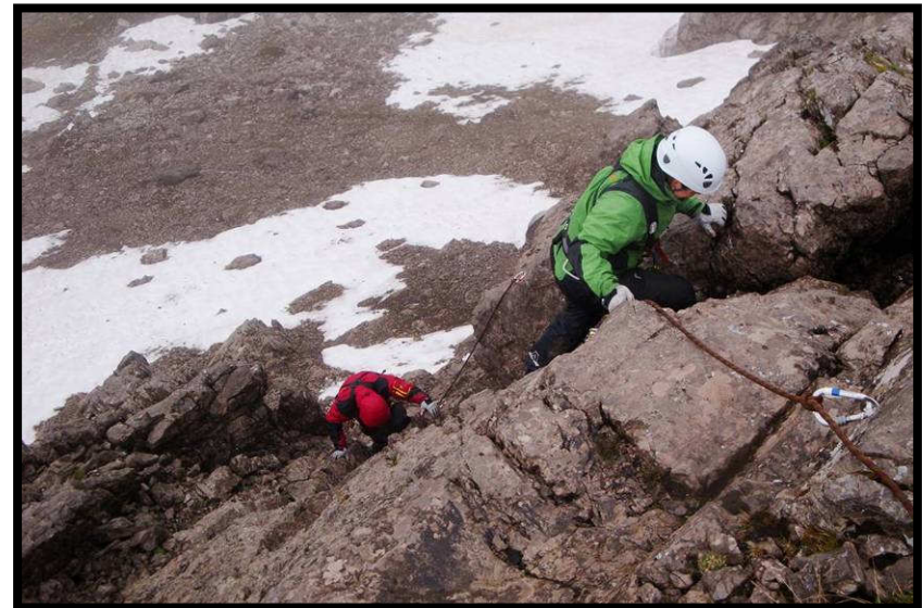
Trotz Härtetest für Gore & Co: beste Stimmung!