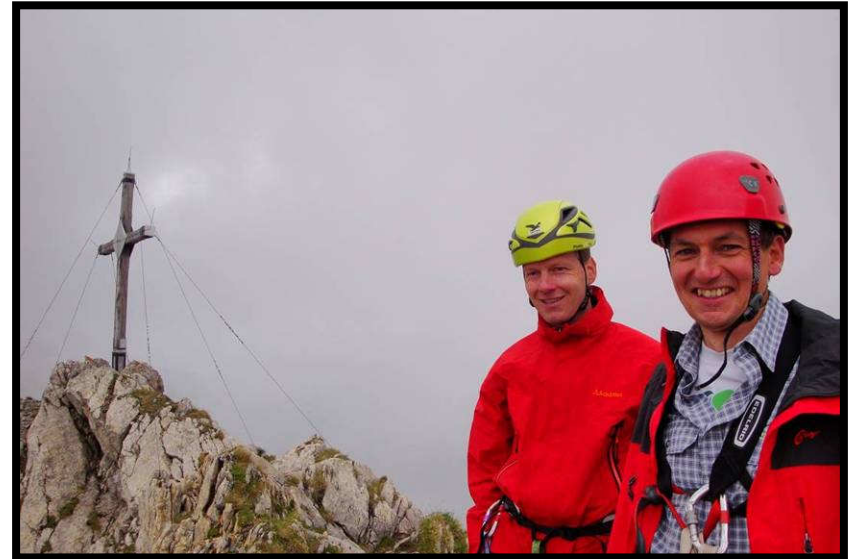
Schon wieder auf dem Rückweg,