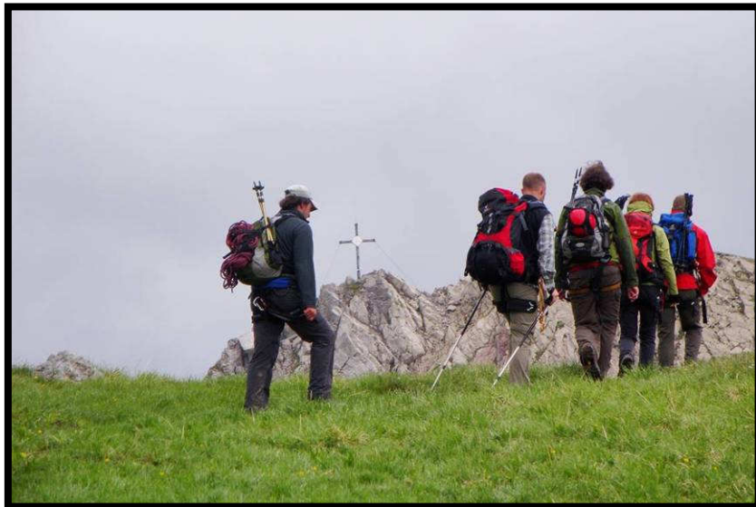
Am Ende lockt dann der Malatschkopf (2388 m).