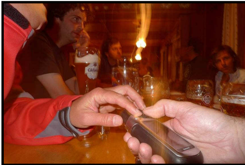
Hüttenspielzeug für Männer: das GPS-Gerät!