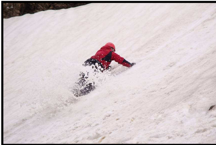
Nur echt, wenn der Schnee stäubt!