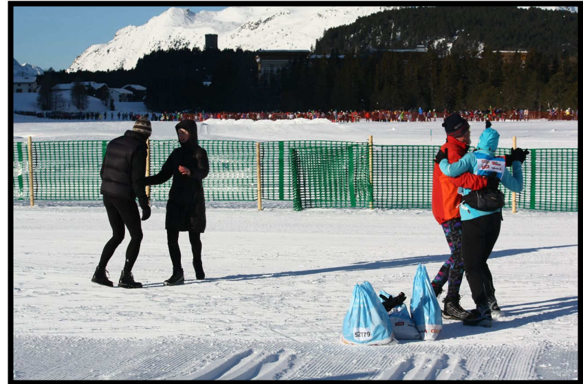
Warmtanzen in Maloja,