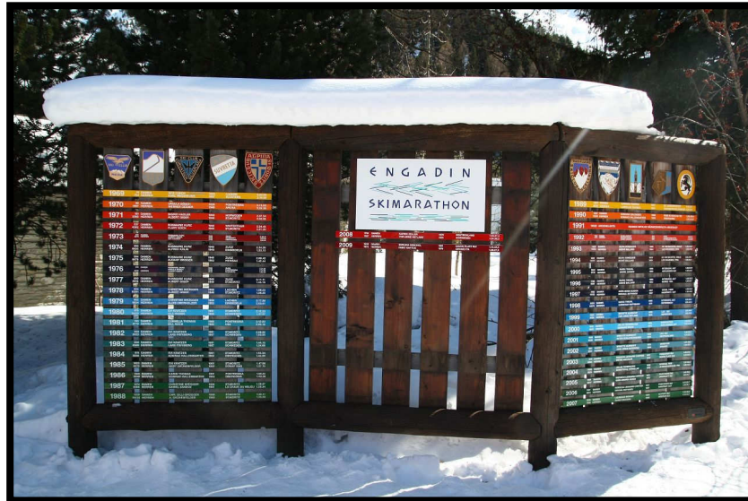
Ans legendäre Marathon-Siegerportal ...