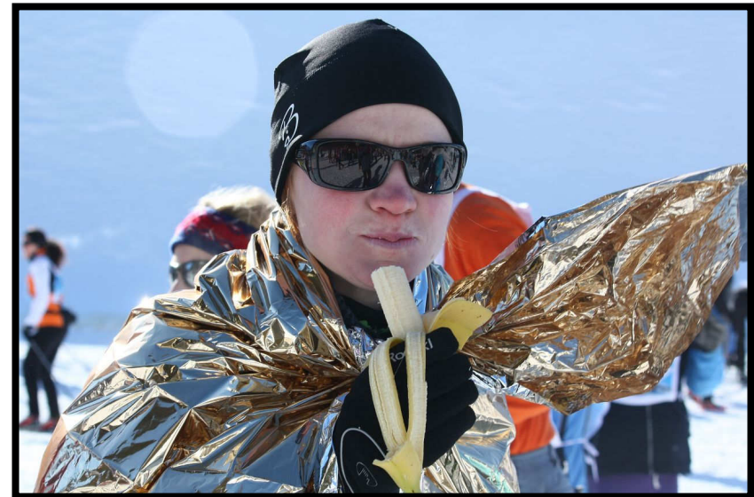
Eine Banane geht immer noch ;)