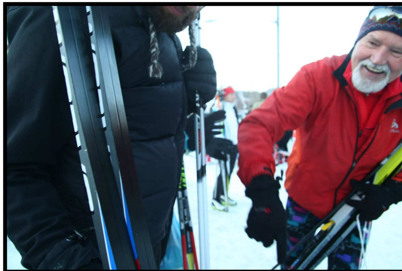
Kontrolle durch 'Wachs-Wächter-Werner'!