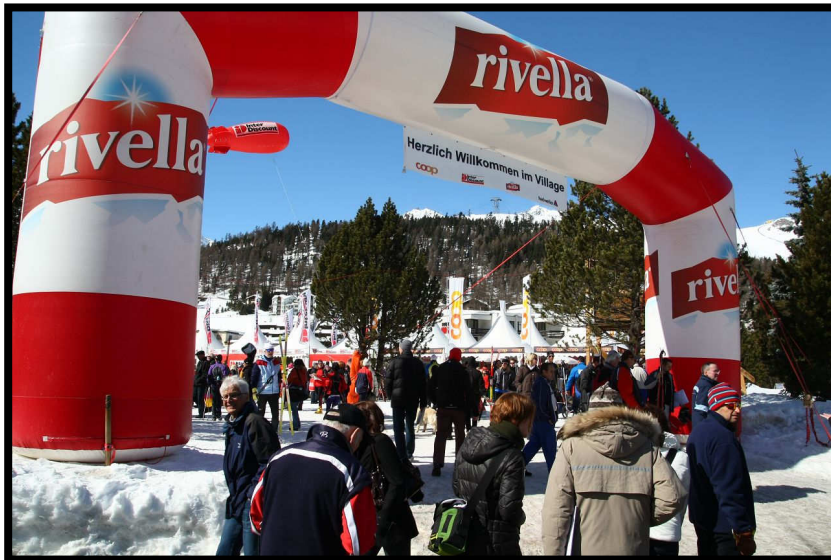
Marathondorf: shoppen und genießen.