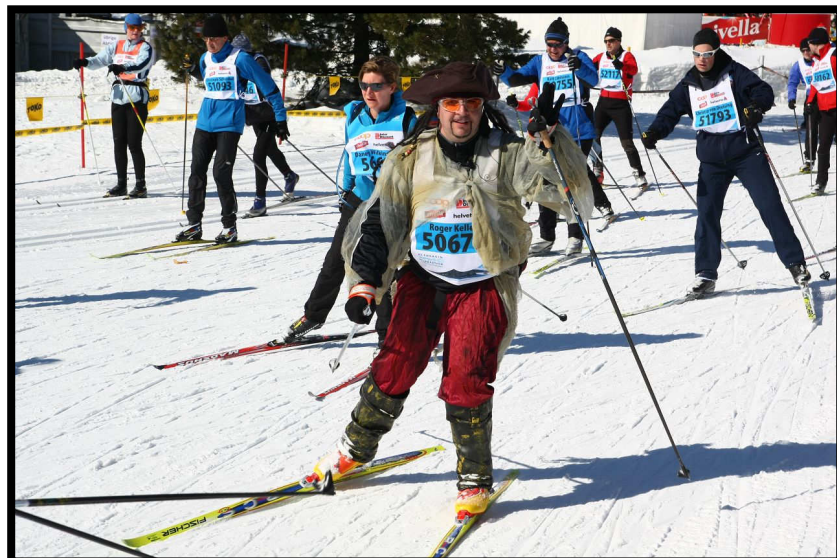
Achtung: Piraten entern den Marathon!