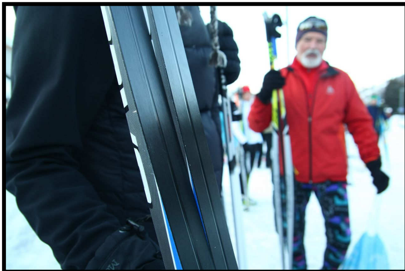
Wurde auch richtig gewacht?