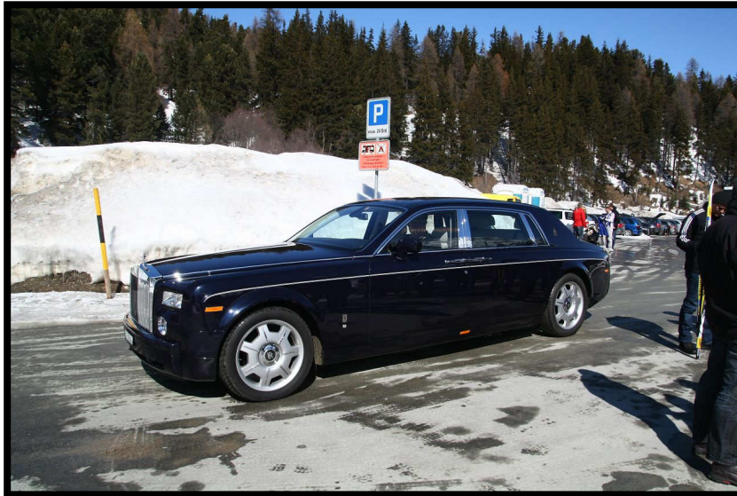
St. Moritz: nächstes Jahr wollen wir auch so anreisen! Ob der DAV das zahlt???