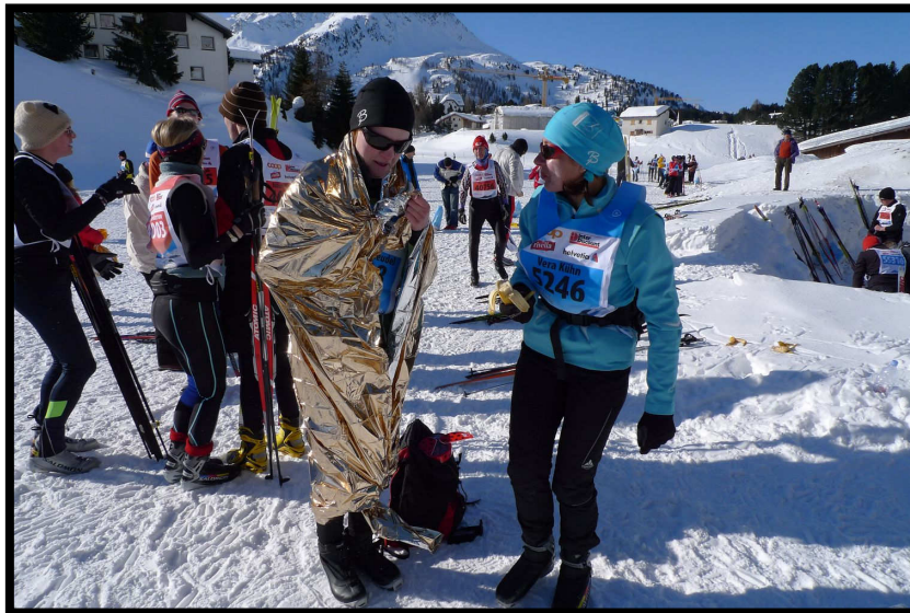
Rettungsdecken, der letzte Schrei unter den Langläufern 2010.