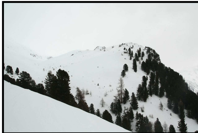
Ein-Arm-Schneeschuhtest zum Paradis (2540 m, Blick von der Alp Languard).