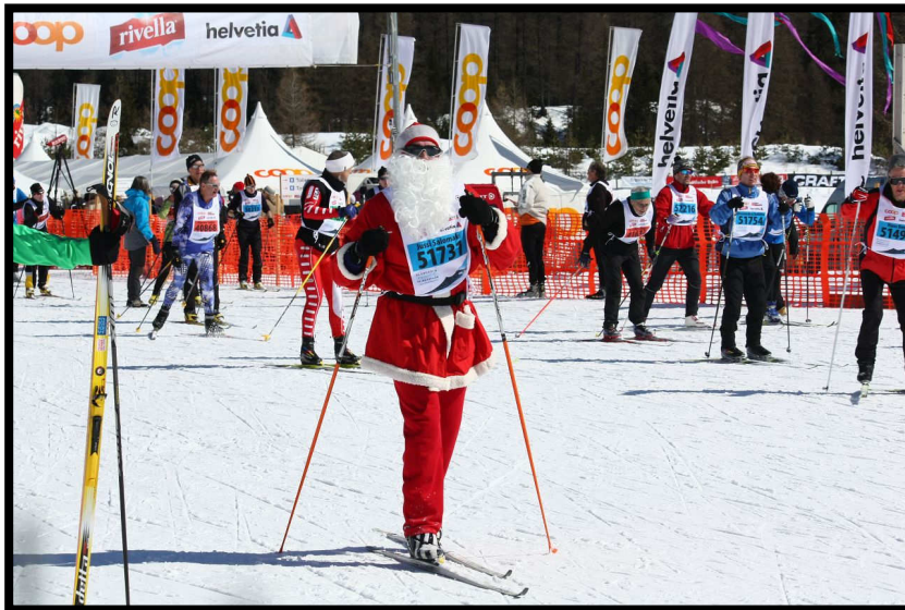
Ein finnischer Nikolaus hat's Ziel erreicht.