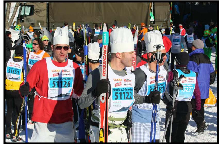
Manche trauen der Verpflegung an der Strecke nicht und kochen lieber selbst.