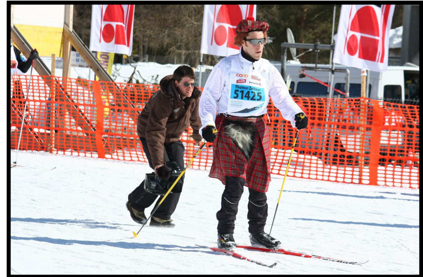
Die Schweizer können's nicht lassen, müssen die Schotten sogar unterm Rock filmen ;)