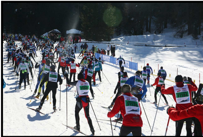
St. Moritz Bad, jetzt geht's hoch zum Stazer See!