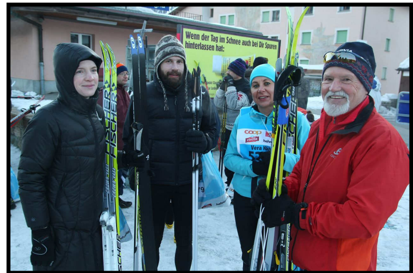
Frieren am Bahnhof in Celerina.