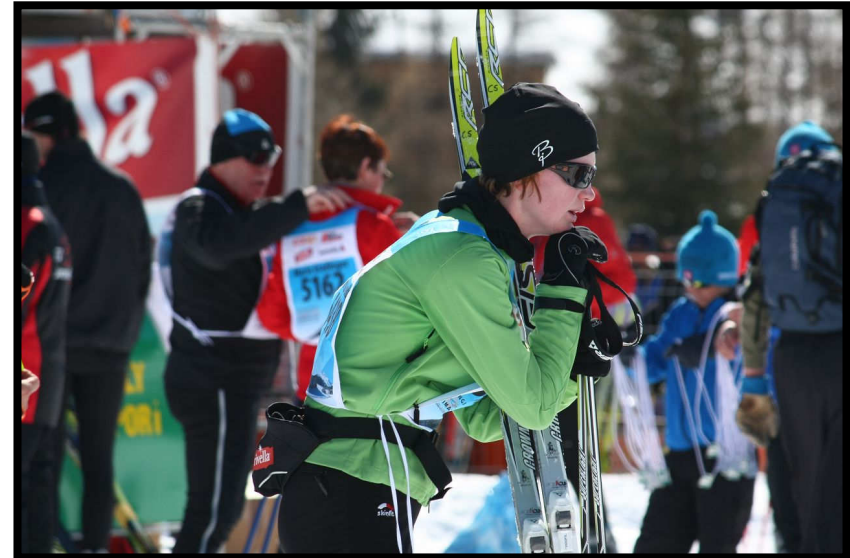
muss aber erstmal die 42 Km rekapitulieren.