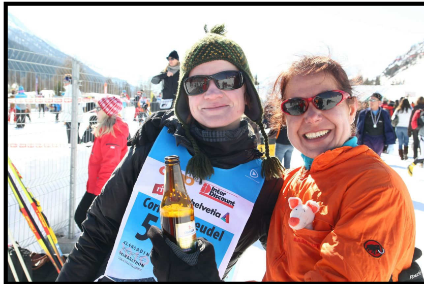
Dann wird aber gleich gefeiert, hoch die Tassen!