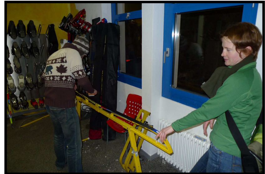
... werden wir trotz perfektem Wachsen sicher nicht genagelt werden.