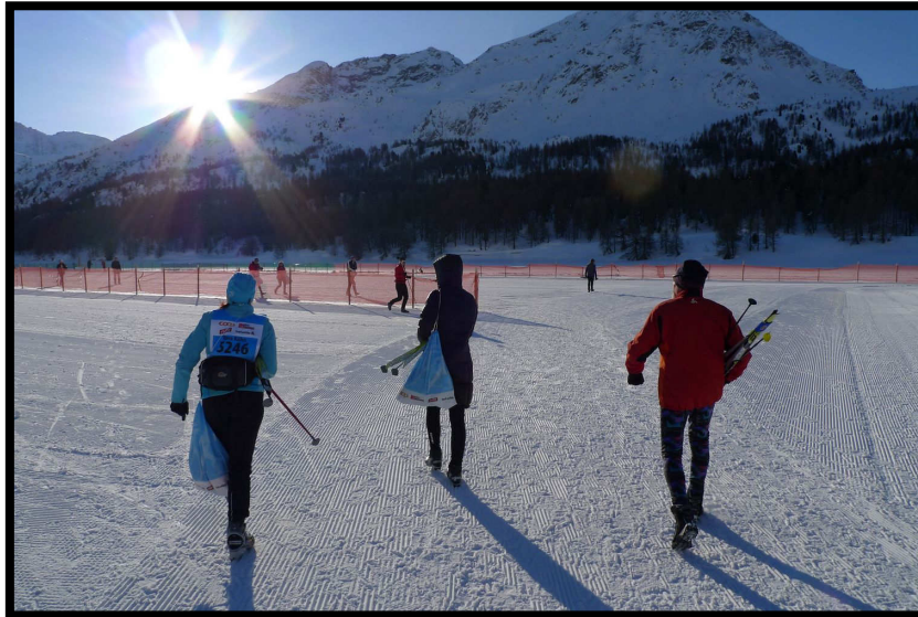
Einmarsch der Remstaler im Startgelände von Maloja.