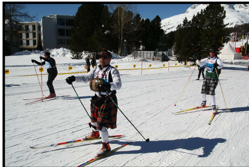
Was wäre ein Schotte ohne ...? Whisky-Fass und Schottenrock!