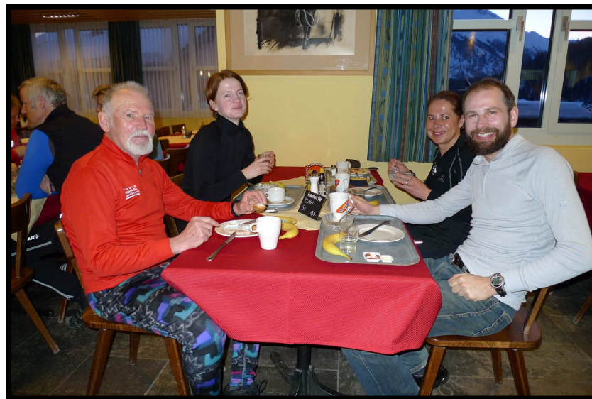
Gute Stimmung beim Marathonfrühstück.