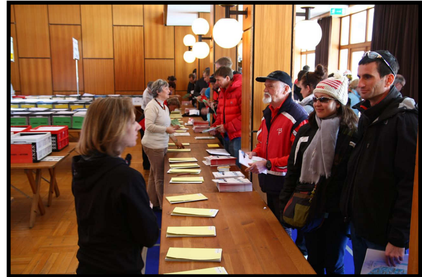
Das Fieber steigt: Startnummernausgabe.