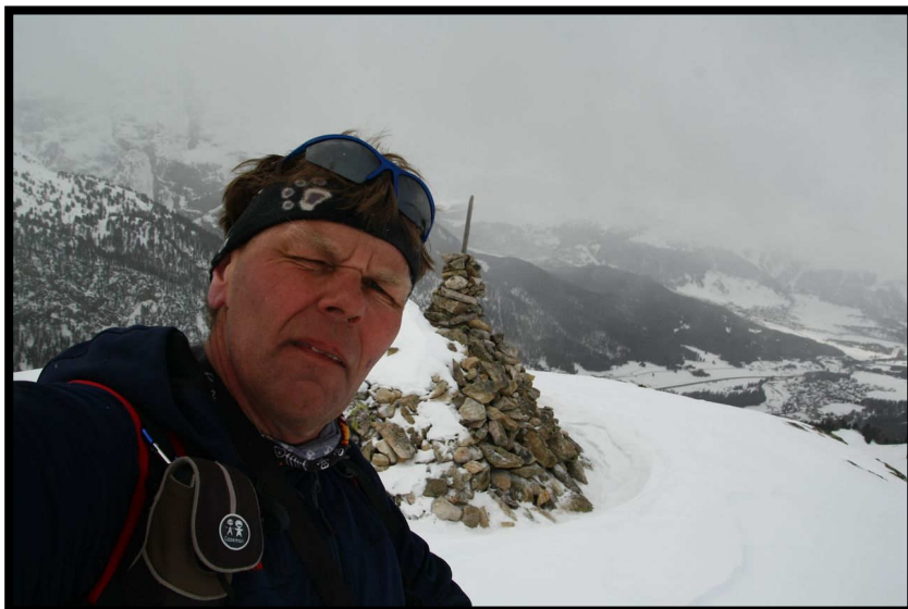
Am Montag gar nicht so paradiesisch,