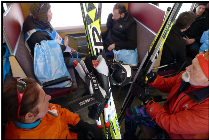
Und alle träumen schon vom Abendessen: Rückreise nach Celerina.