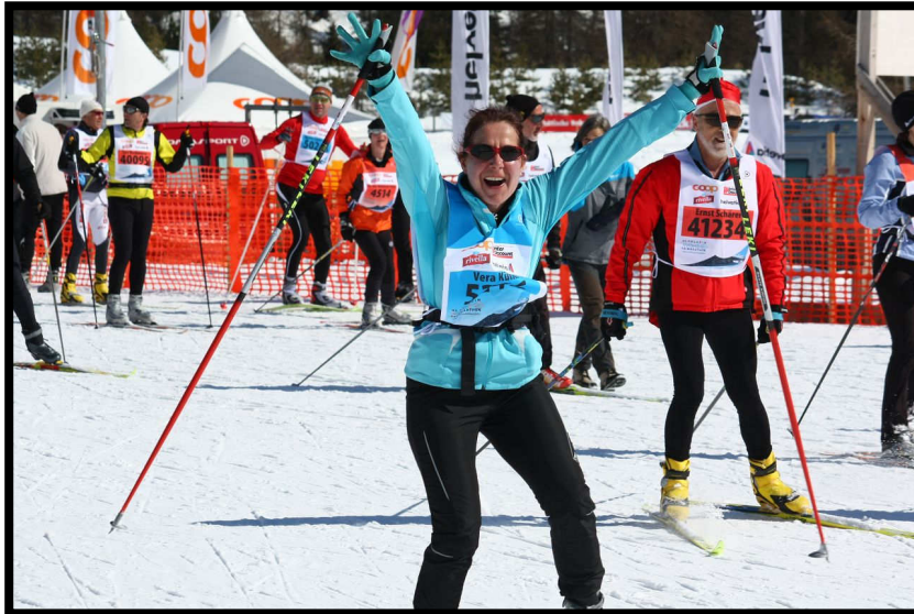
... und jubelt erstmal kräftig über ihre persönliche Bestzeit.