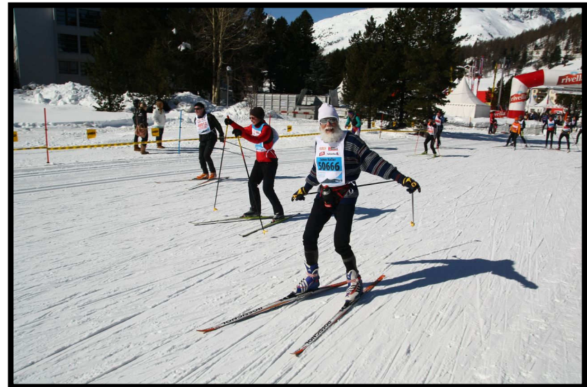
Auch dieses Mal wieder alle Altersklassen vertreten.