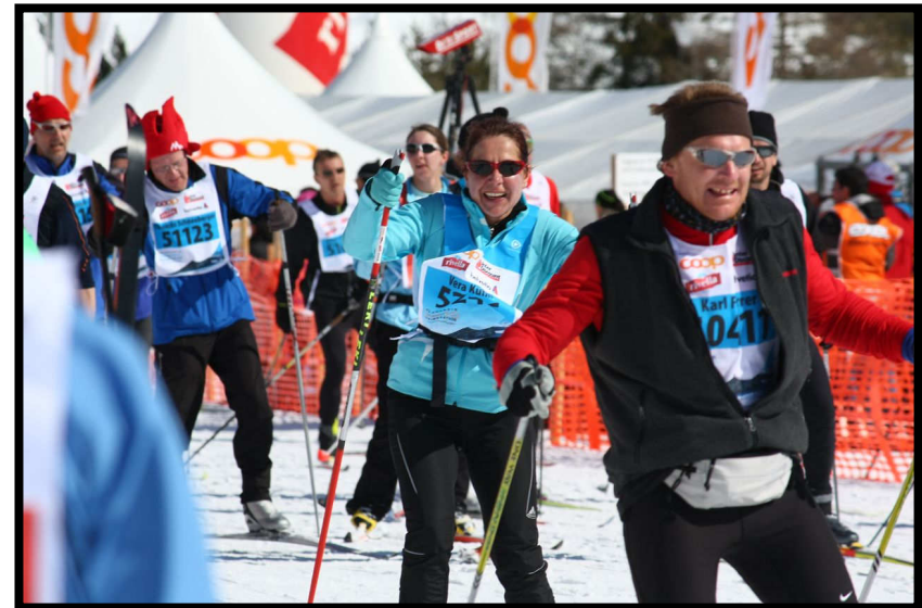
Vera stürmt rein in 3:25 h ...