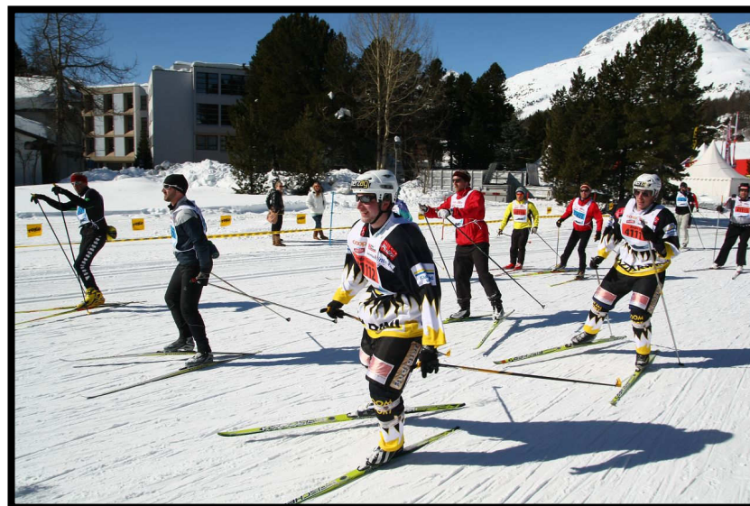
Eishockey-Spieler mit neuem Gleitgerät.