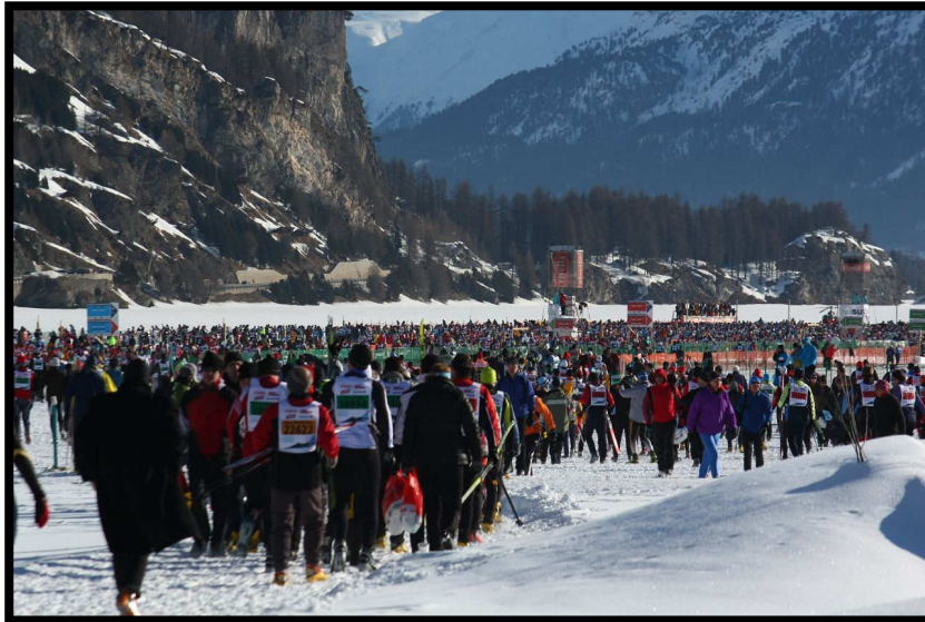
Die Massen (12000) strömen zum Start.