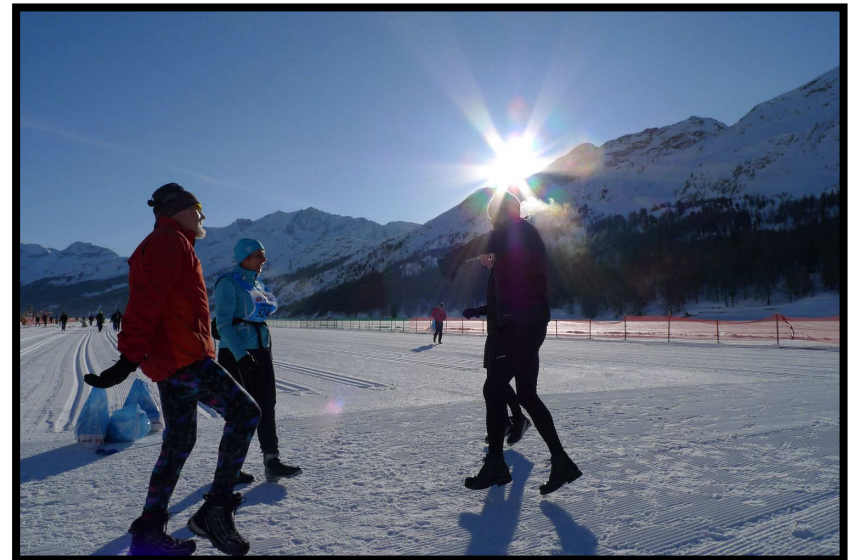
dann Schütteltanz à la Woodstock.