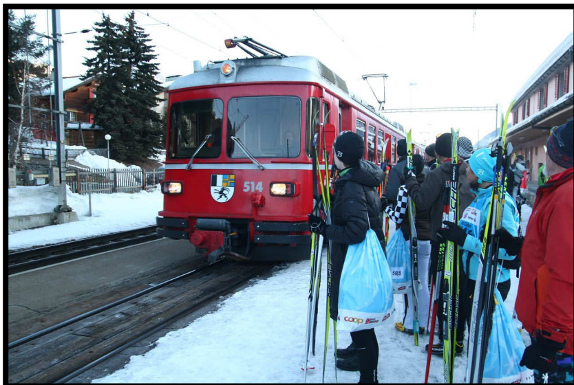
Kaum zu glauben, die Rhätische Bahn hat Verspätung! Doch dann kam doch noch der Zug,