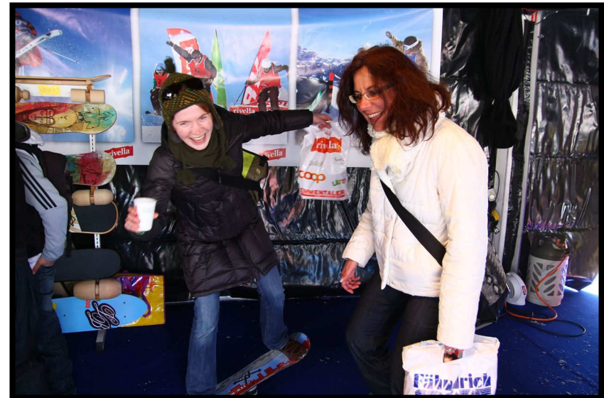
Gleichgewichtsübung, immer gut für Marathonfrischlinge ;)