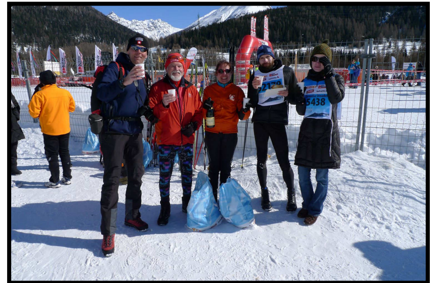
Gruppenbild mit allen, auch dem Fotograf.