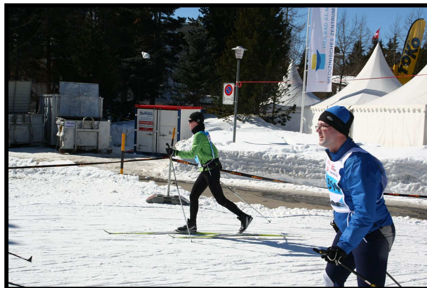
Conny die Klassikerin, eleganter Diagonalschritt, wie immer.