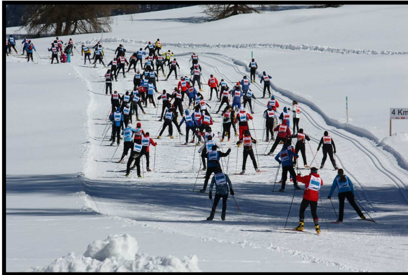
Hier muss man nochmals kräftig beißen: die legendären 'Golanhöhen'.