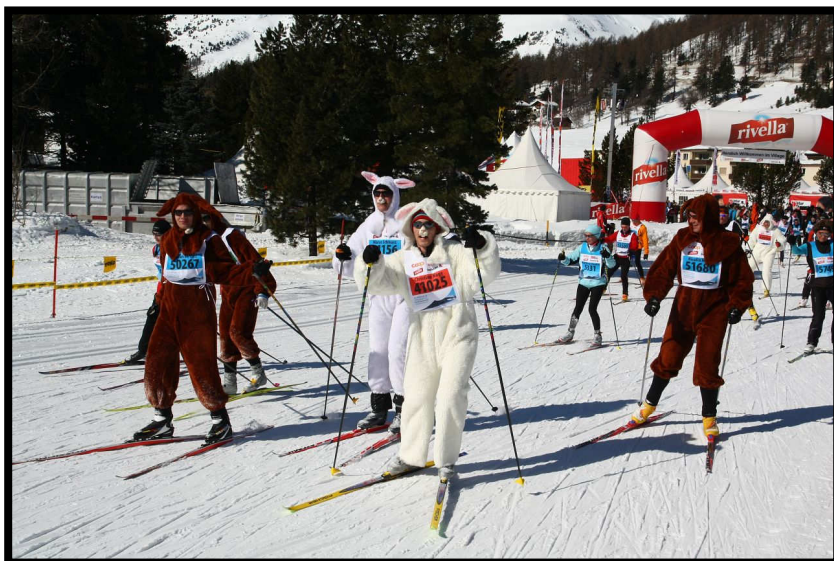
Selbst Hasen dürfen im Engadin starten.