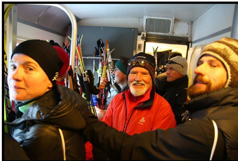
krachvoll wie immer, aber irgendwie kommen alle unter.