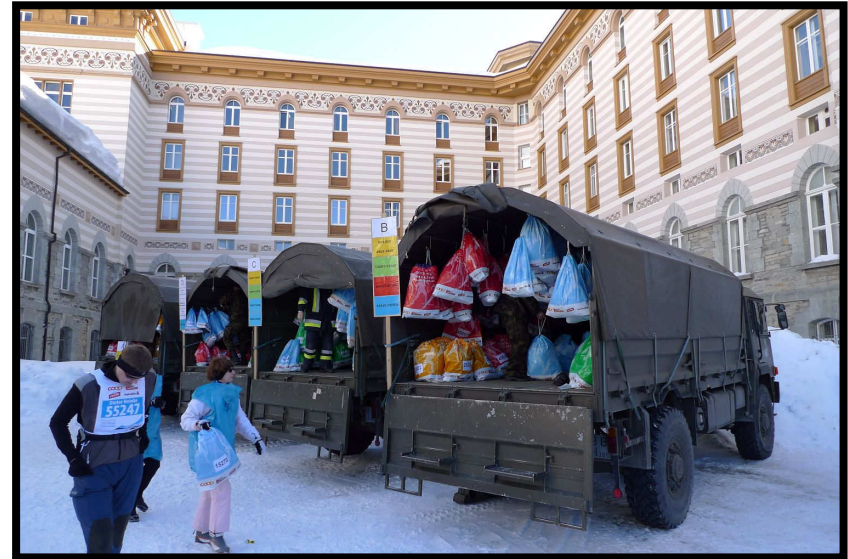
So sicher wie Fort Knox: Effektensäcke beschützt vom Schweizer Militär!