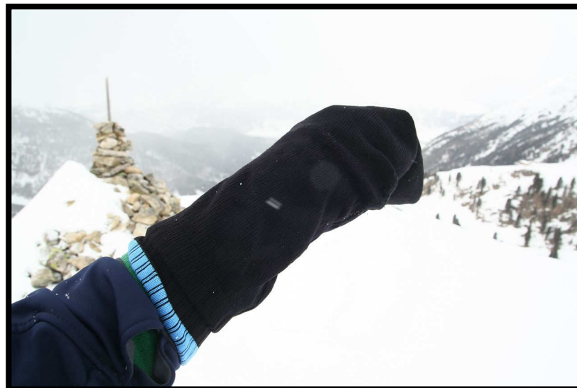
ob's an der neuen (Strumpf)Handschuhmode lag ;)