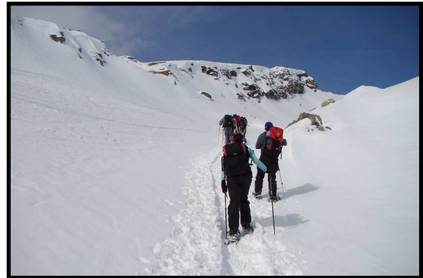
Mächtige Wechten säumen den Weg, ist's wirklich nur ein 2er? Zweifeln ist erlaubt.