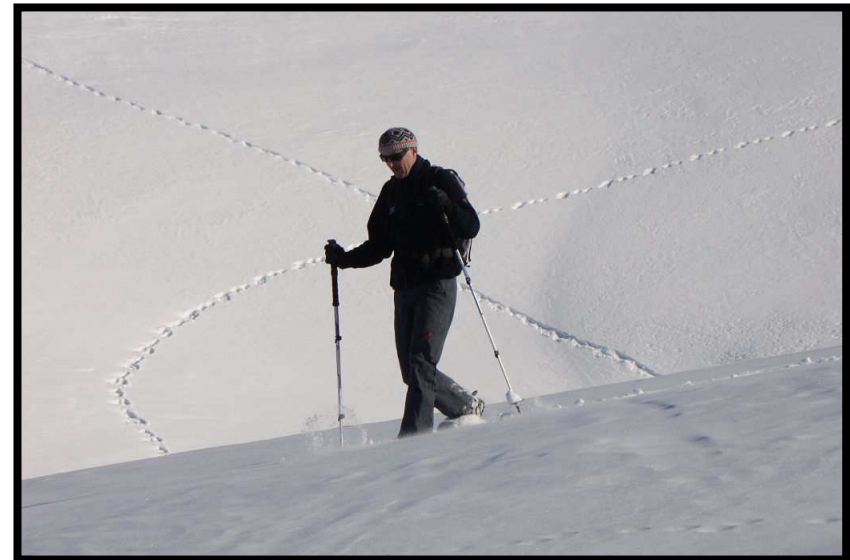
Günther im Fadenkreuz der Schneehasen.