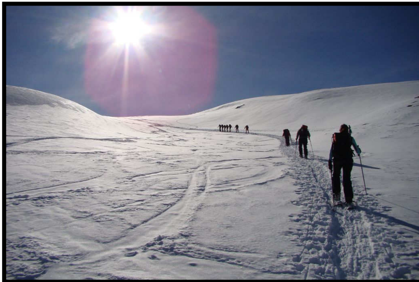
Immer der Sonne entgegen.