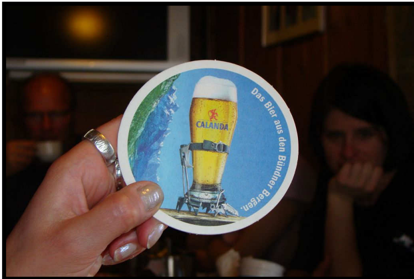
Schweiz halt, hier müssen selbst Biergläser Steigeisen tragen ;)