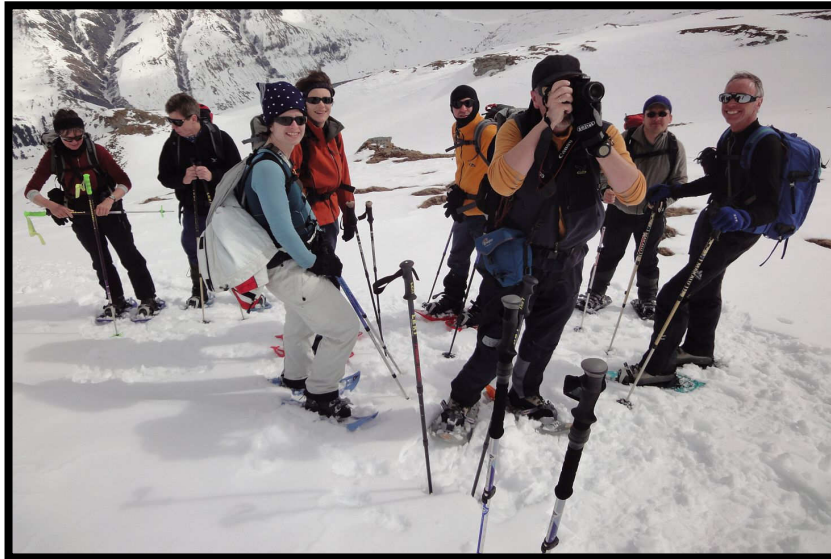
während der andere Teil beschließt, auf den Piz Guv zu pfeifen,