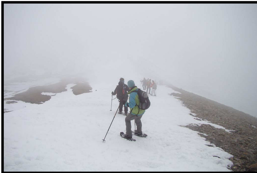
Steiler Abstieg vom Tällihorn,