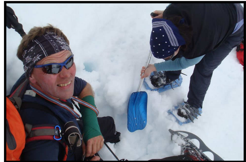
Auch im Abstieg quält das Käsefondue, Pitzi gräbt einen 'einarmigen' FÜL aus.