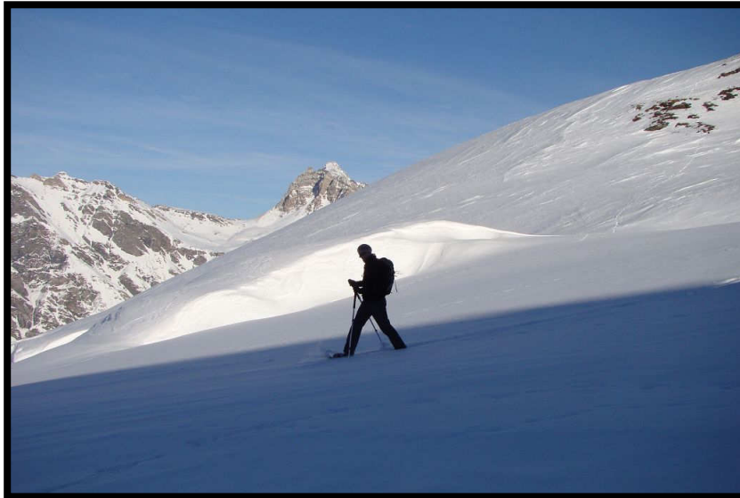
Was für ein Wettlauf, Schneeschuhgeher gegen den Schatten der untergehenden Sonne.