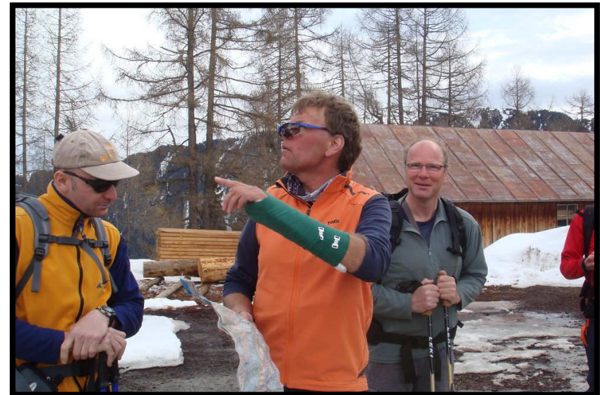
Da geht's zum Schlüchteli (2283 m).