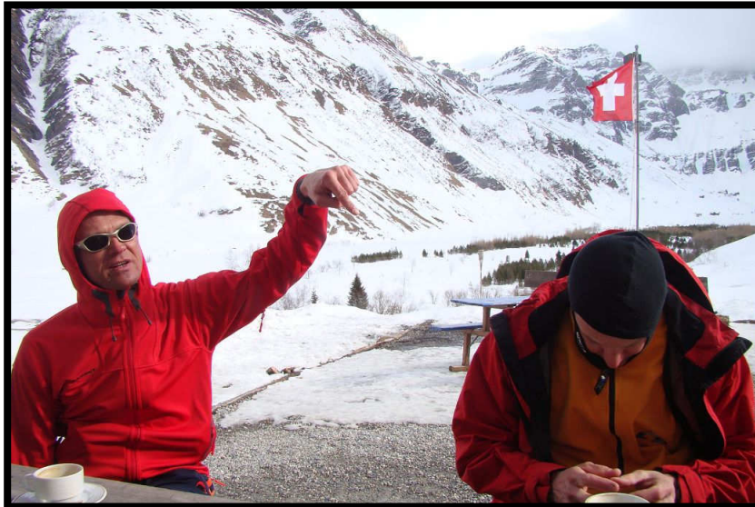
Und wo gehen wir morgen hin?