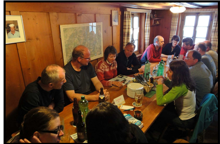
Abwarten und erstmal: