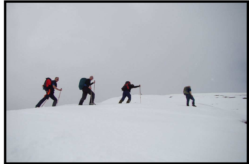
Den Gipfel hat man erst bestiegen, wenn man auch seinen Namen aussprechen kann: