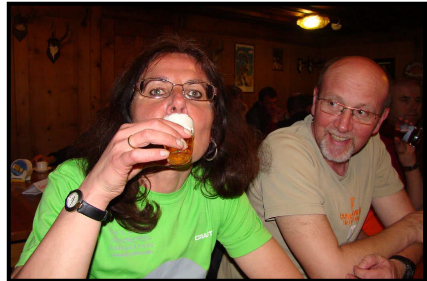
darauf gibt's einen Mungga-Furz!