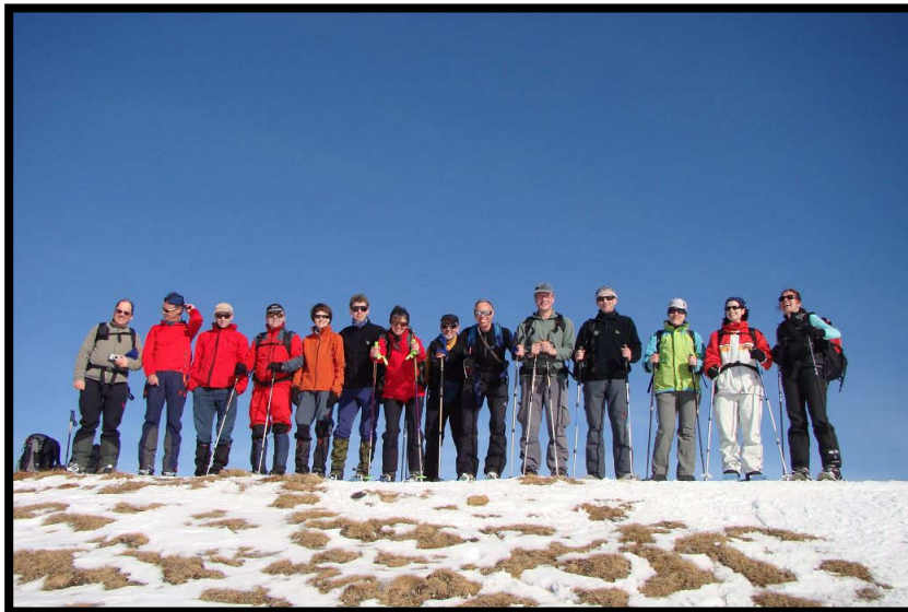
Fast wie bei den Gebirgsjägern, Gipfelstürmer in Reihe und Glied.