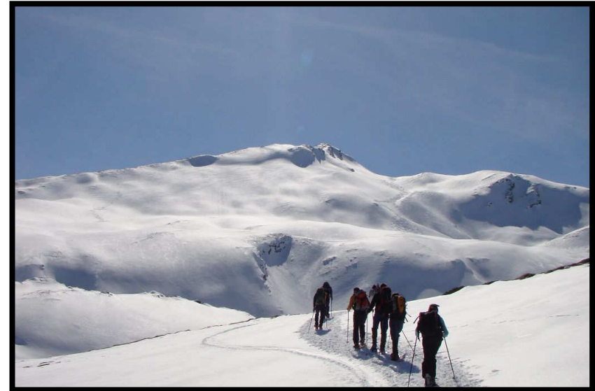
Das Tagesziel in Sichtweite, das Strätscherhorn (2557 m)