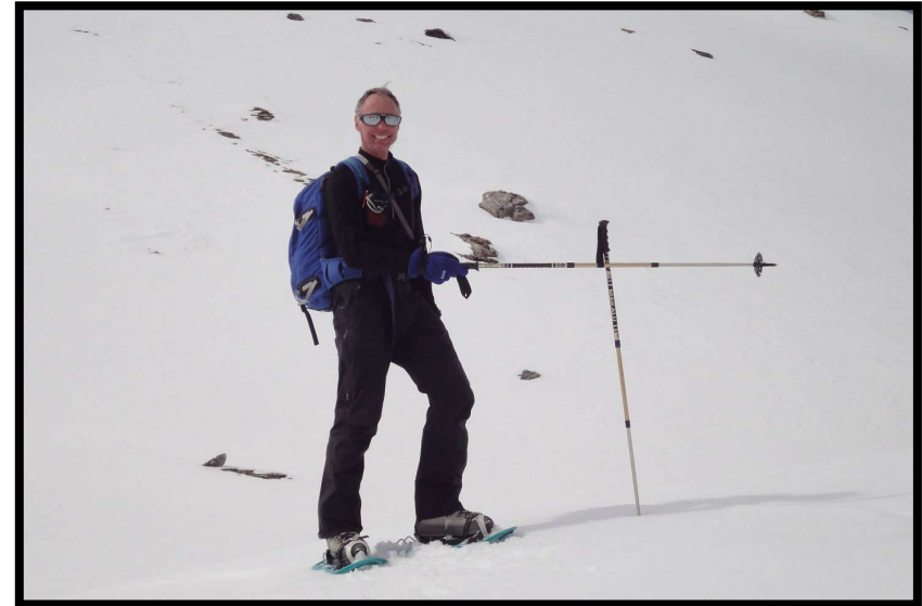
schließlich haben sie ja den Piz Ingo 2 erreicht!