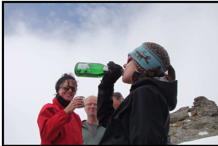
Na dann Prost!