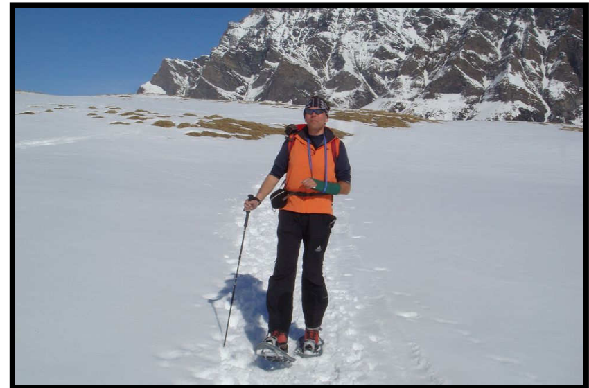
Auch 'einarmige' FÜLs trifft man hier.