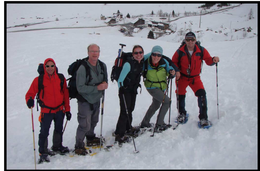
Ein Teil der Gruppe sieht schon das Turrabus,