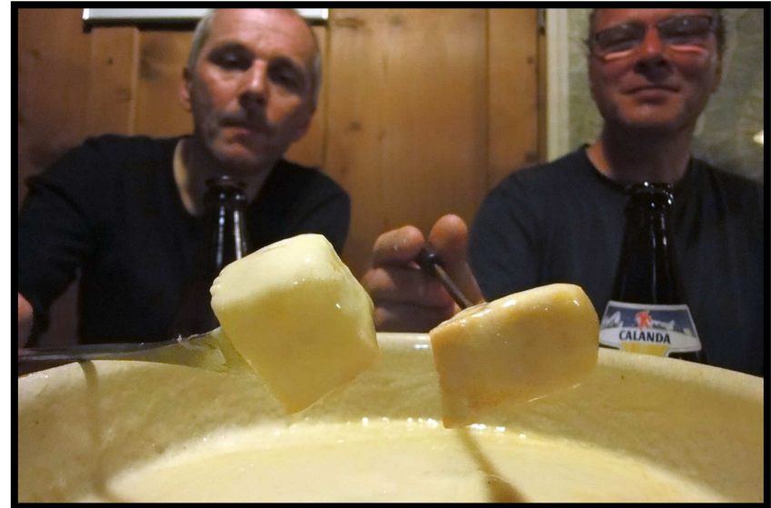
Zwei Männer und ihre Brötli!