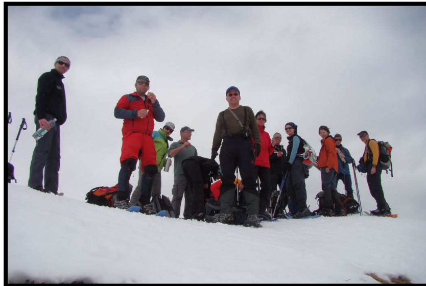
Wie heißt er??? Schlü'ccccch'teli !!!