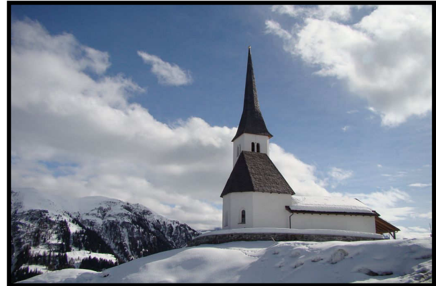
Zum Abschied: Idylle pur in Tenna.