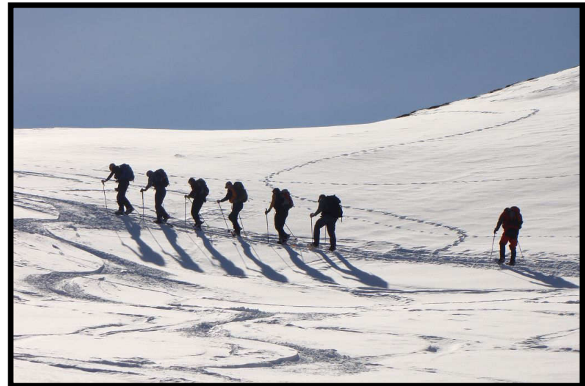
Bizarre Schattengestalten unterwegs ...