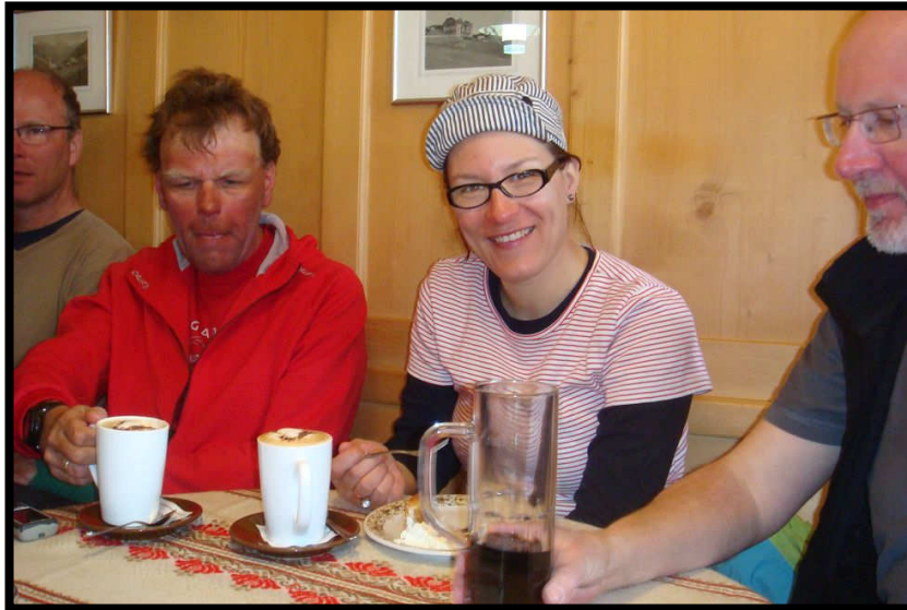
Zu wenige Kuchen, aber Milchkafee mit Kakaohertz = Cappuccino.