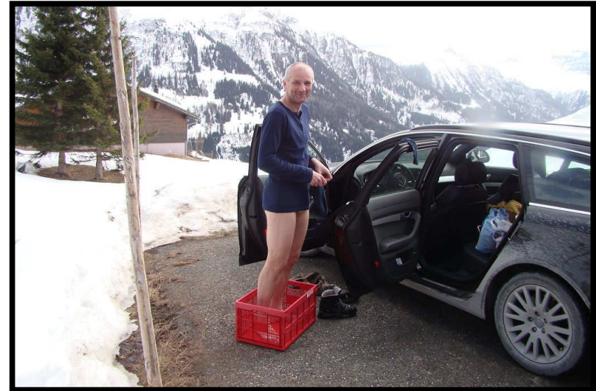
Bloß keine nassen Füße bekommen, Ingenieure haben immer eine Lösung ;)