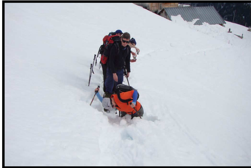
Wenn bloß das Käsefondue nicht so lecker gewesen wäre ;)