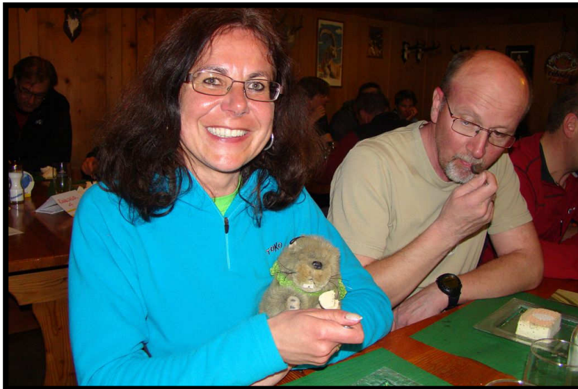
Auch der Mungga mit seinem Schal ist noch da,