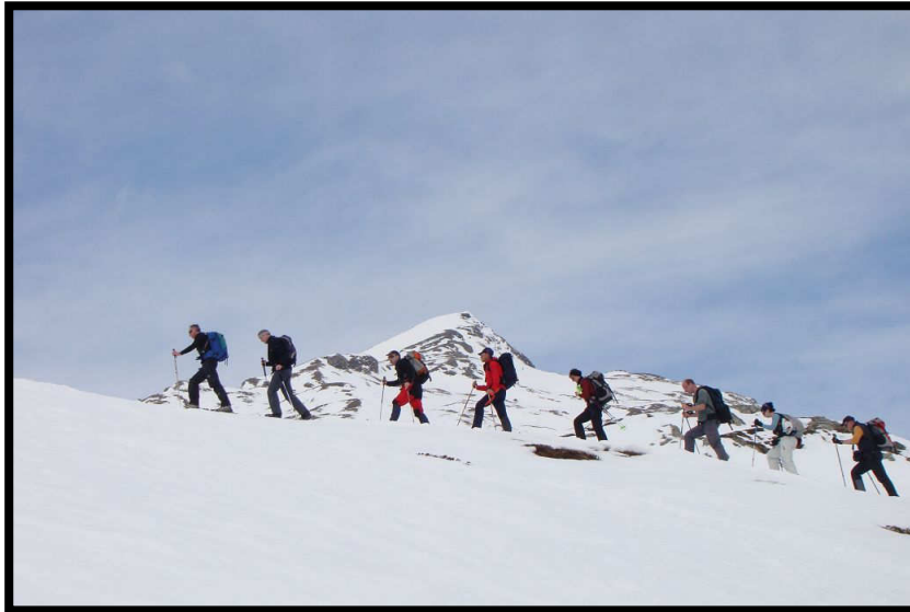
Im Gleichschritt - Marsch zum Tällihorn (2856 m, hinten)