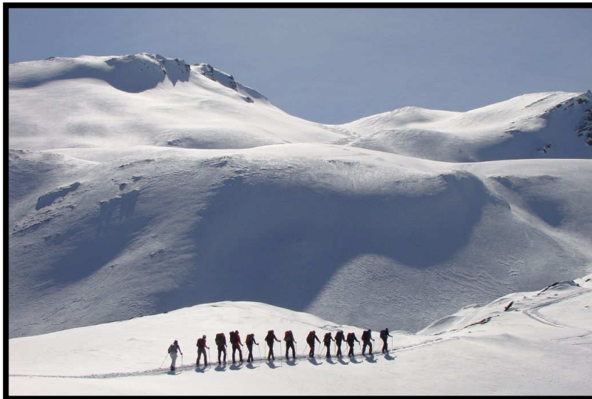
'Ameisenkolonie' in grandioser Winterlandschaft.