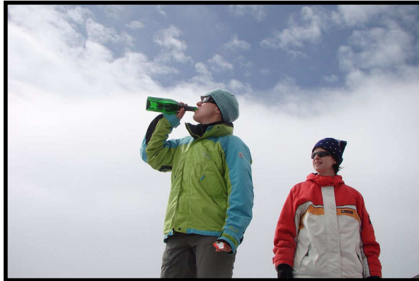
Der Mühen Lohn: