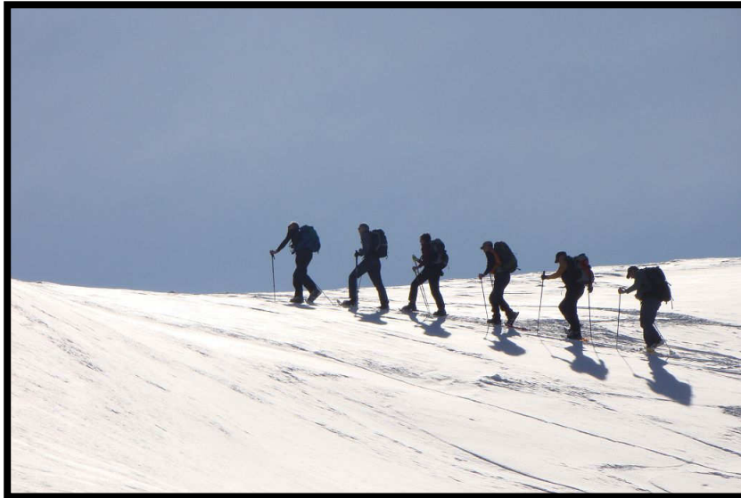
... im hintersten Safiental.