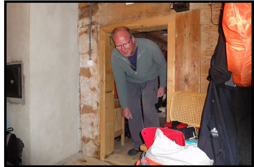
Das Turrahus, gebaut für kleine Schweizer, nicht für Jaks ;)