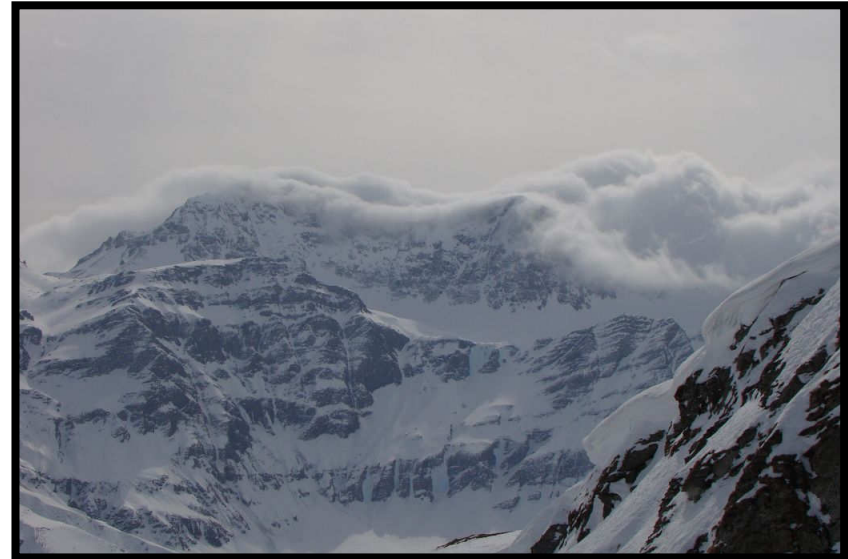
Wolkenwelle in Lauerstellung.