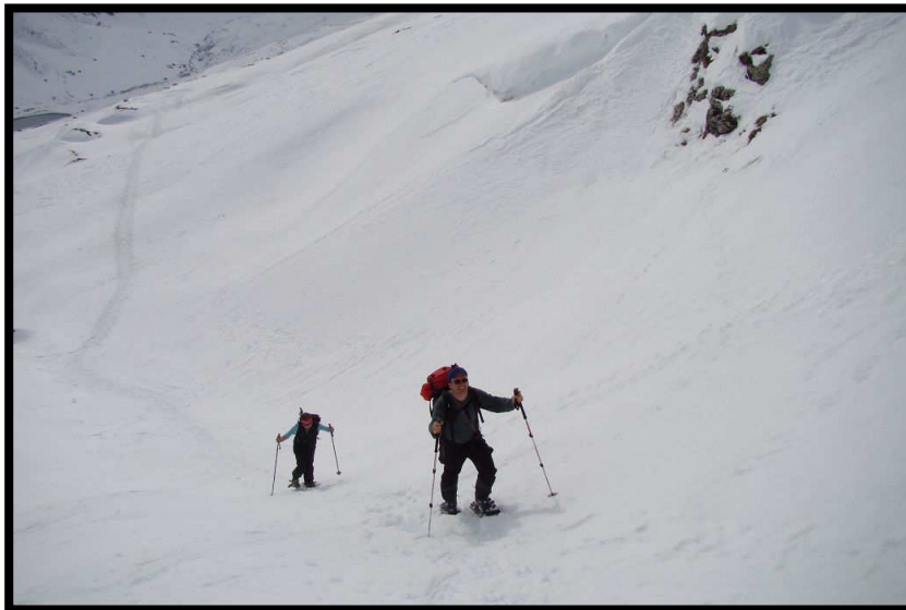
Dann doch lieber Abstand halten.