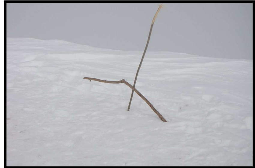
sehen so Schweizer Gipfelkreuze aus :( wenn's Geld der deutschen Steuersünder ausbleibt?