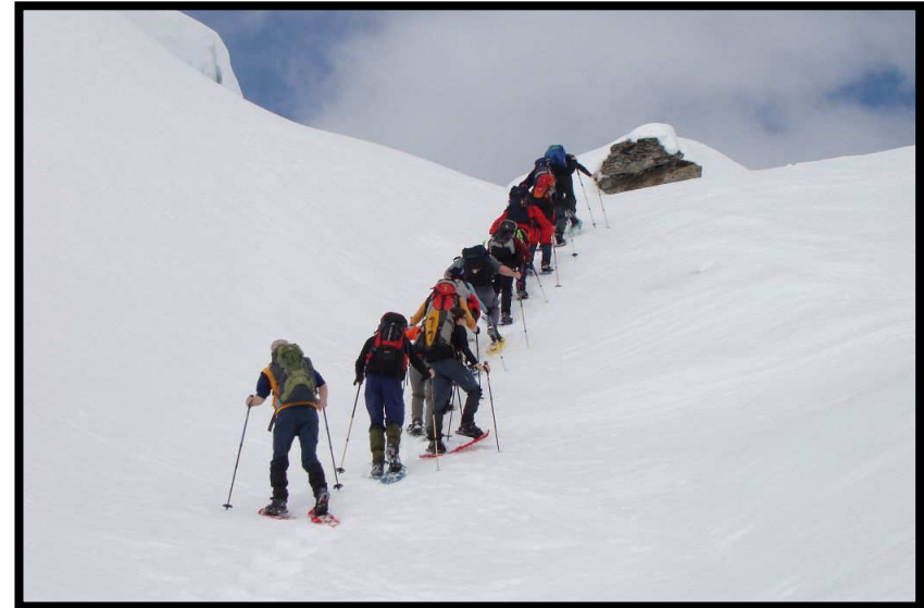
Wenn bloß der Vorderste nicht umkippt ;)