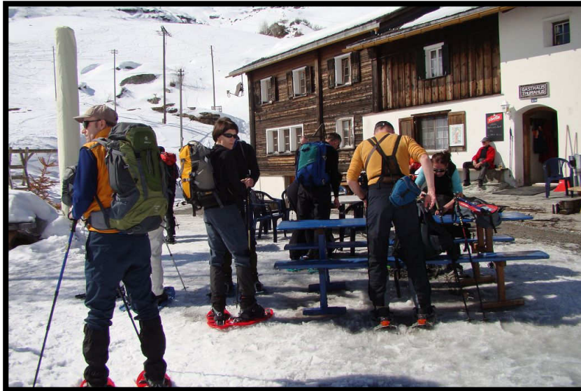
Aufbruch am Turrahus (1694 m).