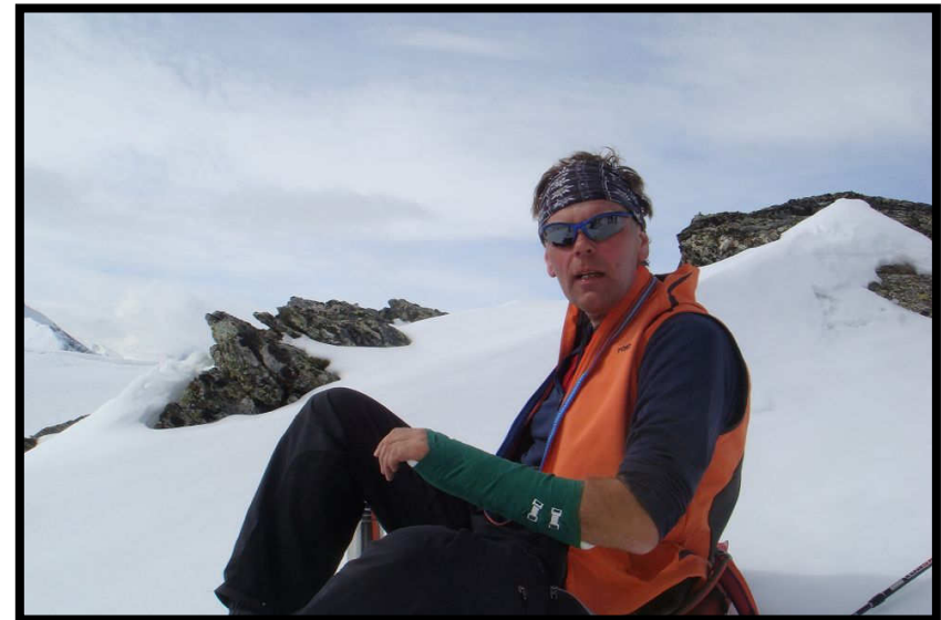
auch von 'einarmigen Banditen' zu bewältigen.