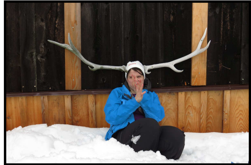
Und welcher Gipfel bietet schon solche Möglichkeiten, wie die Wurst- äh Burstalpe ;)