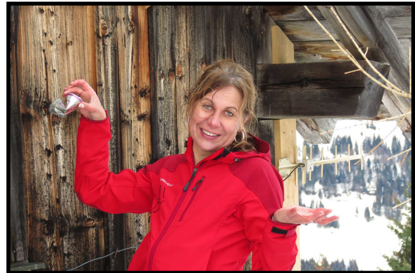
Und wie's halt so geht ... ruckzuck war der Neujahr-Prosecco draußen und Luft drinnen ;) Hai