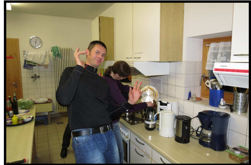
Da zu viele Köche bekanntlich den Brei, bzw. das Gulasch, verderben ...