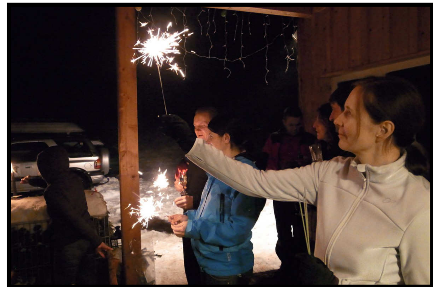
Wunderkerzen wirken Wunder ...