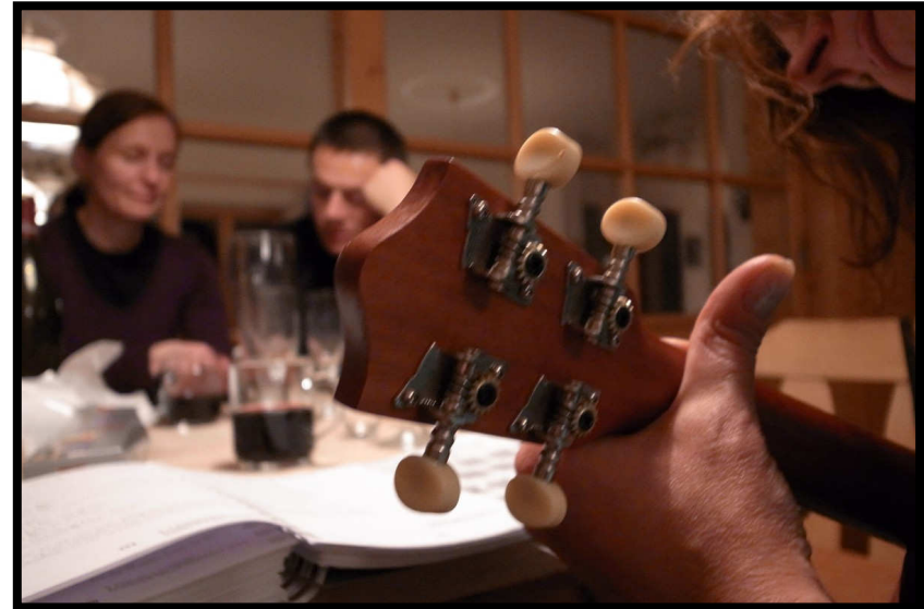
Die Combo der gnadenlosen Sänger und Ukulele-spieler startet die legendäre Silvestergala ...