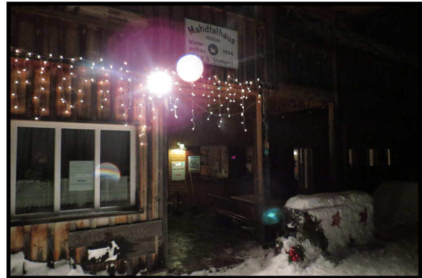
Das Mahdtalhaus wartet auf's Neue Jahr, noch ist's ruhig, drinnen und draußen ;)