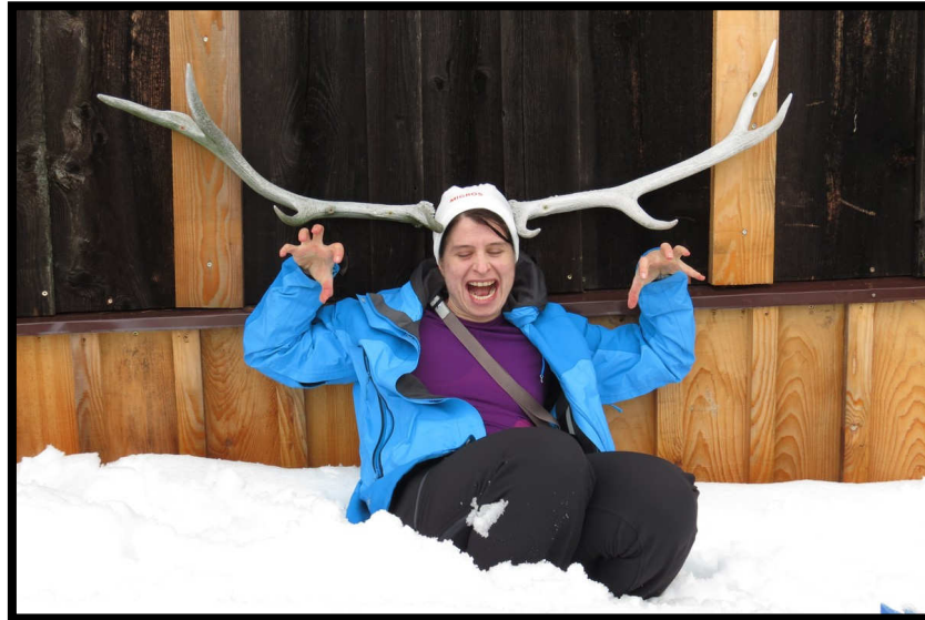
Nix mehr zu Trinken? Dann bleibt immerhin noch Zeit für Faxen ;)