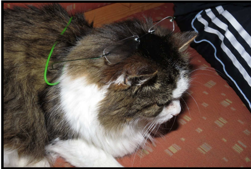
... denn auch mit Brille kann man keiner Katze trauen ;)