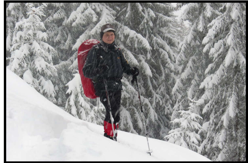
aber bloß nicht zu lange stehen bleiben und zu sehr genießen, akute Einschneigefahr :)