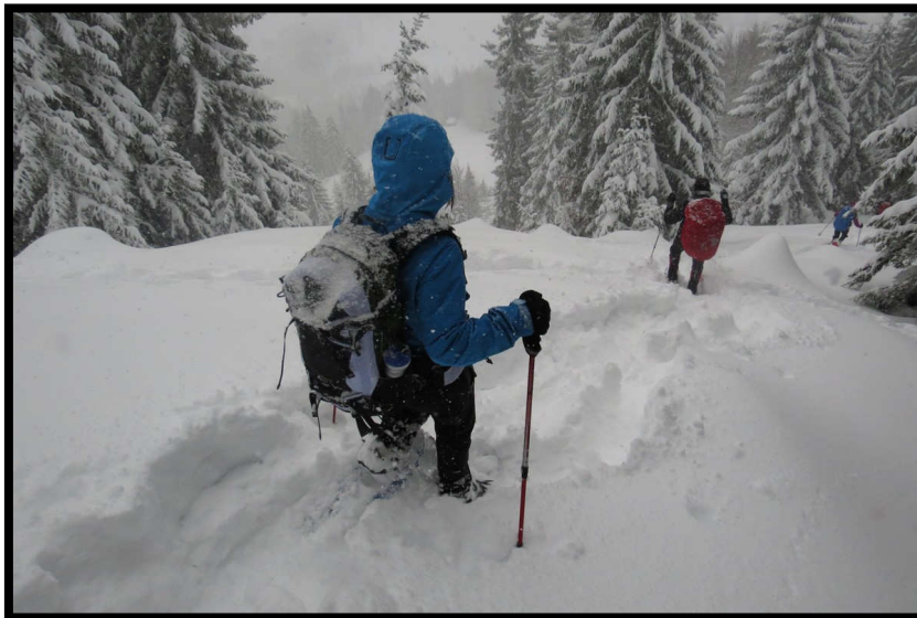
Tiefster Pulver im Abstieg, bei LWS 3-4 lieber mit Entlastungsabständen.