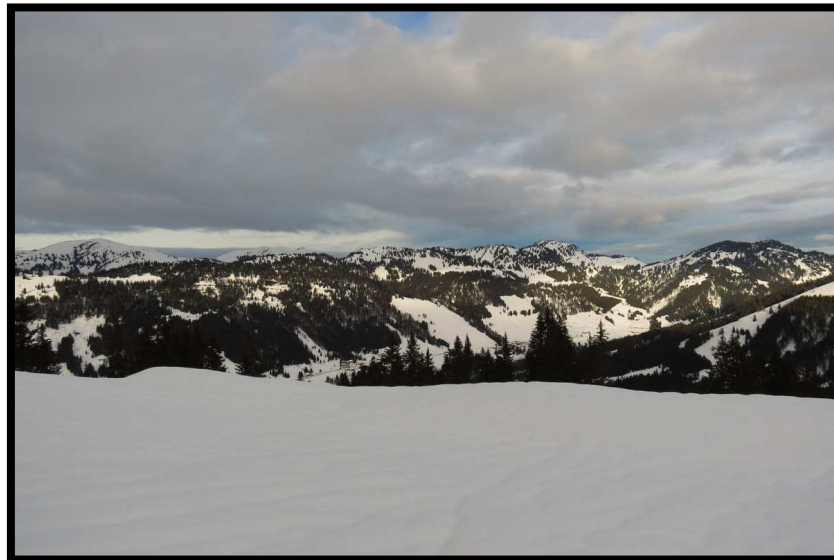
Neujahrsausblick über die Nagelfluh- und Hörnerkette, ganz hinten der Bodenseenebel ☹