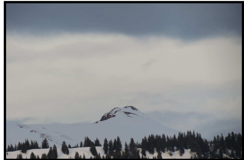
Knapp unter denn Wolken, dass Rindalhorn (1821 m)