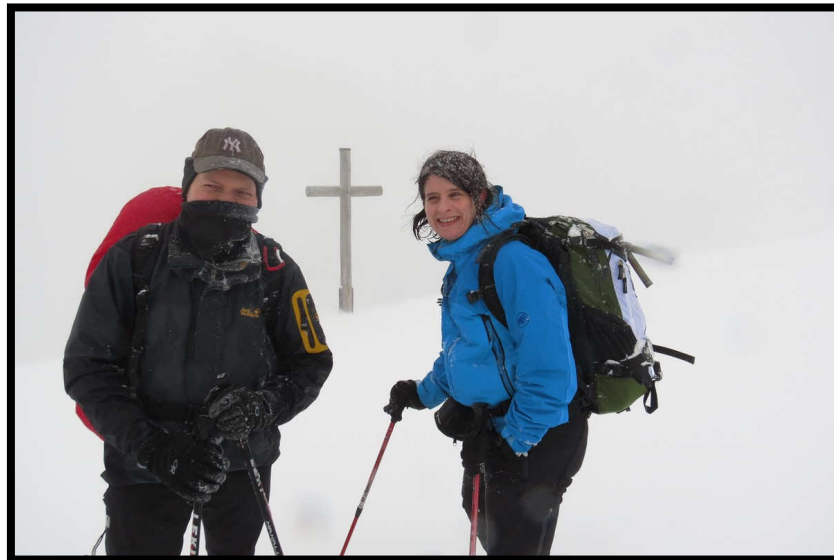
Endlich, Silvestergipfel erreicht und ...