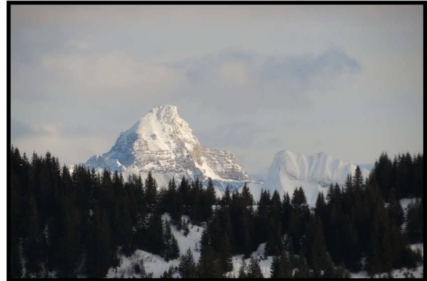
Ungewöhnliche Perspektive, aber er ist es doch: der Hochvogel (rechts davon der Schneck).