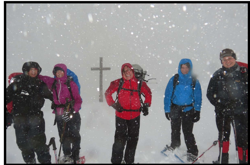
... alle sind glücklich im Schneegestöber ☺