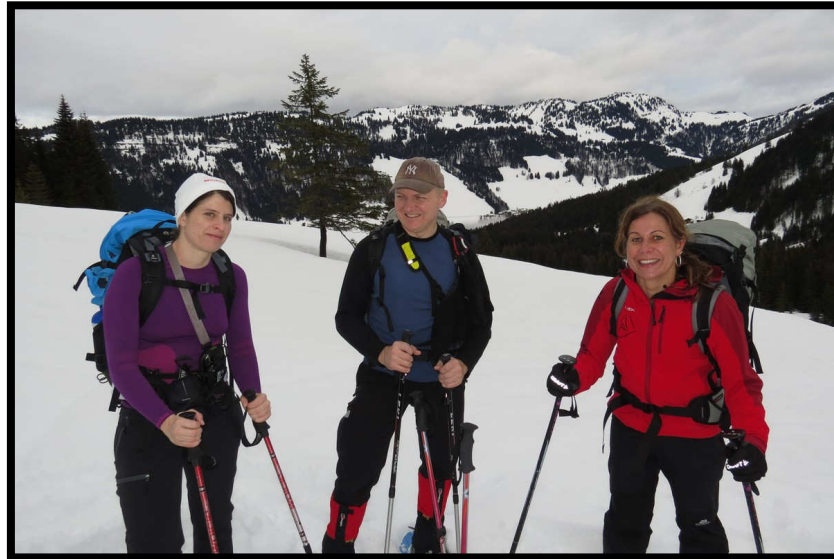
Bei der unteren Burstsalpe, mit herrlichem Ausblick über die Balderschwanger Bergwelt.