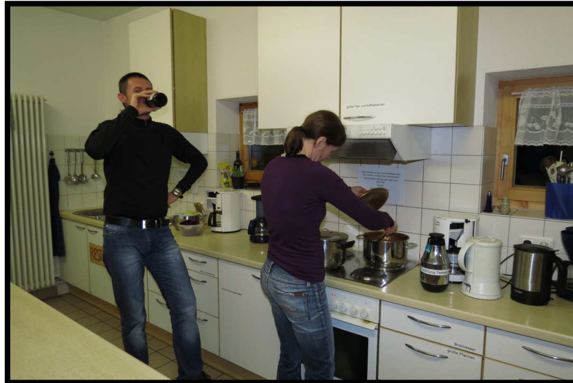
Drinnen lässt der Hüttenchef kochen ;)