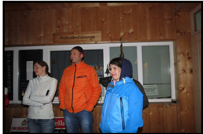
Nur noch wenige Sekunden bis 2012!