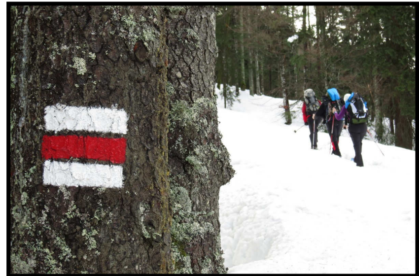
Immerhin, die Richtung stimmt noch im teils dichten Wald.