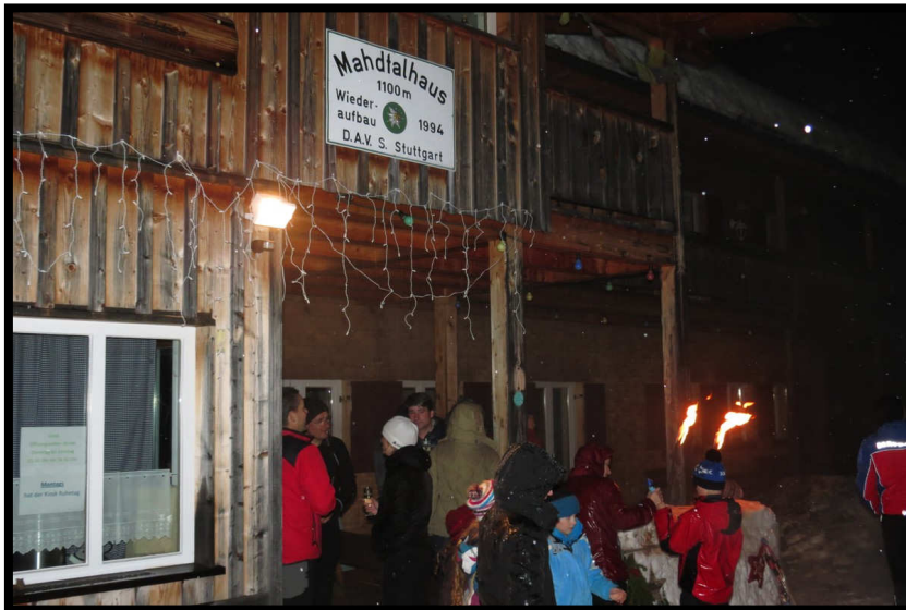
... bis es kurz vor Mitternacht laut und voll wird vorm Mahdtalhaus!!!