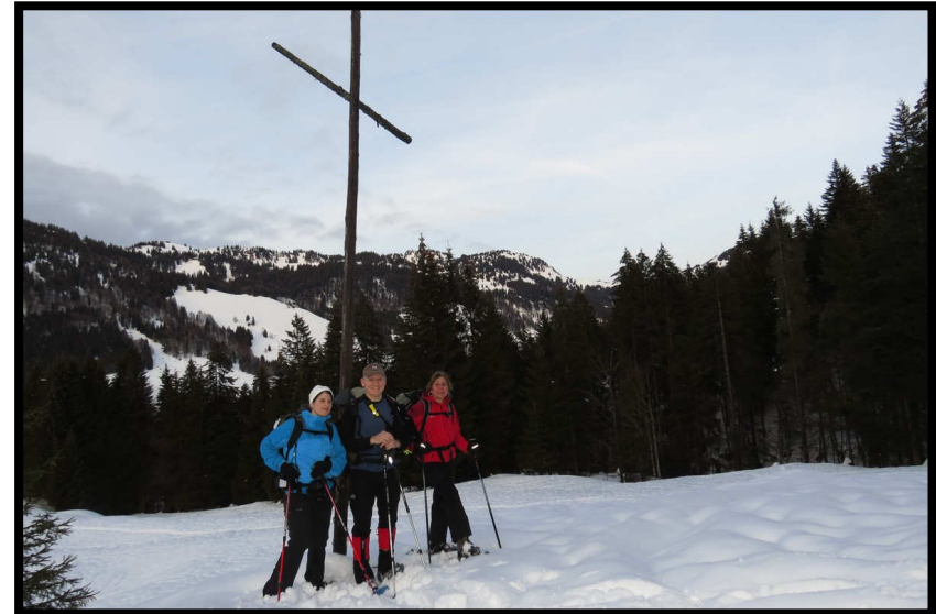
Kein Gipfel, aber immerhin noch ein Kreuz, oberhalb der Lappachalpe.