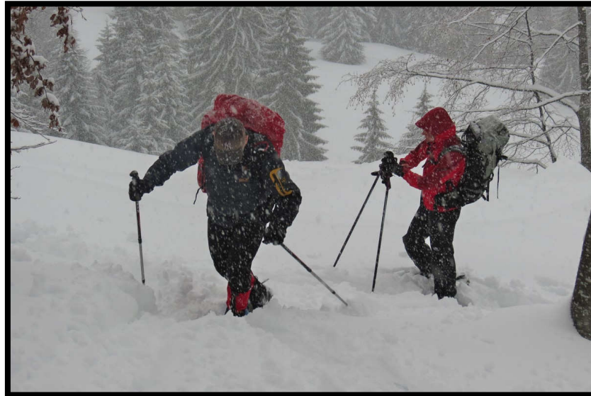
Extrem winterliche Silvestertour auf den Ornach/ Jochschrofen (1625 m), über dem Oberjoch.