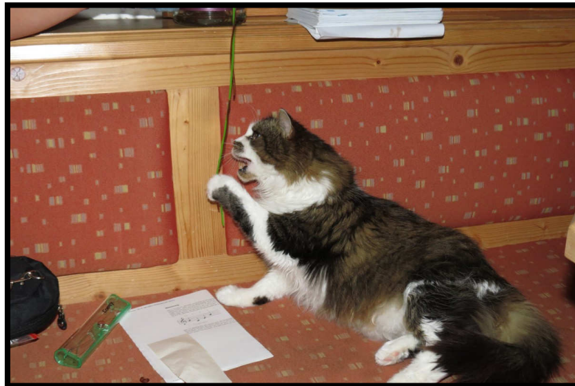
Da hört der Spaß selbst für die müde Hüttenkatze auf ;)