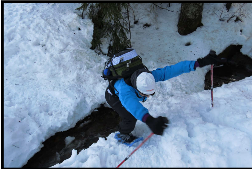
Tauwetter erfordert große Schritte ... zwar nicht für die Menschheit, aber für Pitzi ;)