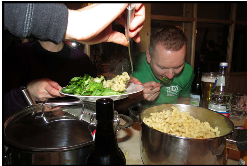
Endlich ist alles aufgetischt, ein letztes Mal in 2011 heißt es: MAHLZEIT ;)