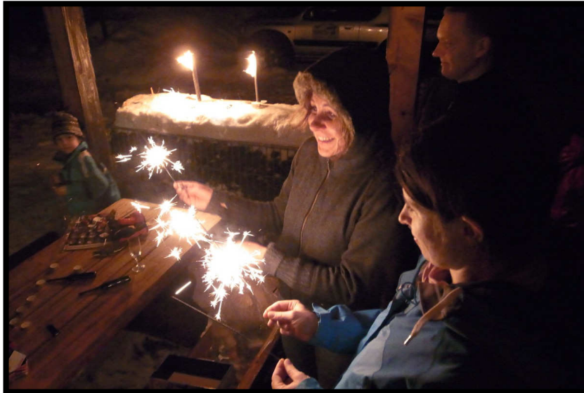
... und zaubern etwas Stille in die Böllernacht.