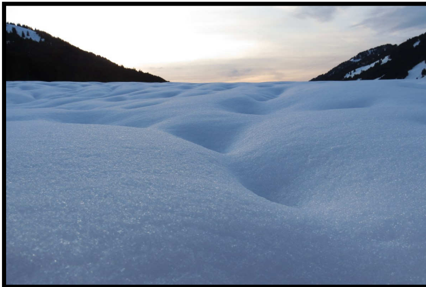
Und was gibt's am Ende der Tour am Ende des Tals noch zu sehen???