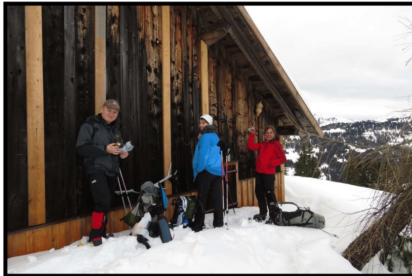
Unser 'Neujahrsgipfel', die Obere Burstalpe (1423 m), nachdem uns der Gipfelhang zu steil erschien für LWS 4.