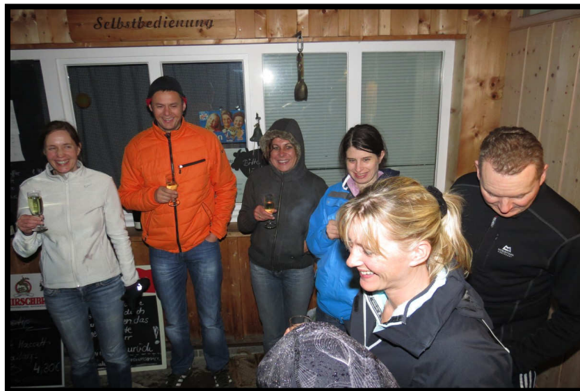
Gehört unbedingt dazu: Sekt und das Neujahrsginsen.