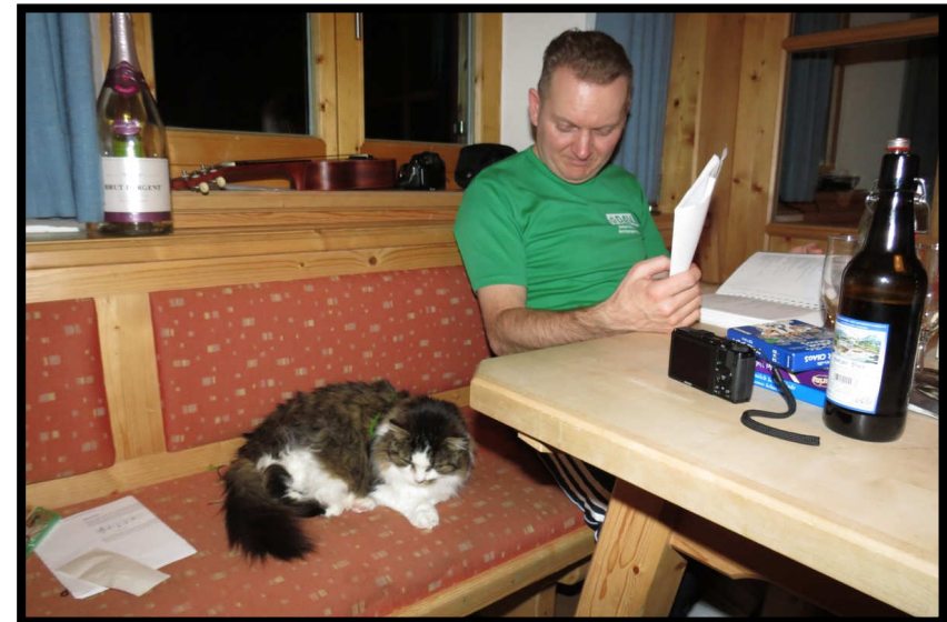
Micha lässt trotzdem lieber Vorsicht walten, ...