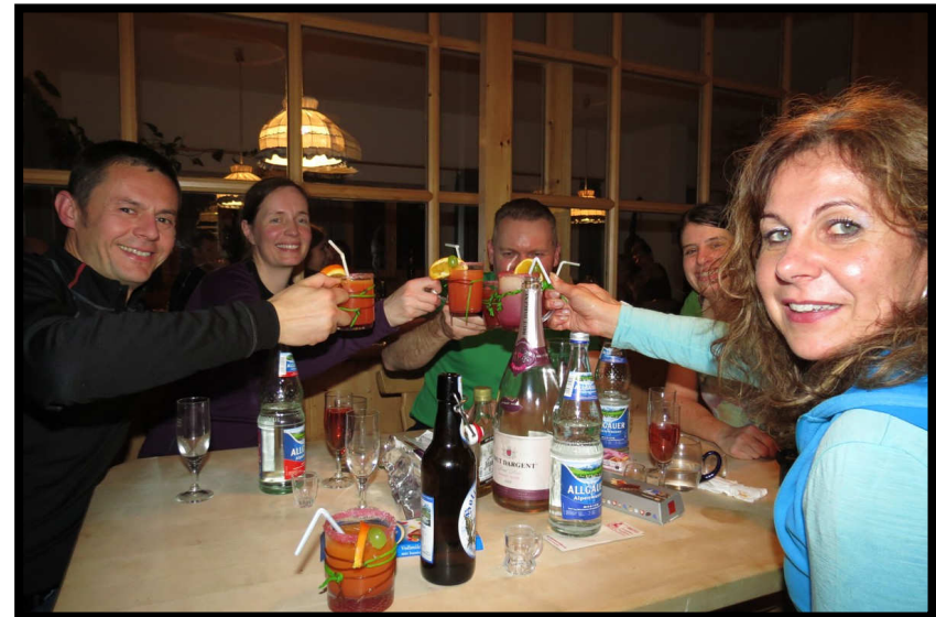
Silvestercocktails der Kids im Haus zu Dumpingpreisen ... leider schmeckten sie auch so. Hai Präsentation