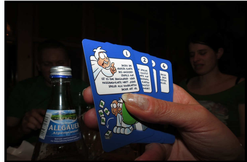
... 'Nicht lustig' gespielt!