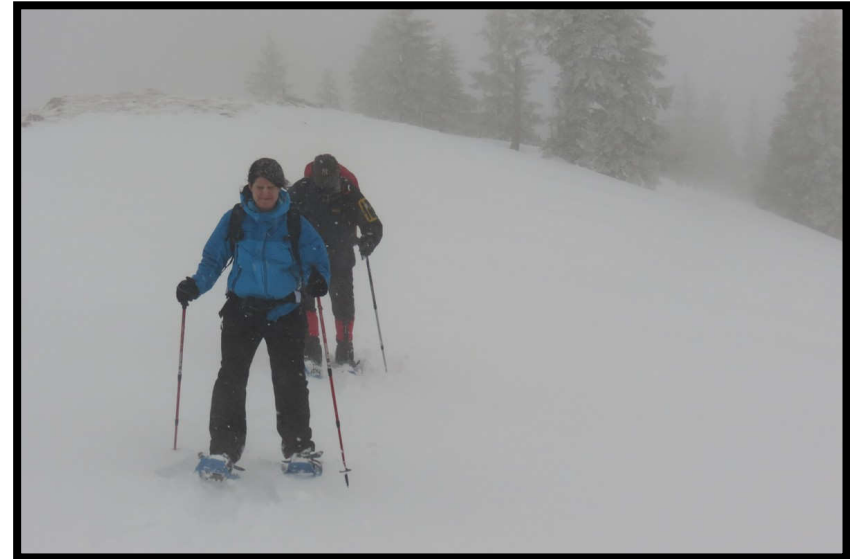
Wellnesskur kurz vorm Gipfel: Pitzi kämpft mit Extremgesichtspeeling ;)