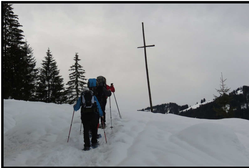
Bei LWS 4 ist ein Gipfelerfolg allerdings eher fraglich - Wurst hin, Burst her.