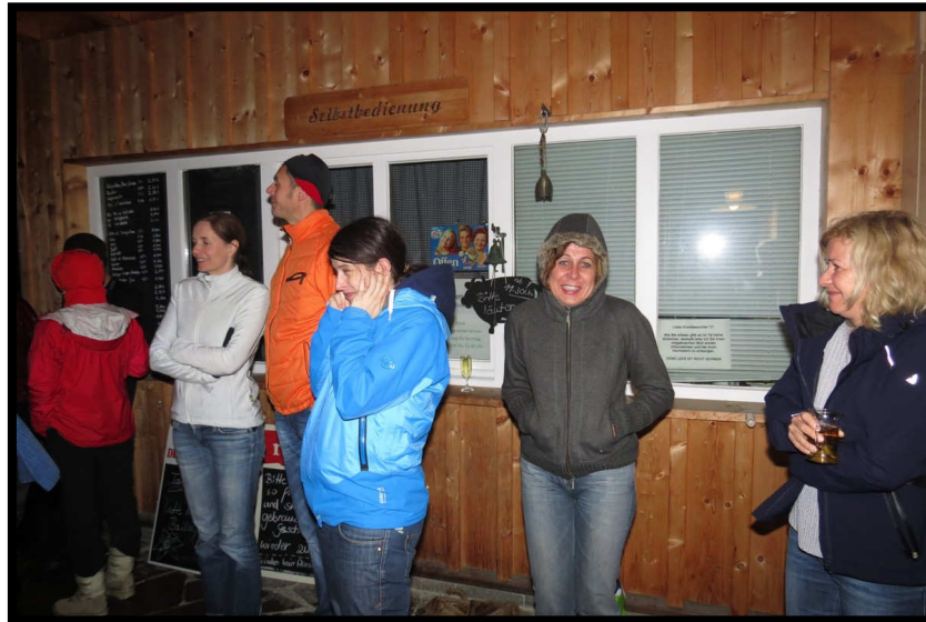
Endlich, die Sektkorken können knallen, leider auch jede Menge Böller ☹