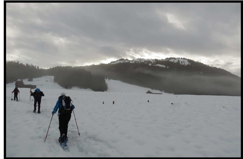
Neujahrstour Richtung Burstkopf (1559 m), manche meinen immer noch er heißt Wurstkopf ;)