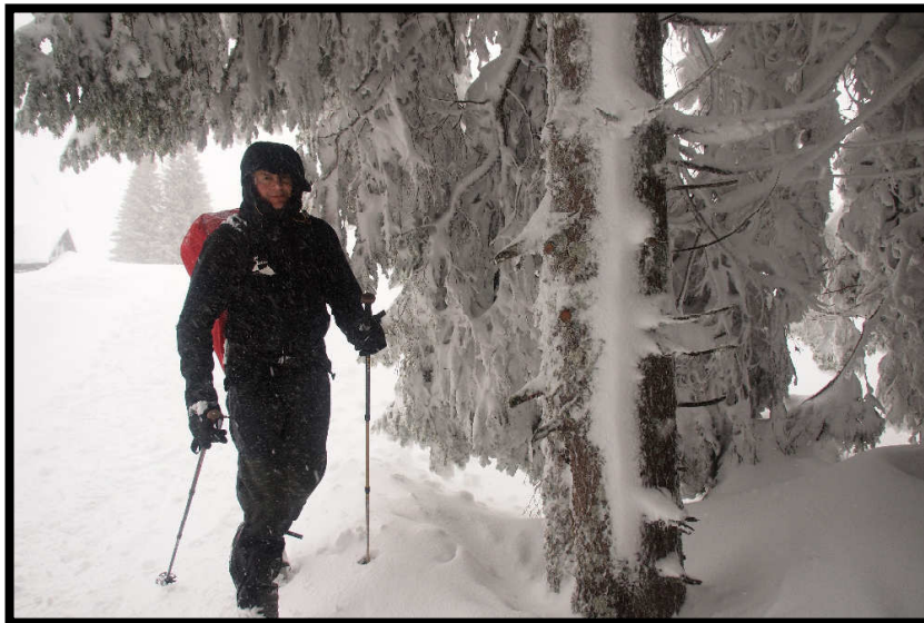
Bizarre Winterlandschaft begleitete uns ...