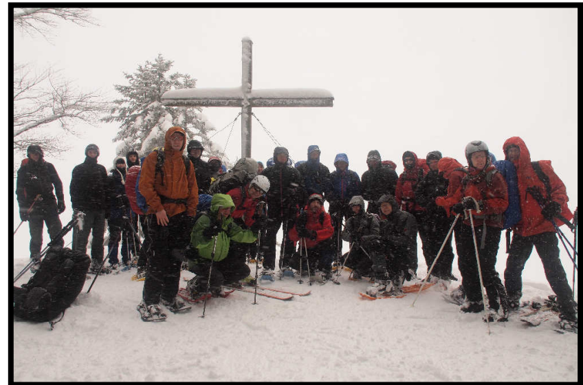
... auf dem Weg zum Gschwender Horn (1450 m). Gipfelversammlung nach dem Ukulele-Konzert.