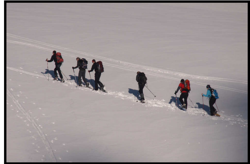
Im Fokus: tatsächlich alles Schneeschuher!