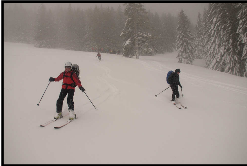
Endlich, die Abfahrt vom Gschwender Horn startet mit unseren Skifreunden,