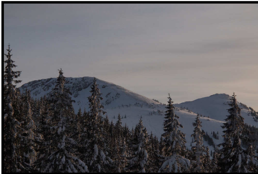
und noch die Gipfelziele (Stuiben und Sederer) des nächsten Tages begutachtet.