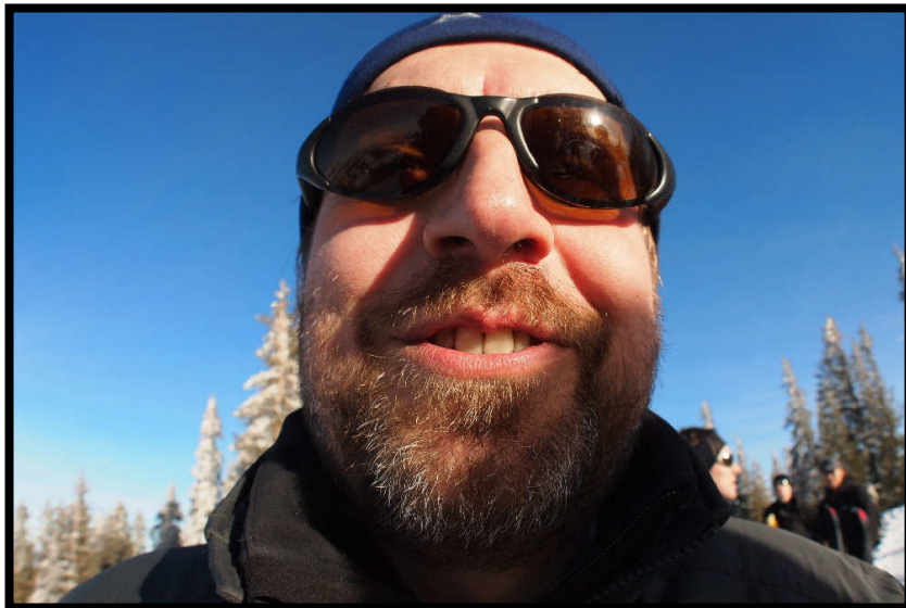
Gipfelstrahlen à la Dirk,