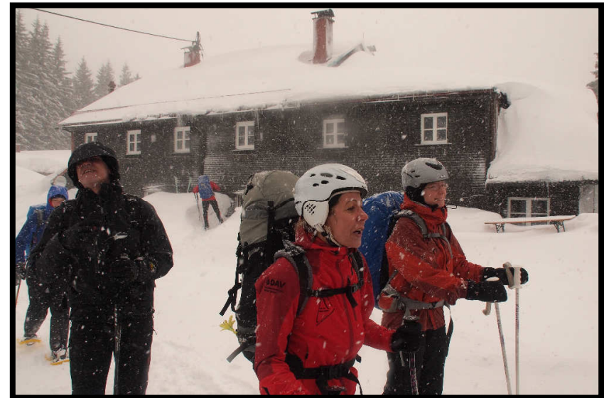
Wenn's bloß nicht so gestürmt und g'schneit hätte am nächsten Morgen, dann wär'm da schon hoch gekommen.