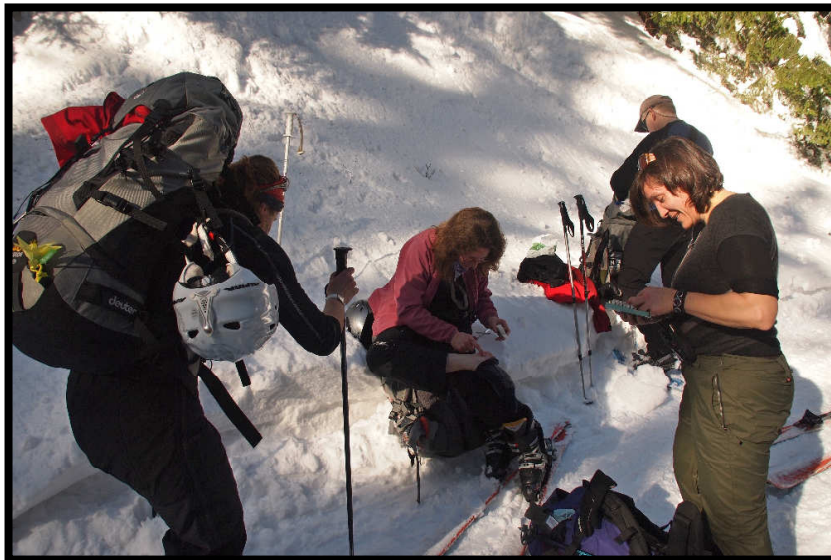
bis zum ersten Fußdefekt: Blasen ☹