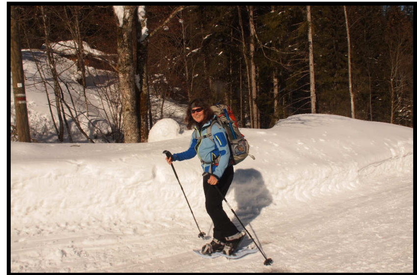
... kommen dann sofort Tourenski und Schneeschuhe unter die Füße.