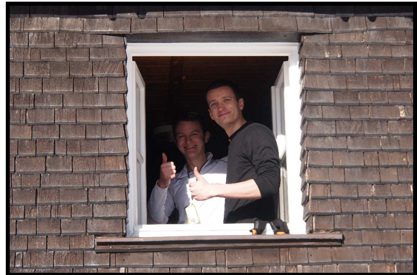
Noch nicht ganz, ein paar Schritte sind's schon noch.