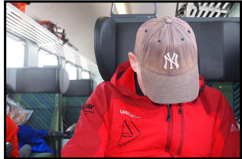
... andere 'ne Mütze Schlaf ;)