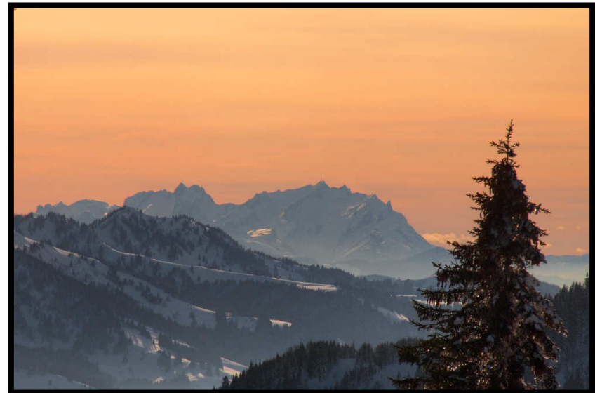
Genauso wie der Blick auf einen alten Schweizer Freund, den Säntis (mit seinem Alter-Ego Hai Altmann)!