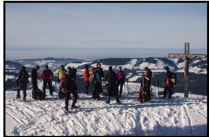
... bis endlich alle mit freier Sicht auf dem Gipfel stehen.