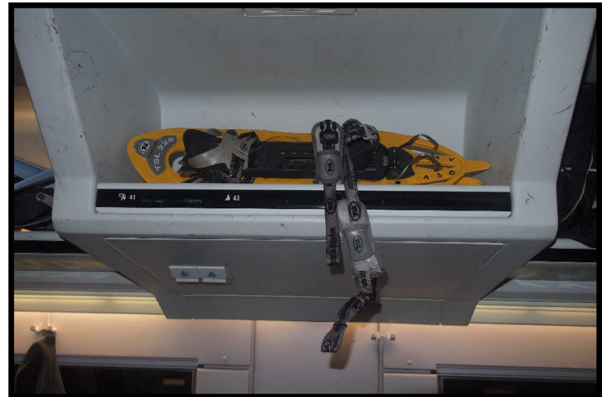
Auf der Rückfahrt gibt die Deutsche Bahn dann alles: ICE mit Schneeschuhepackfach!