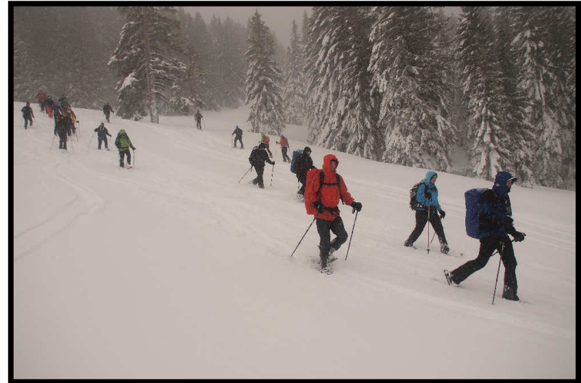
... und dann wurde die Schneeschuhmeute losgelassen ;)