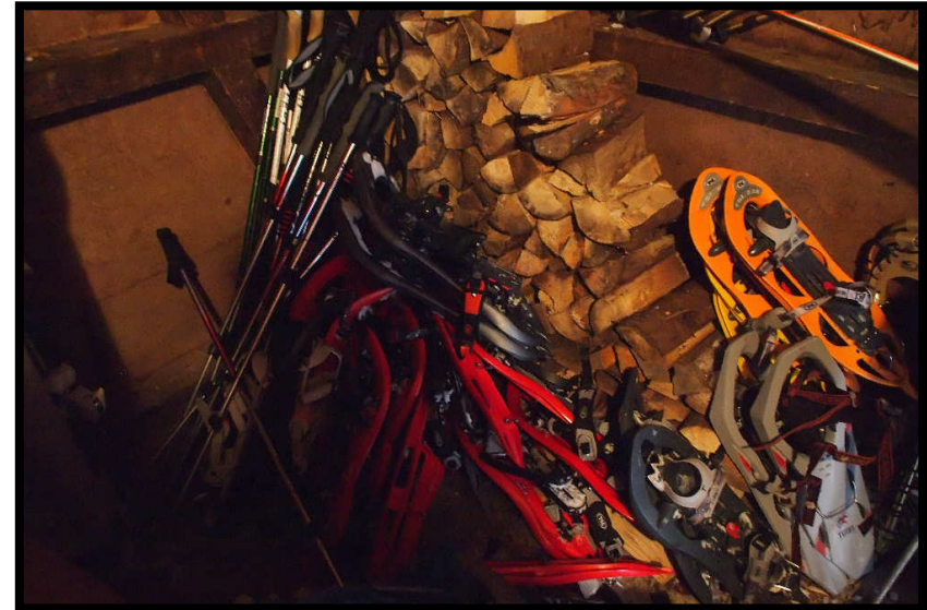
Schnell die Schneeschuhe eingeparkt,