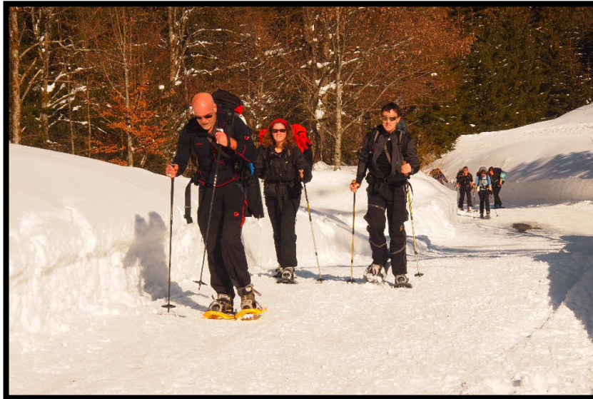
Erst auf der Rodelpiste aufwärts,