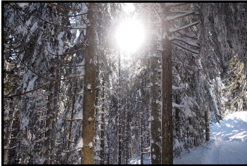
Dann kann's wieder weiter gehen im Winterwunderwald,