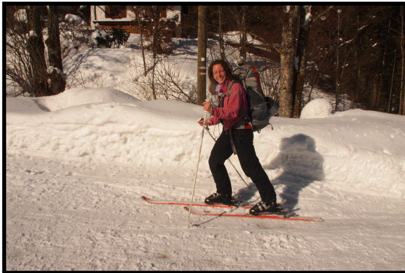
Vor lauter Aufregung hätten wir fast schon im Zug angeschnallt, aber kaum in Immenstadt ...