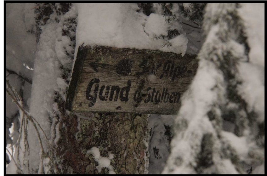
Immerhin bis zur Gund-Alpe kamen wir und erreichten dort mit 1502 m den höchsten Punkt.