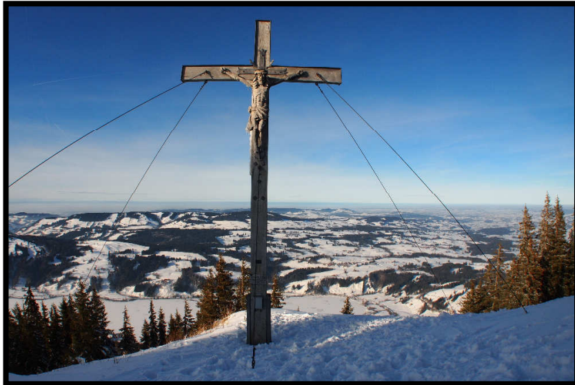
Blick ins Württembergische Allgäu.