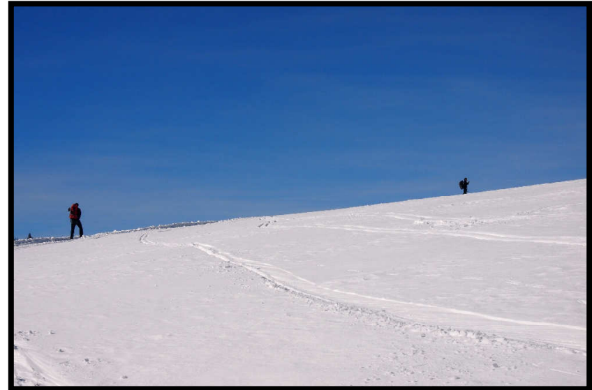
kurz vorm Naturfreundehaus werden die Bäume dann auch mal weniger ;)