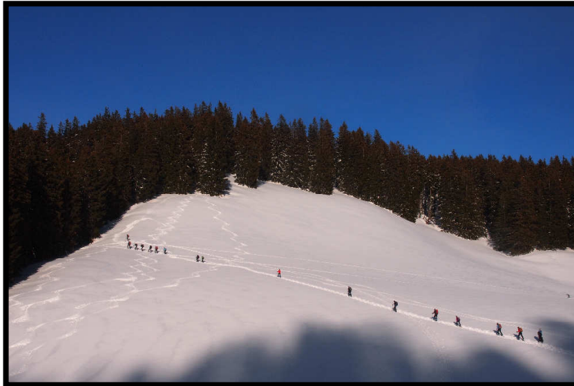
Schneeschuhtkolonne auf dem Weg zum Immenstädter Horn (1489 m).