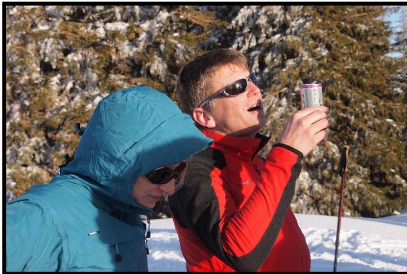
immer wieder ein Hochgenuss!