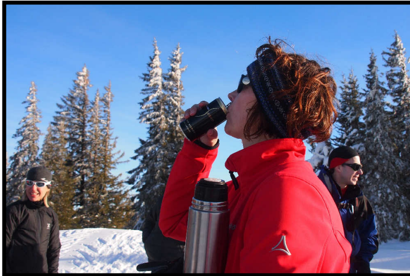
Im Winter Standard: