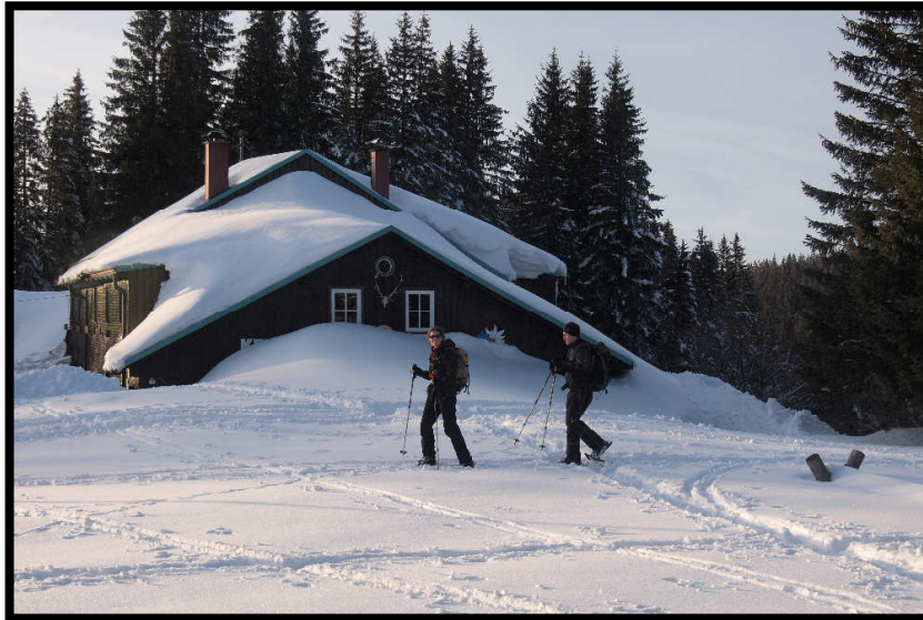
Die letzten Schneeschuhschritte des Tages vor dem Kemptener Naturfreundehaus.