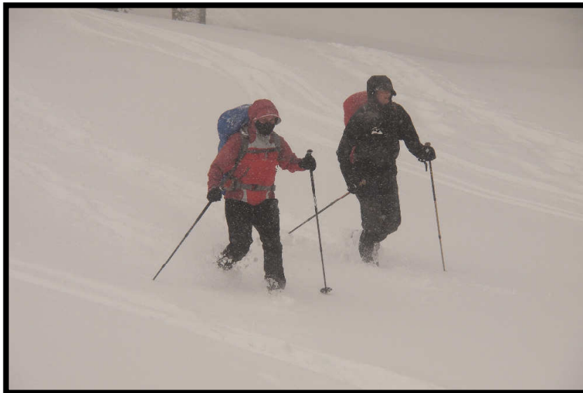
Das Motto war klar: wer fängt den ersten Skifahrer???