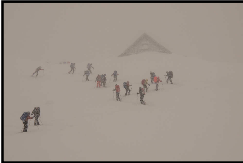
Aber so: Schneegestöber bei der Mittelberg-Alpe.