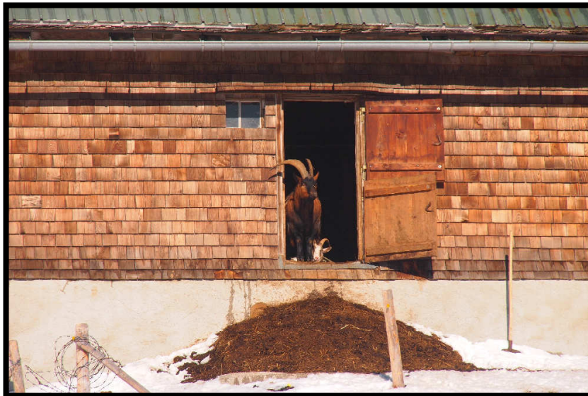
Das Naturfreundehaus mit Gästen?