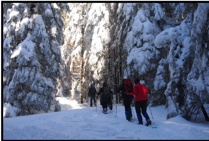
Schon wieder Winterwunderwald,