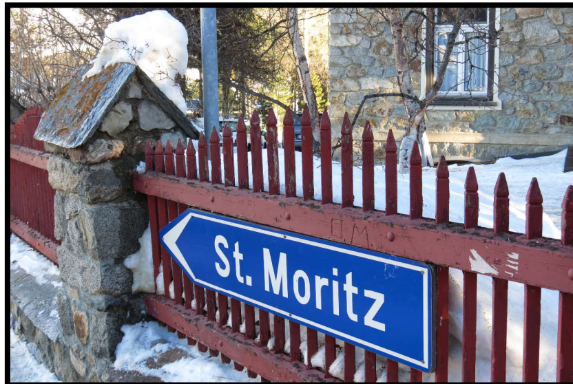
erst nach St. Moritz und dann ...