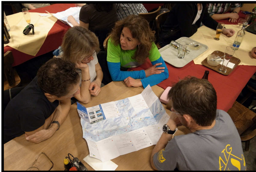
Und schon wieder wird geplant.