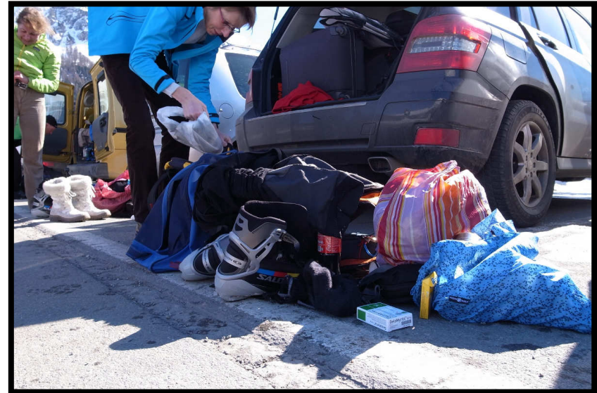
... vor dem Chaos um die Autos herum ;)