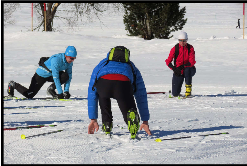
Andere können ohne Extremdehnung gar nicht starten ;)