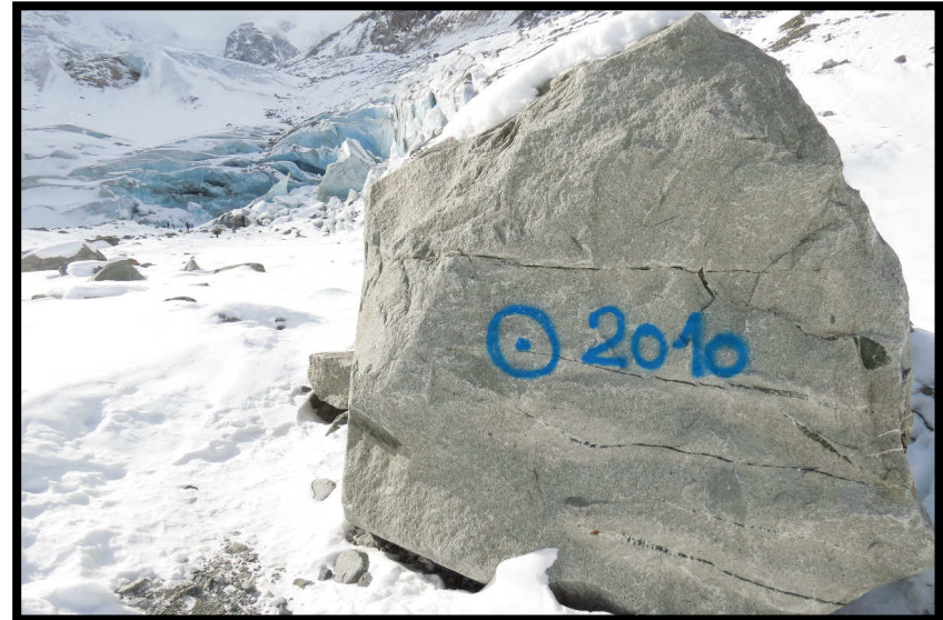
in nur 14 Monaten schon wieder locker 200 m Gletscherschwund ☹