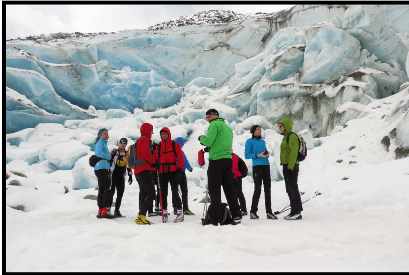
Remstaler Langlaufversammlung am Gletscherbruch.