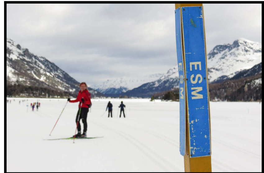
...auf die Strecke des legendären Engadin Skimararthons!