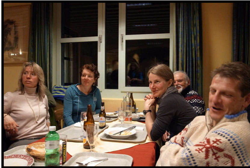
Ruhe vor dem Sturm im Quartier,