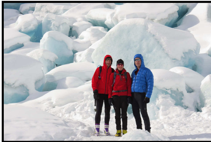
Die drei vom Gletscher ;)