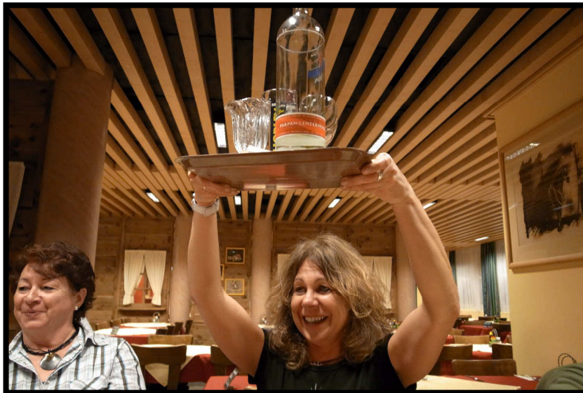
Das Handy zeigt Wirkung! Definitiv so stark geworden wie Obelix!!!