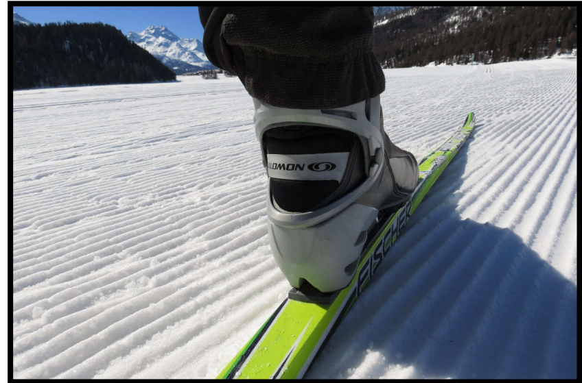
Die legendären Silberspuren im Engadin ☺