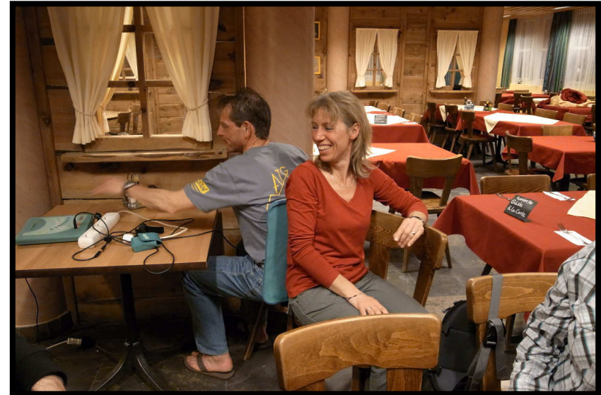
Erlaubt sogar Doppelbehandlung!