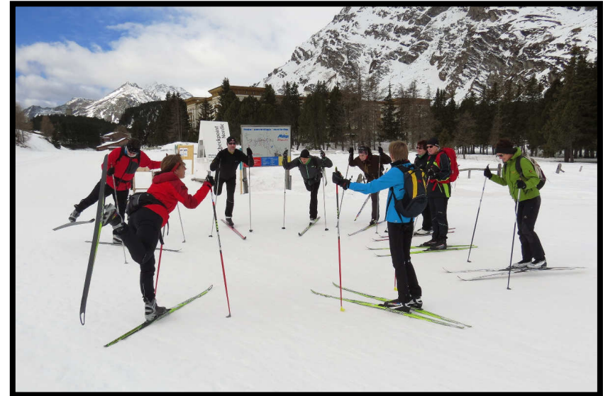
Fast alle anderen sind Frischlinge und müssen erstmal Gymnastik machen ;)