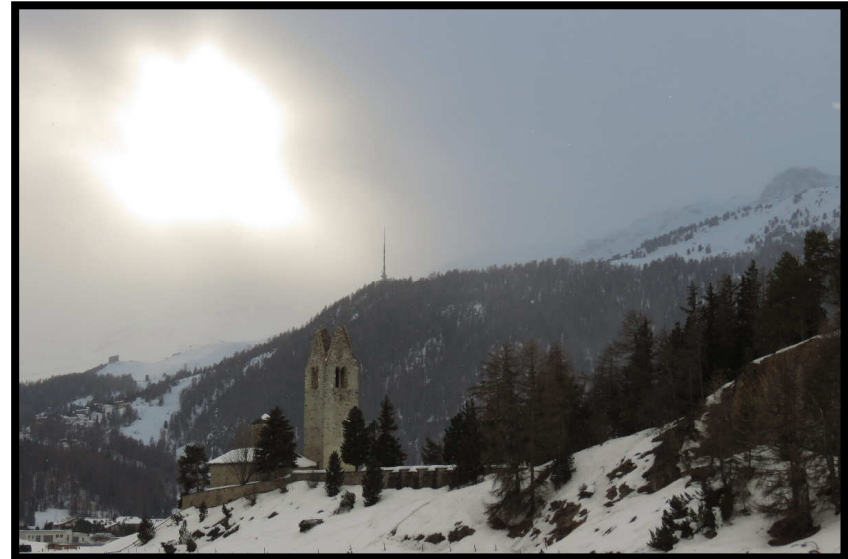
Abendliche Rückkehr nach Celerina.