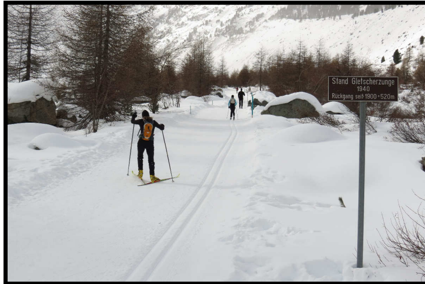
Die Loipe zum Gletscher,