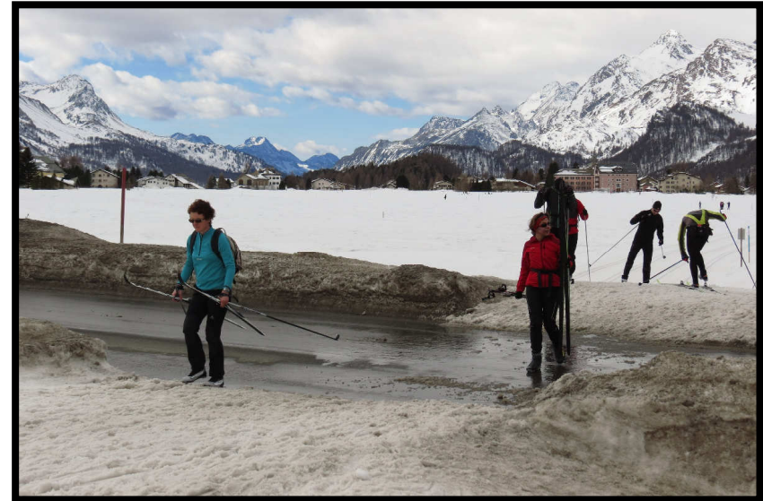
Auf jeden Fall erstmal über die Straße.