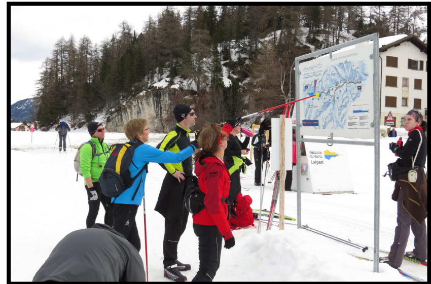
Und wo geht's lang??? Da hin???