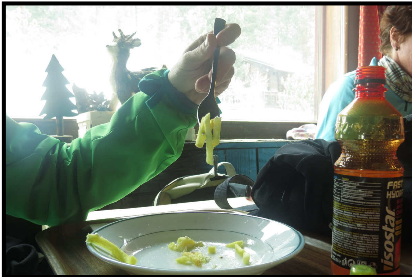
... da braucht's erstmal 'ne Ladung Pommes ;)