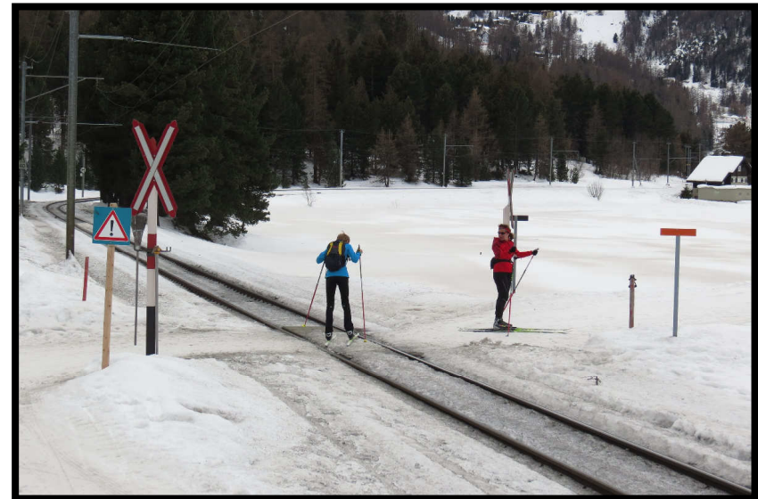
Und jetzt schnell die Schienen gequert, bevor der Bernina-Express kommt!