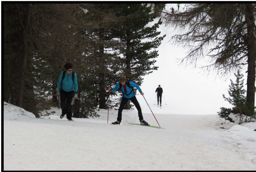
Der Schanzenaufstieg, im Rennen ein Flaschenhals,