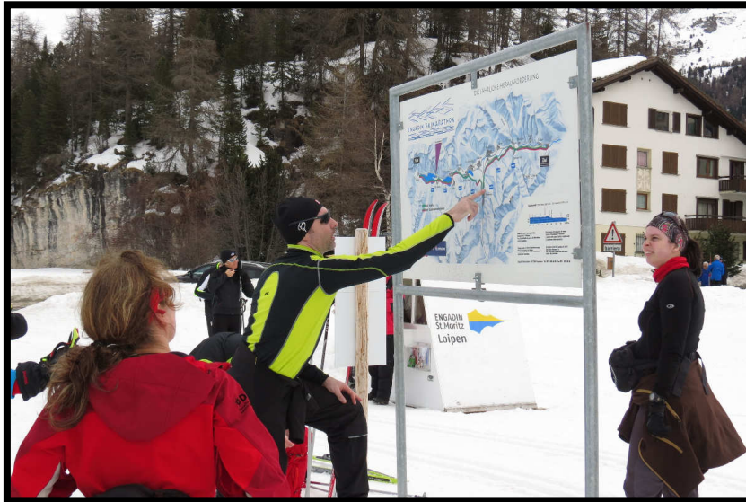
Oder besser dort hin???