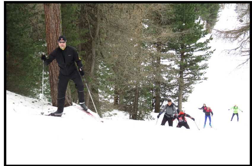
bei uns mit viel Platz, aber trotzdem steil.