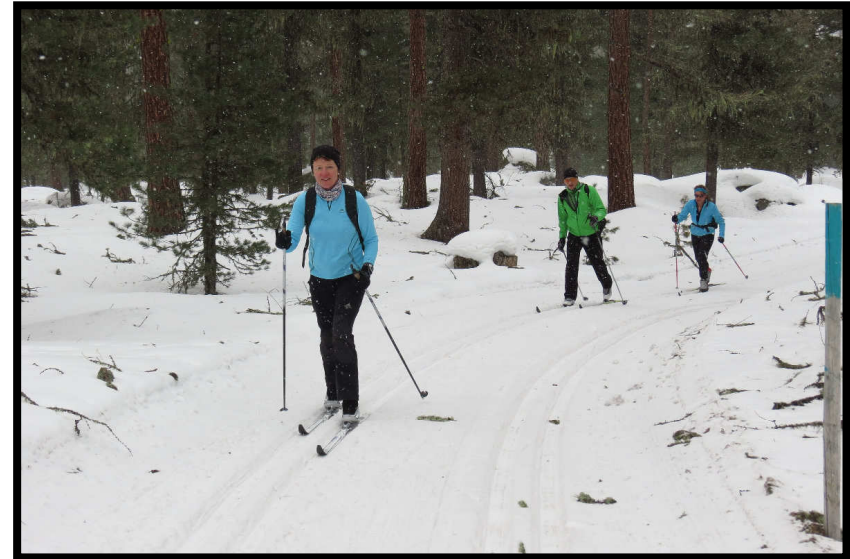
Im Rosegtal, vereiste Loipen, Lawinensperrung und viel Flora in der Spur ...