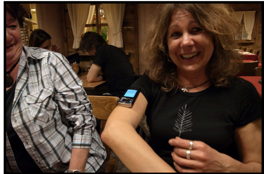
ob die Schwingungen wirken???