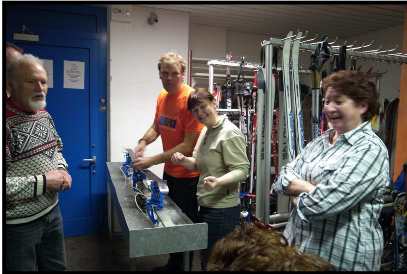
Nach vielen Kilometern ist gute Stimmung (mit Bier und ohne Prosecco!) beim Skiwaxen ☺