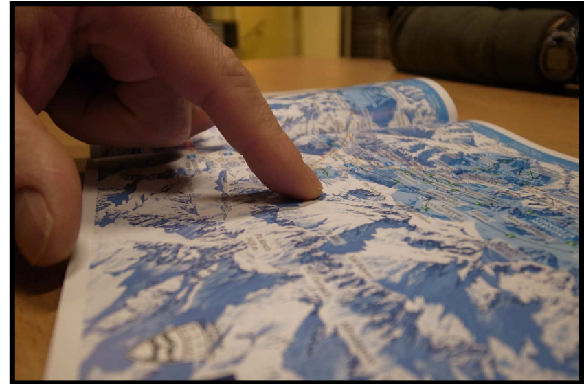
denn DA geht's am nächsten Tag hin: