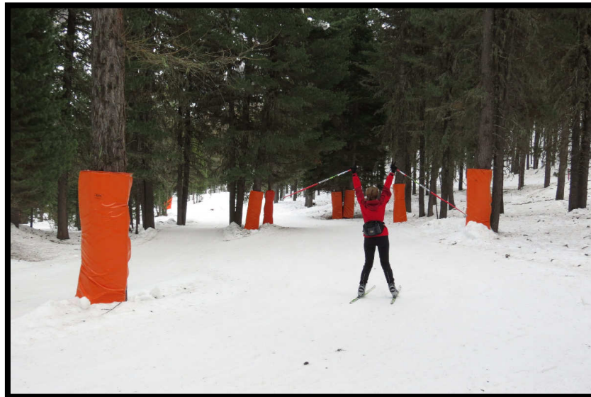
und endlich am berühmigten Starzer Matratzenbuckell!