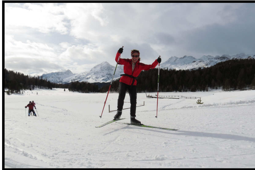
Alles Starz oder was? Am Starzer See,