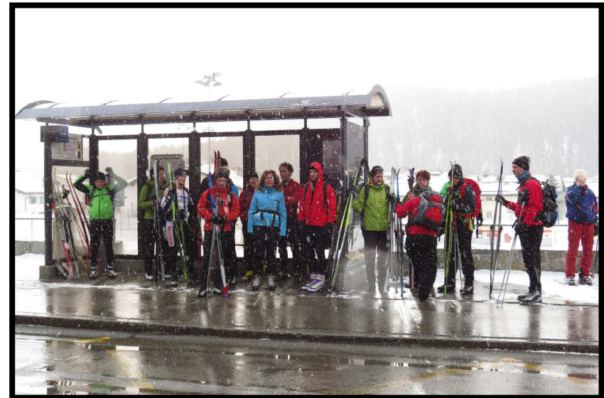
Warten im Schneegestöber auf den Bus nach Morteratsch.