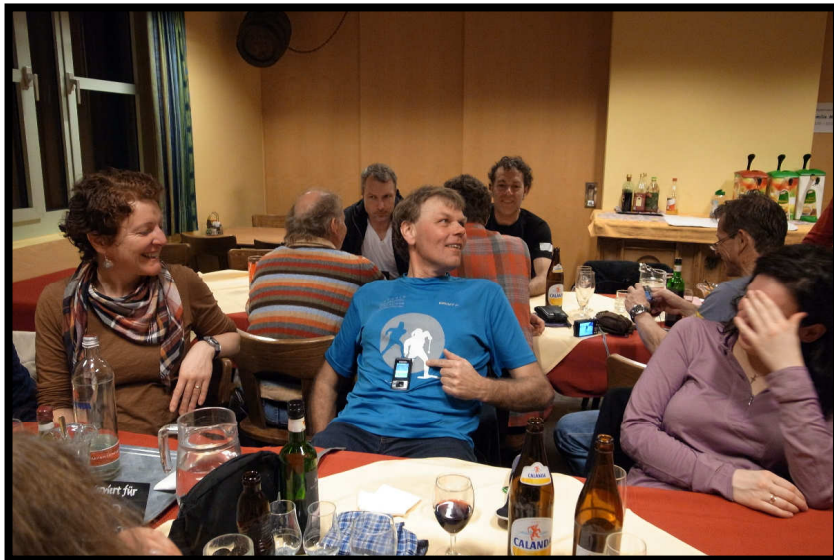
Alles für die Gesundheit: Vibrationsalarm am Handy,