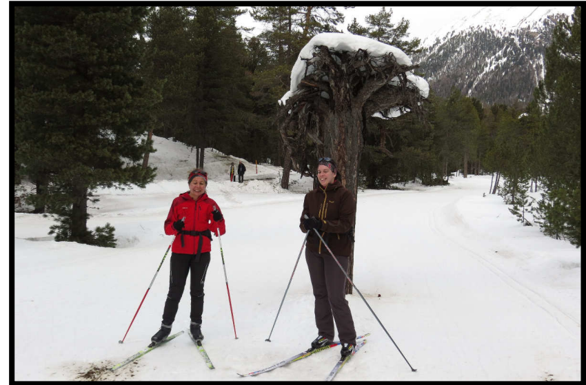
im Starzer Wald,