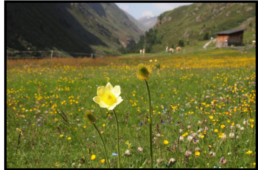
Erstmal immer dem wildromantischen Rofental folgen.