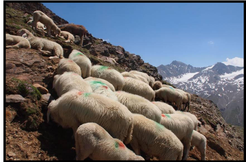
Kunst am Schaf, könnte glatt als Wegmarkierung durchgehen ;)