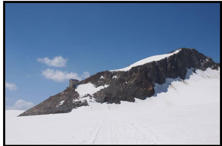
Zum Greifen nah, kostet bei dieser Hitze aber doch noch einiges an Schweiß: das Brandenburger Haus.