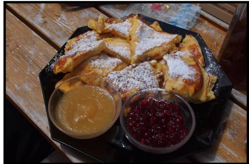
Kaiserschmarrn! Natürlich mit Grangln ;)