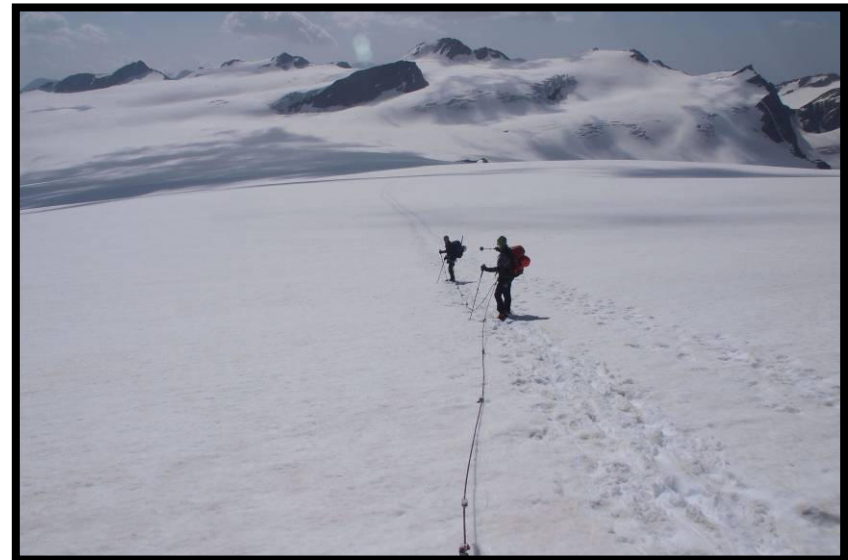
Alles im grünen Bereich, der Beweis: Abstieg fast ;) ohne Schlangelinien!