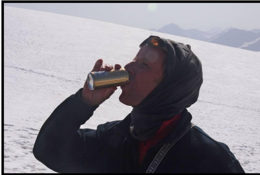
... und Prosecco on the rocks ;)