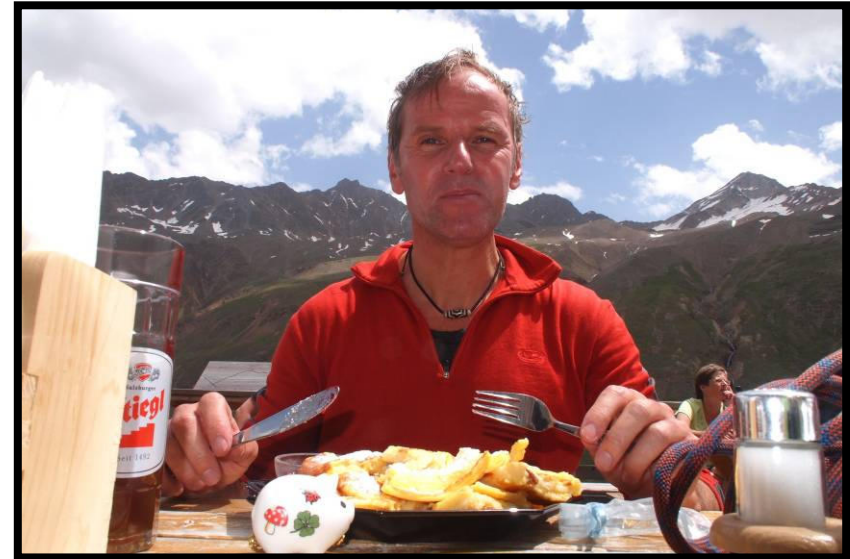
Heri mit Kaiserschmarrn mit allem, nicht nur mit Grangl ;)