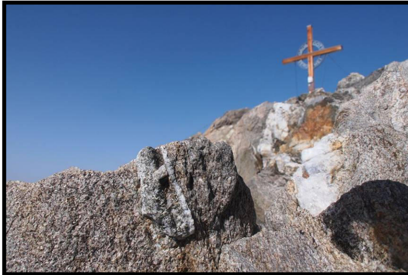
Ein letzter Schritt zum Gipfel ...