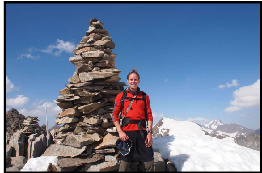
OK, am letzten Tag im 50. Lebensjahr können einem schon mal die Haare zu Berge stehen ;)