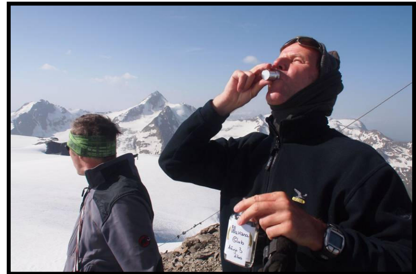
Original Rum aus Cuba ...