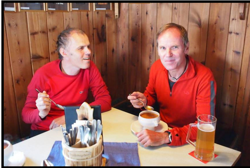
Die Suppe war schnell geschlürft,