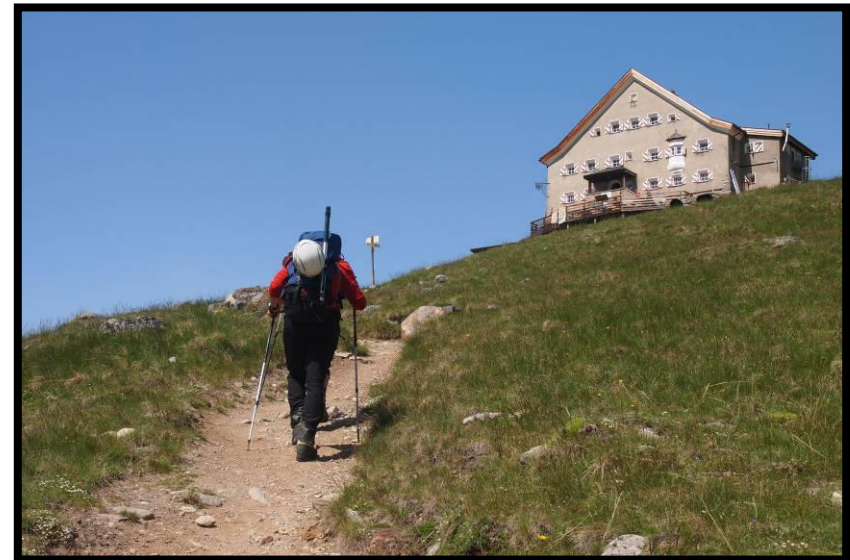
Schneller als die Alpingendarmerie erlaubt, das Hochjochospiz (2413 m) erreichen wir nach knapp 2 Stunden.