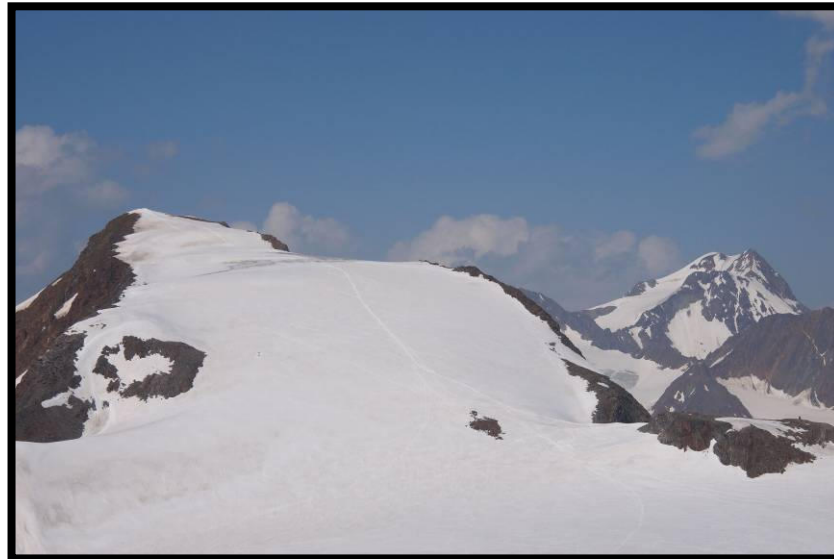
Fluchtkogel und Wildspitze ...