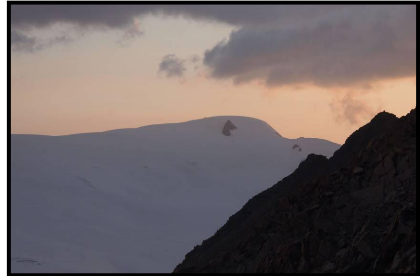
Im letzten Abendlicht das Ziel des nächsten Tages: die Weißseespitze (3526 m).