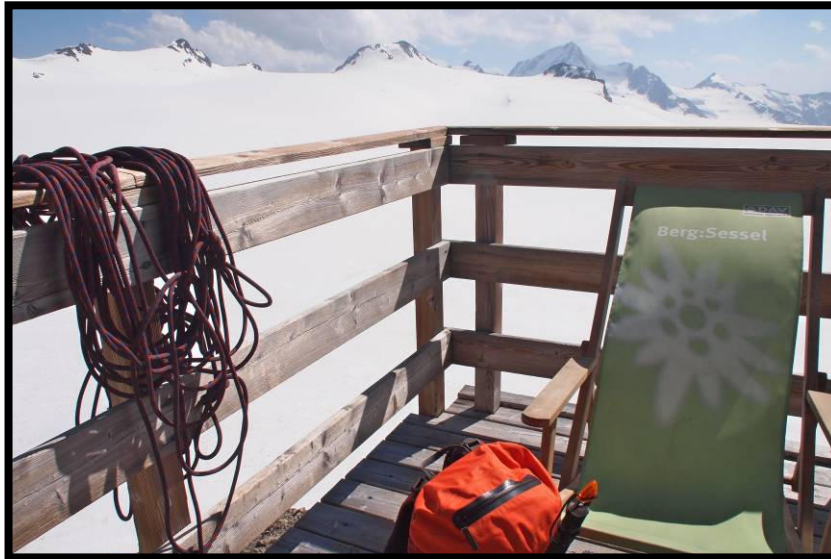
Wellnessecke auf fast 3300 m ;)