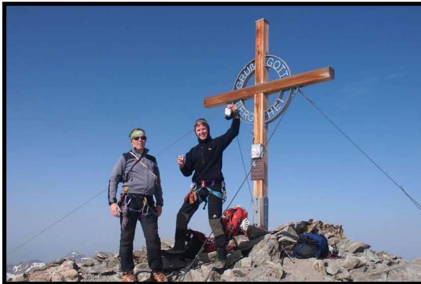
Wichtig dabei immer: die richtigen Getränke!