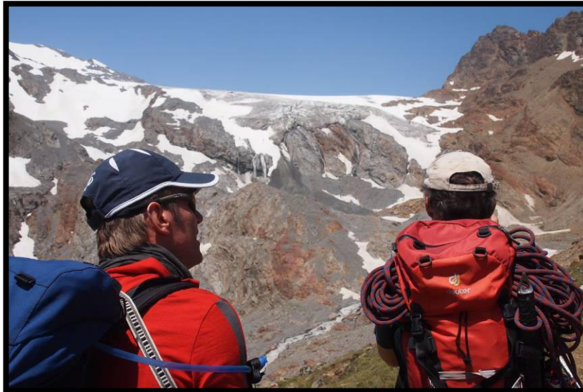
Kesselwandferner in Sicht, er trennt uns noch vom Brandenburger Haus.