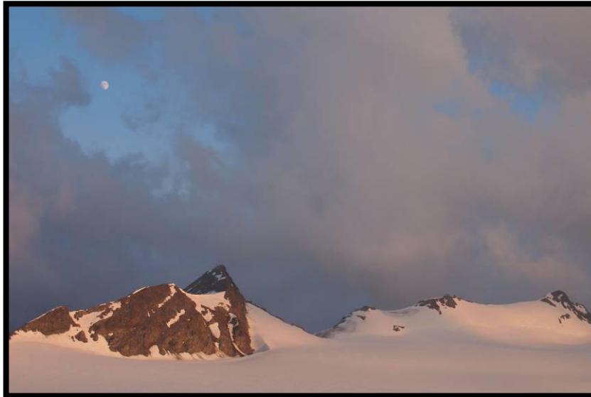
Abendstimmung über den Hintereisspitzen.