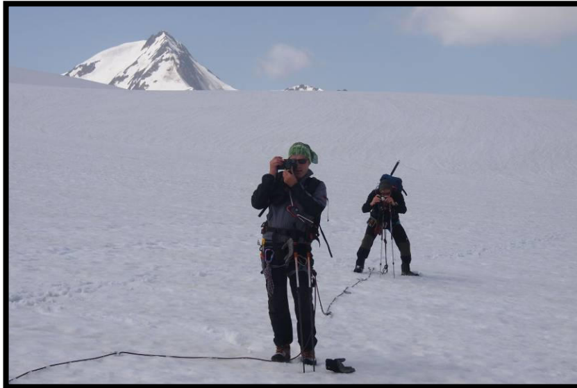
Bei so einem Motiv klicken alle Fotoapparate: