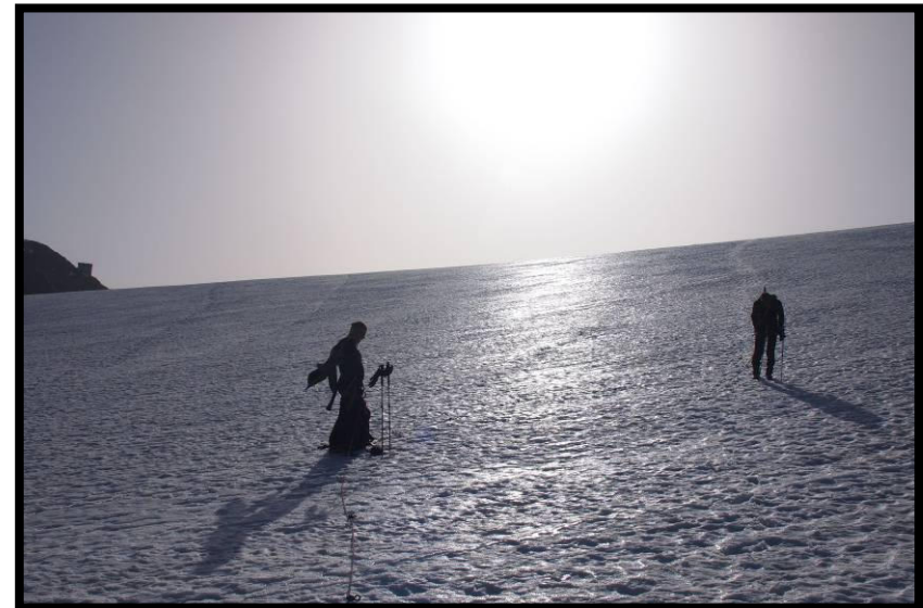
Ruckzuck war's wieder super warm, trotz Föhnsturm!