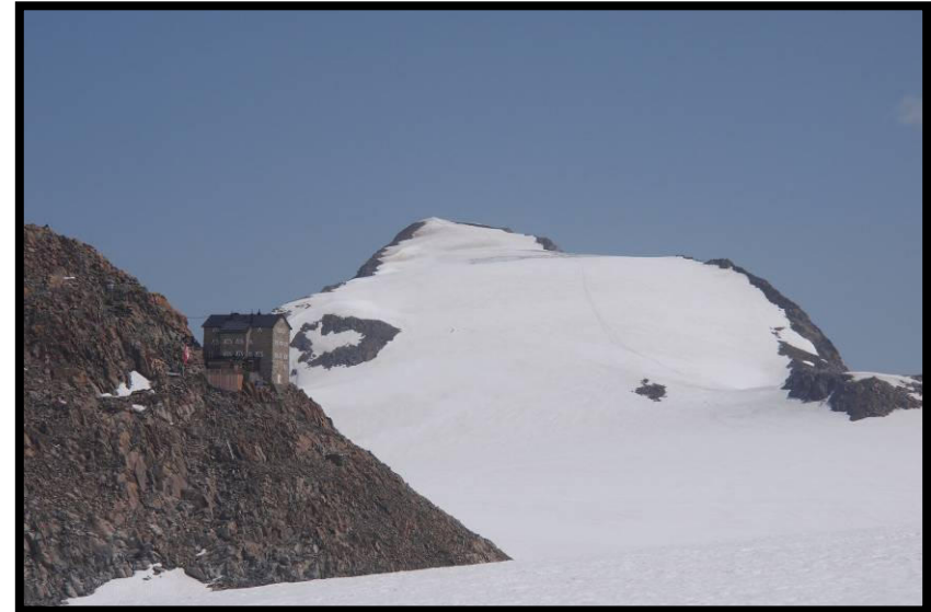
wie ein Schloss thront das Brandenburger Haus über'm Kesselwandferner.