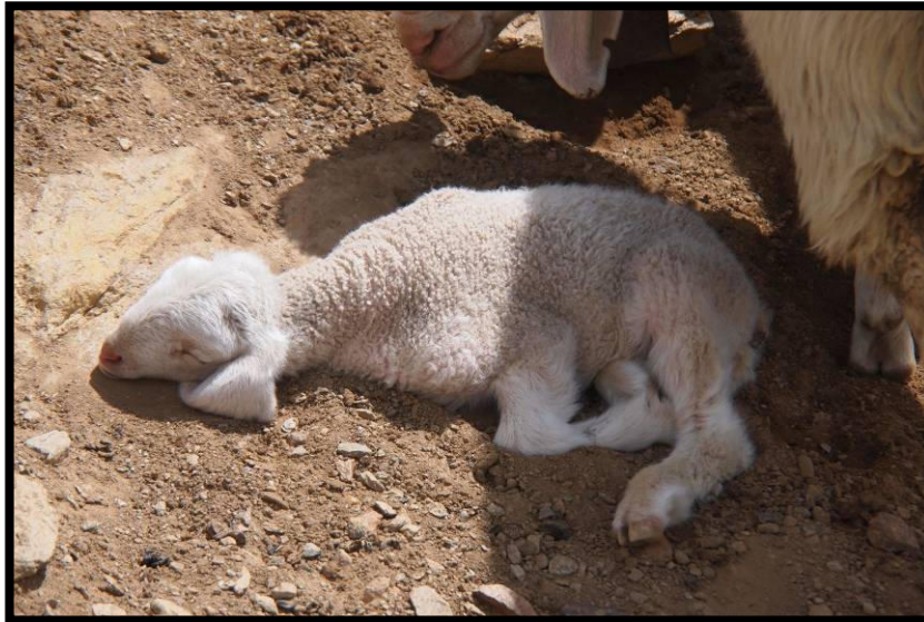
Lehnt jede Verantwortung in Sachen Wegebau ab, das Venter Junglamm :)