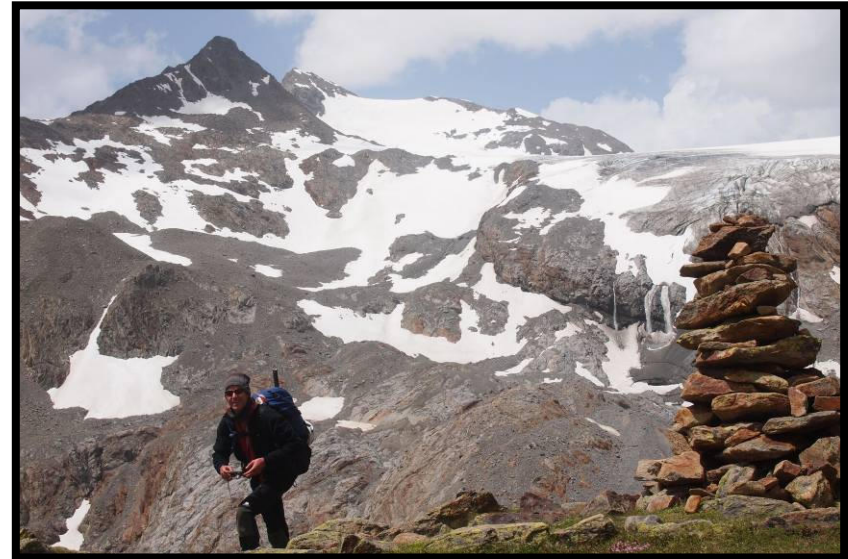
Am Geburtstag darf man schon mal ins Bild laufen, Heri vor der Mutspitze.