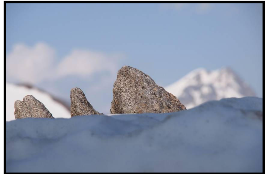
... die vom Brandenburger Haus aus definitiv nicht bestiegen werden kann.