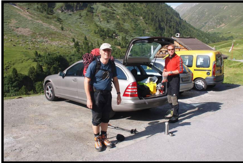
Abmarsch in Vent (1900 m).