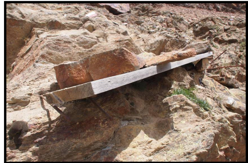
Gewagter Wegebau auf dem Deloretteweg ;)