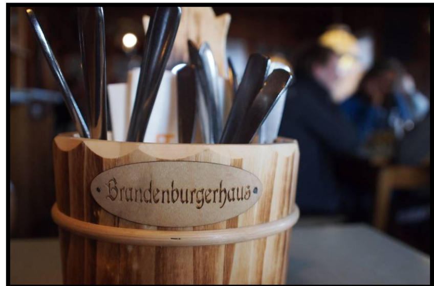
bevor die jüngste Hüttenwirtin Tirols (23 !) zum Abendessen ruft ☺