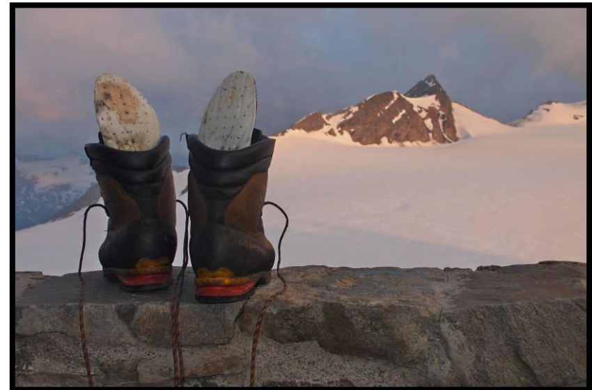
Definitiv genug Gelaufen für heute!