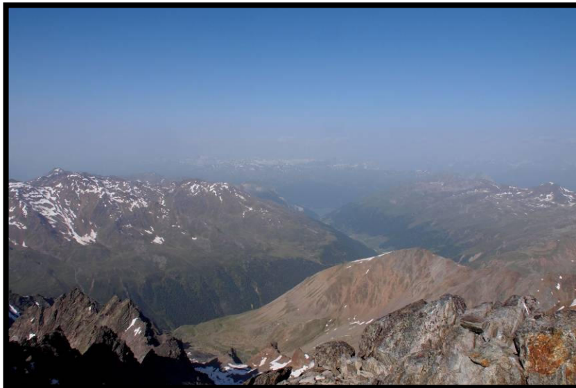
und voller Kontrast: mildes Vinschgau links unten.