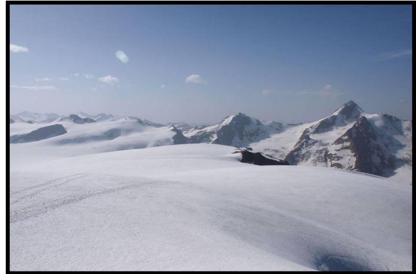
Darf man vor lauter Feiern nicht vergessen, die Aussicht: arktische Gletscherflächen rechts,