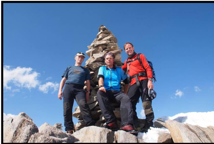
Dahmannspitze (3401 m), Gott sei Dank nur ein Katzensprung von der Hütte.