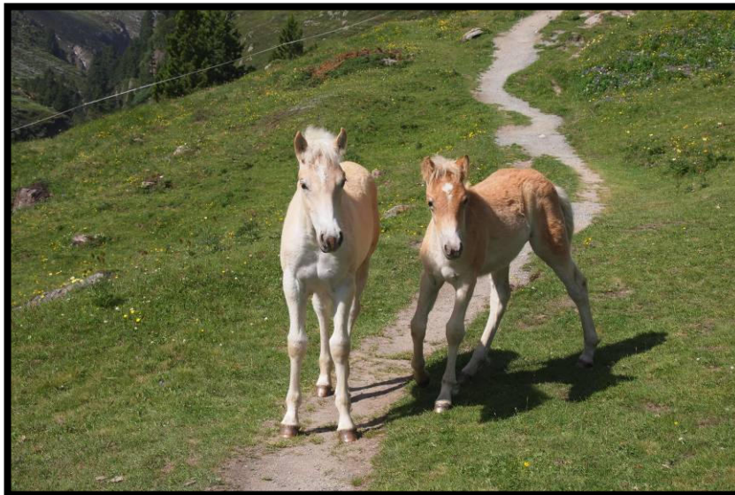
Klare Ansage: das ist unser Weg! Wegfreigabe nur für mindestens ein Mal Streicheln ;)