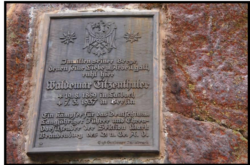
... wobei dieser Brandenburger definitiv zu wenig O 2 im Kopf hatte ☹