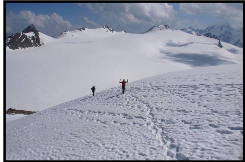
Nur nicht zu lange Chillen, denn auf die Dahmannspitze müssen wir schon noch hoch!