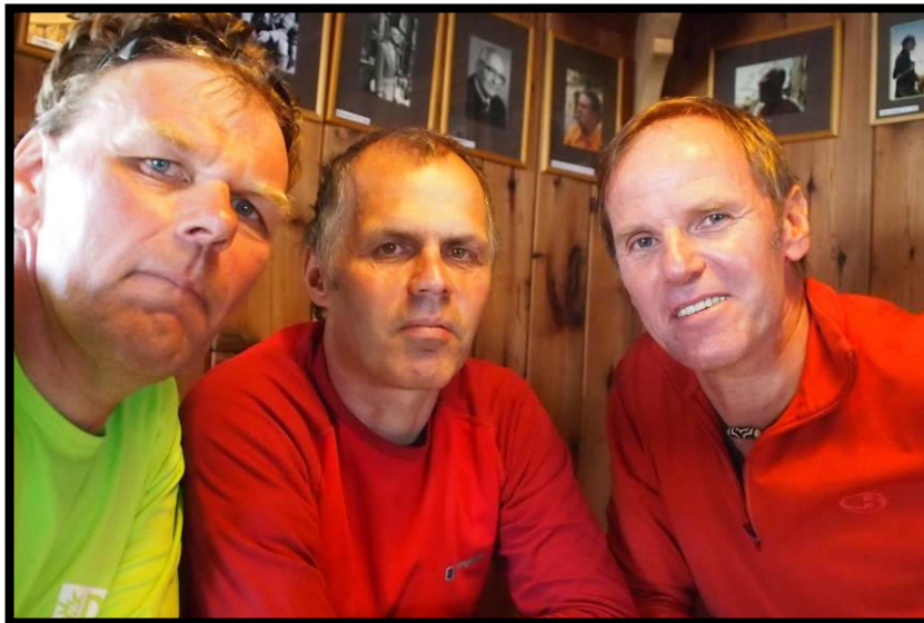
Am Ende des Menus: vollgefutterte Remstaler Bergsteiger.