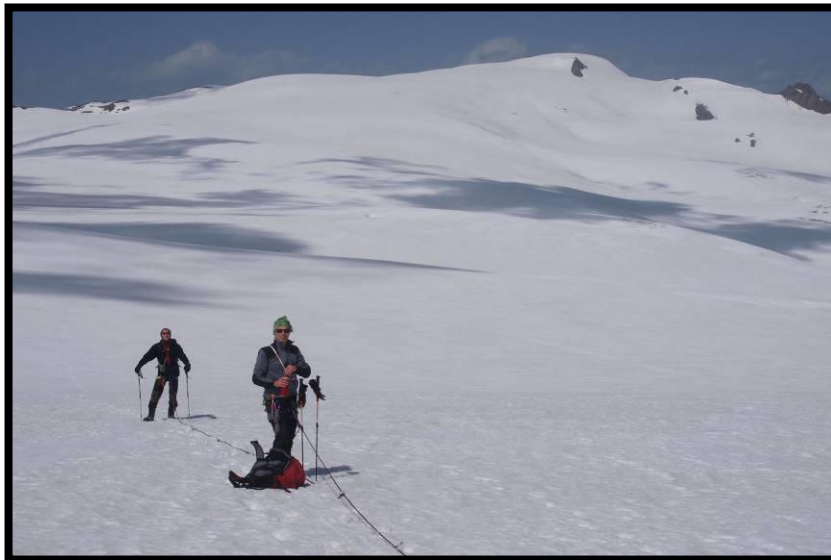
Blick zurück zur schönen Weißseespitze (3526 m).