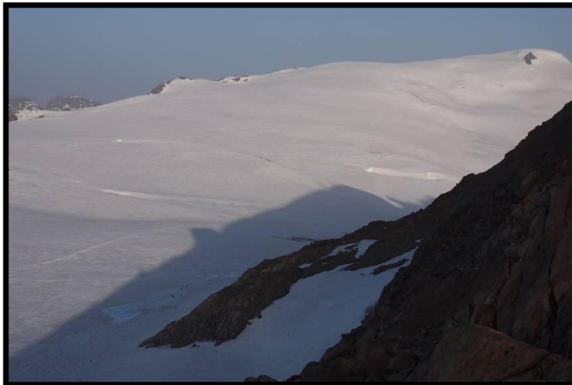
Scherenschnitt: Dahmannspitze mit Brandenburger Haus, in echt dahinter: die Weißseespitze.