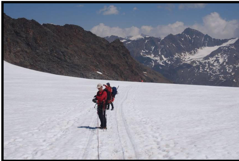
Jetzt wird's richtig heiß, um 14 h weichgekocht auf dem Kesselwandferner.