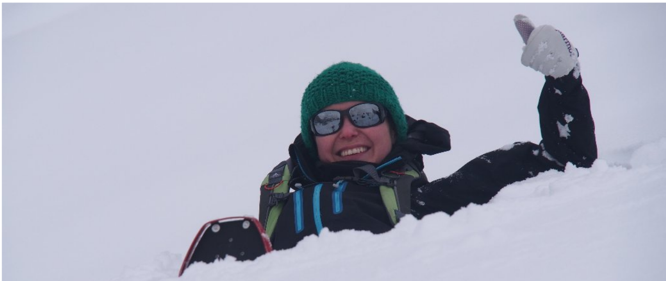
Nachdem alle ausgegraben waren ...