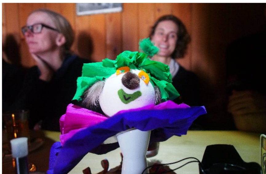
... und Faßnetsfiguren in der urigen Burglhütte.