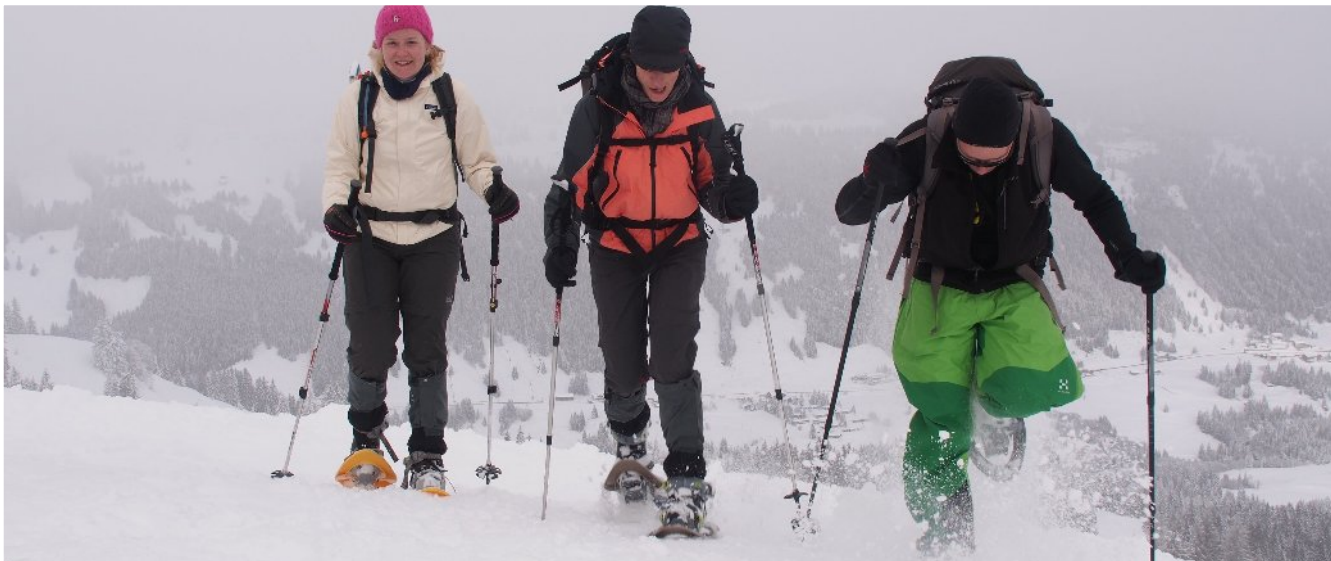
Letzter Tag, der Burstkopf (1559 m) steht an.