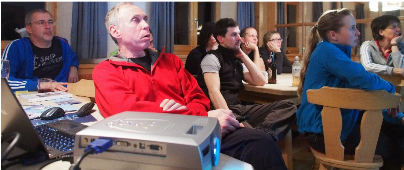
Theorie und Tourenplanung am ersten Abend,