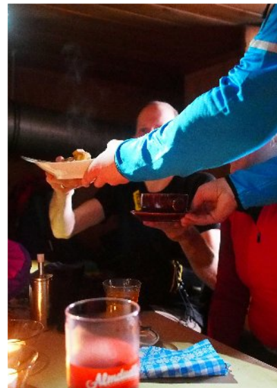
Kursausklang, bei Bier, Vesper, Schummerlicht ...