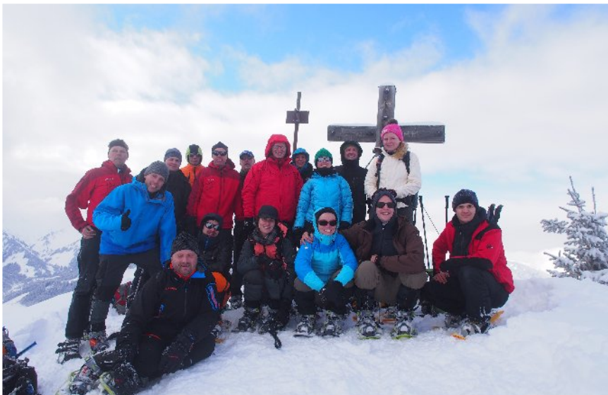
Erst Gipfelglück, dann Schaufeln!!!