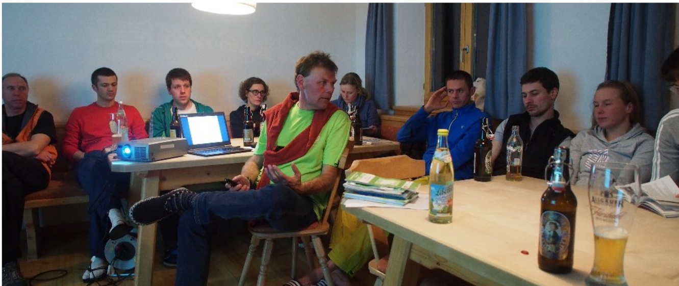
... wieder Theorie und Spaß am 2. Abend!