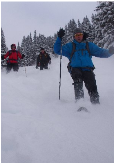
Flotter Abstieg, nur echt mit Überschlag ...