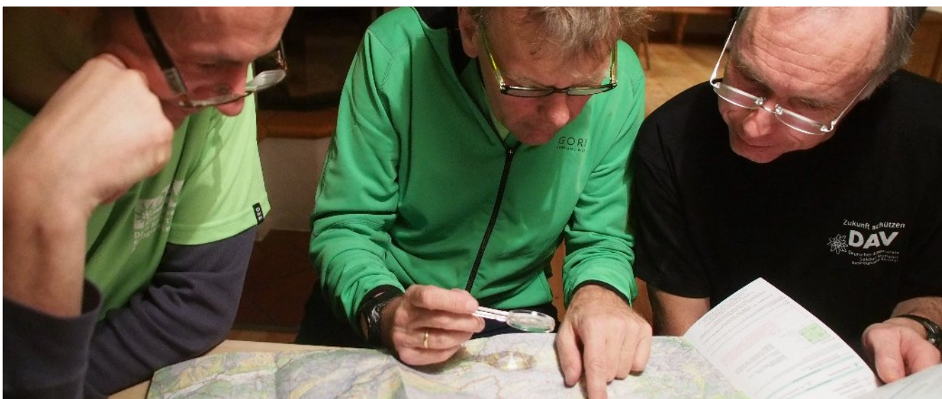
... und ein bisschen Spaß natürlich auch ;)