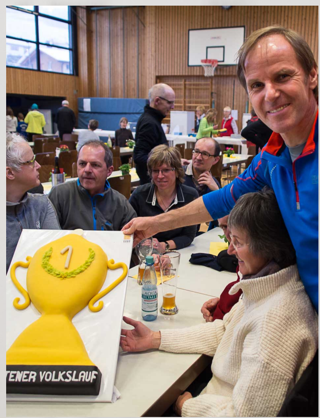
oder bei der Ehrung der größten Mannschaft ... klar, wir waren's :)