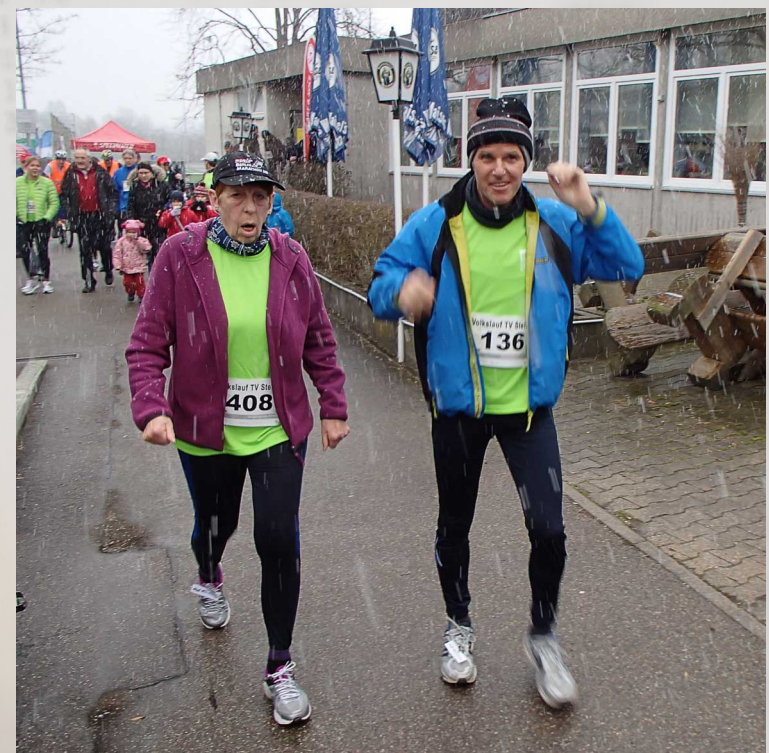
Kalter Start im Schneegestöber und nur den Hunden ist ein Bauchwärmer vergönnt!