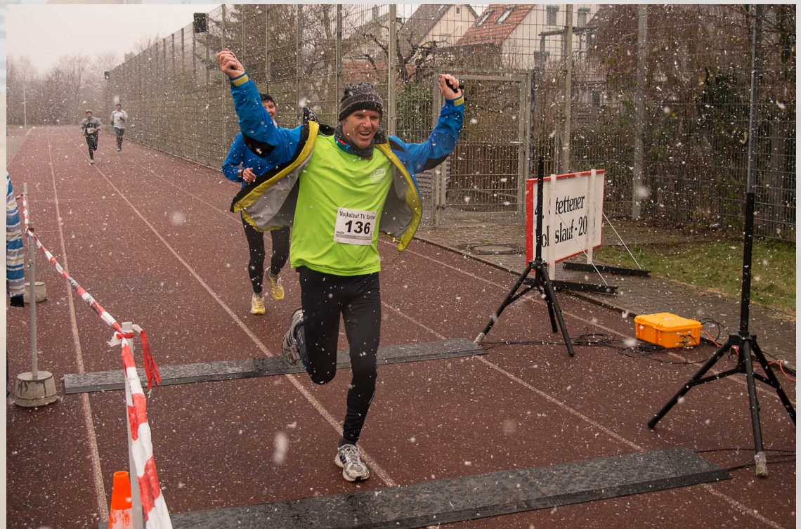
Auf der Strecke und im Ziel, der Schneefall läßt nicht nach an diesem 'Frühlingstag'.