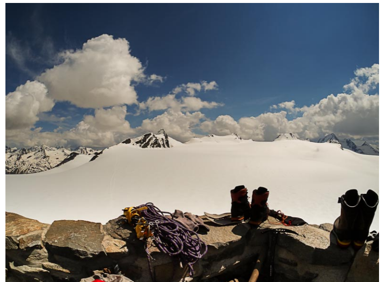
The Top of DAV - das Brandenburger Haus, mit 3277 m höchste Hütte des DAV!